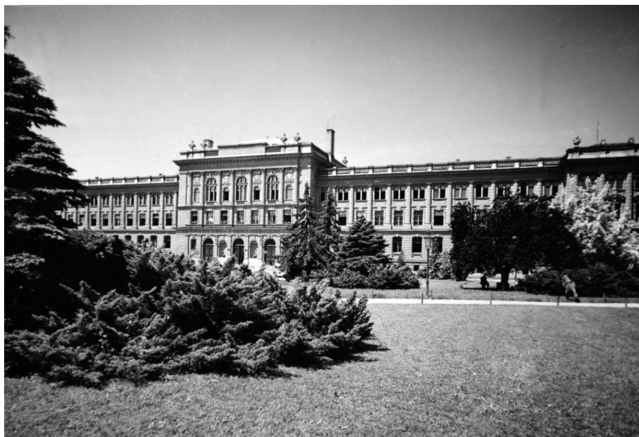
Donjogradska klasična gimnazija u Zagrebu

Zbog ratnih prilika, ali češće zbog nedovoljnog prostora škola se često selila. Započela je sa svojim radom u grkokatoličkom sjemeništu (Ćirilometodska 1), zatim je u Popovu tornju (Opatička 22), pa u zgradi Meteorološkog zavoda (Grič 3). Neko je vrijeme djelovala i u Ilici 30/Frankopanskoj 1, na Rooseveltovu trgu 5, na Šalati, Katarininu trgu 5 i konačno se opet vraća na Rooseveltov trg 5.