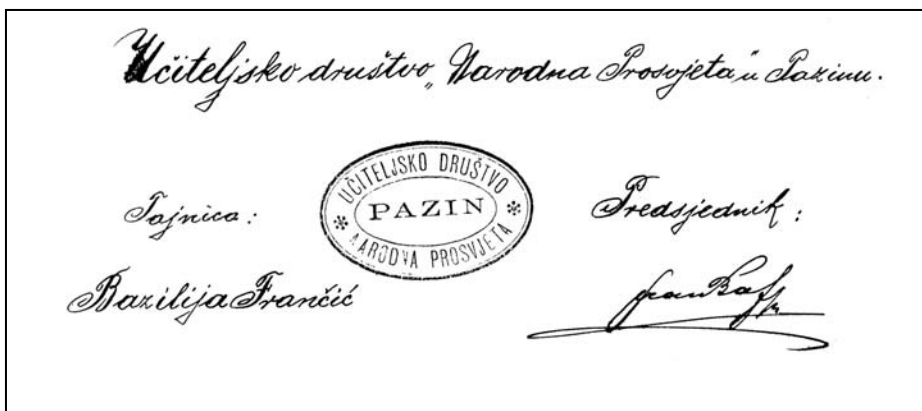
Učiteljsko društvo “Narodna Prosvjeta”, žig 11.7.1902.