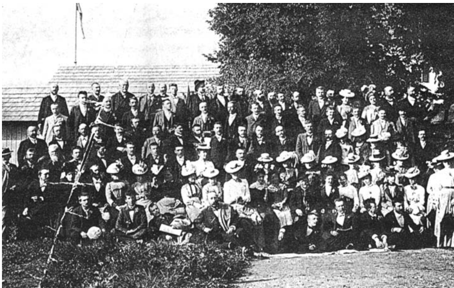
XIII. skupščina “Zaveze avstr. jugoslovanskih učiteljskih društva” na Bledu, 26.5.1901., (SŠM, razstavna zbirka, inv. št. 1518)