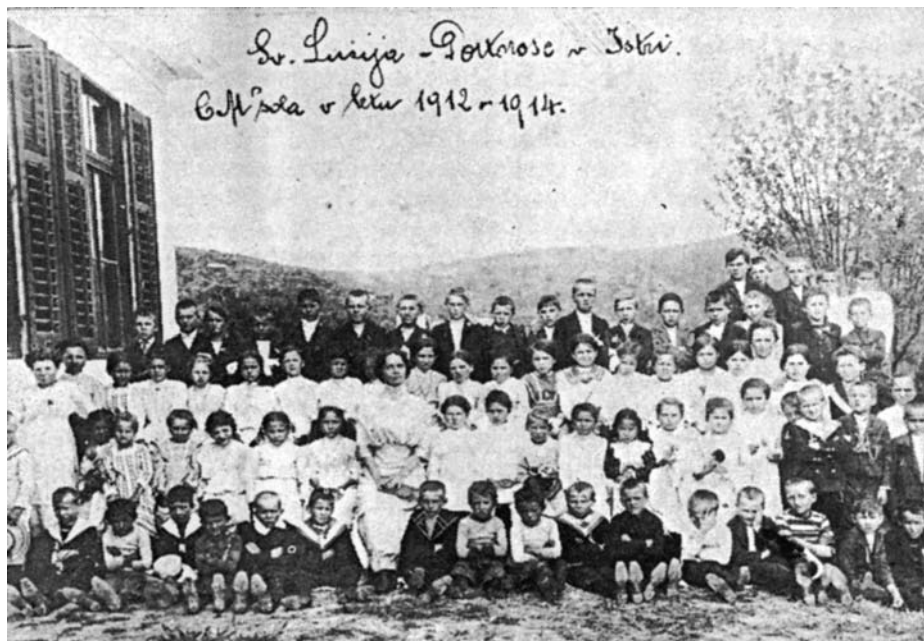
Učenci in učenke z učiteljico šole istrske CMD v Sv. Luciji pri Portorožu, 1912.–14.

V XX. stoletju smo Slovenci živeli vsaj v šestih državah: Avstro–Ogrska, prva Jugoslavija, med drugo svetovno vojno smo bili razdeljeni na Nemčijo, Italijo in Madžarsko, po njej pa sicer večinoma v Sloveniji kot federalnem delu druge Jugoslavije – in po razpadu skupne jugoslovanske države od 1991. v samostojni Sloveniji, hkrati pa vsaj še v Italiji, Avstriji, pa tudi na Madžarskem. Spremenljivi državni okvirji in spremenljive politične razmere so vplivale na različne šolske razmere in zakonodajo. 40)