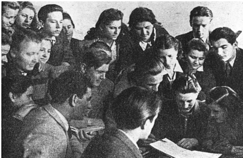
Pedagoški tečaj v Kranju

goškega tečaja. Ta rok so kasneje podaljšali do konca koledarskega leta 1953., nato pa do 1. aprila 1956.