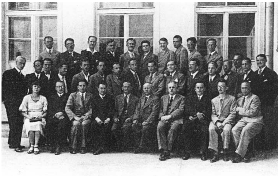
Udaležnici četrtega zadružno–knjigovodskega tečaja, ki ga je leta 1933. organizirala učiteljska organizacija