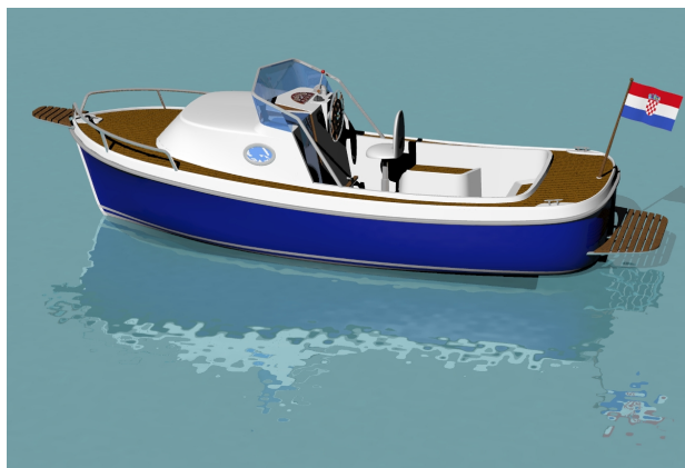
Slika 8. 3D-model plovila Figure 8. Craft 3D model

3D-model plovila izrađen je za daljnju razradu projekta i za marketinške svrhe, slika 8.