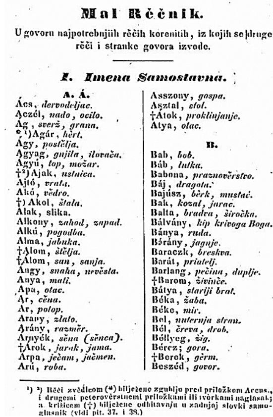
Slika 3. Početak rječničkoga popisa imenica u Bielakovoj gramatici.

Strukturirana dakle kao jezični priručnik koji osim opisa gramatičkih sastavnica ciljnoga jezika uključuje rječničke, dijaloške i književne sadržaje, Bielakova gramatika ostaje u okvirima dopreporodnih hrvatskih gramatika (usp. Ptičar 1990; Kolenić 1998). Takva se tradicija u gramatičkim opisima u Trojedinici napušta do kraja 19. stoljeća (usp. Brlobaš 2015: 462), ali ne i izvan njezinih granica jer gramatike u kojima su hrvatski i mađarski jezik zauzimali mjesto polaznoga