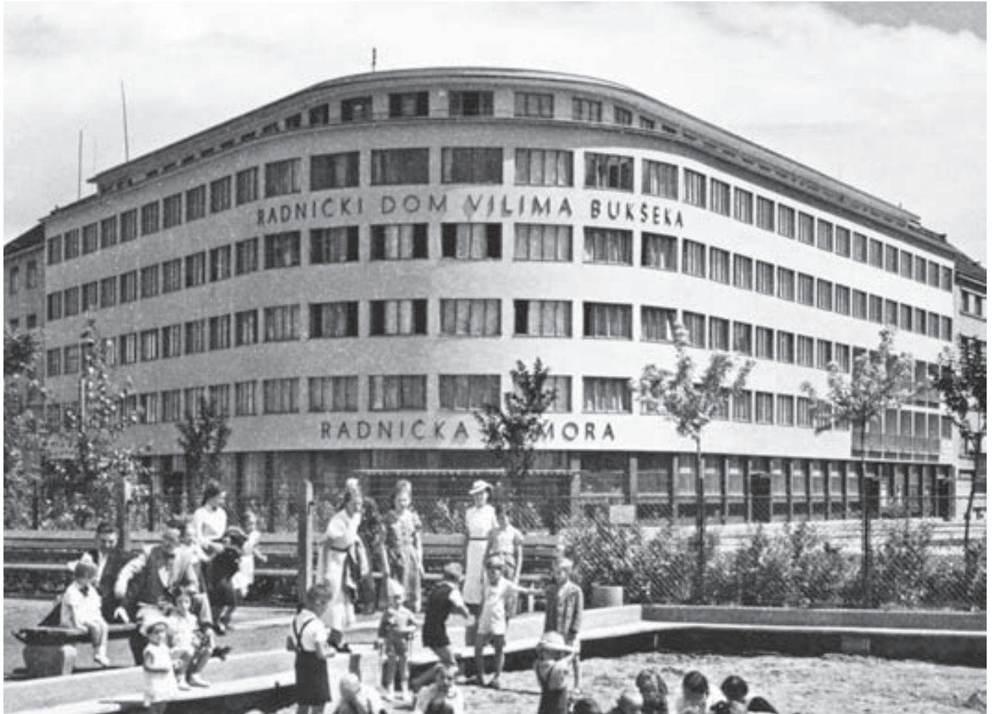
Sl. 1. Ugrađena uglovna upravna, poslovna i stambena javna zgrada Radničke komore u Zagrebu , Trg kralja Petra Krešimira IV. 2, 1935.-38., suautor arh. Jovan Korka Fig. 1 CORNER TERRACED APARTMENT HOUSE – ADMINISTRATIVE, OFFICE, AND RESIDENTIAL PUBLIC BUILDING OF THE WORKERS’ CHAMBER IN ZAGREB, KING PETAR KRESIMIR IV SQUARE 2, 1935-38, CO-AUTHOR ARCHITECT JOVAN KORKA