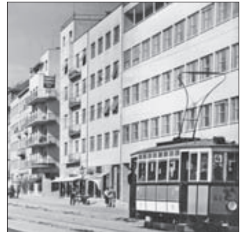
SL. 16. UGRAĐENA UPRAVNA I STAMBENA JAVNA ZGRADA JAVNE BURZE RADA, KRALJA ZVONIMIRA 15, 1935.-37., SUAUTOR ARH. JOVAN KORKA

Međutim, samo na taj način dadu se tumačiti riječi suvremenika: Potocnjakov navod dopri-