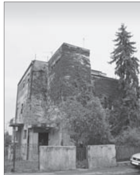
SL. 12. SAMOSTOJEĆA STAMBENA ZGRADA MOSINGER, PANTOVČAK 112, 1930.-31.

ZP34. (Sl. 21.) Poluugađena stambena zgrada – Gajdekova 16, visine 4 etaže, s terasom i plitkim trostrešnim kosim krovom. Karakterističan tlocrt sadrži jedan četveroosobni stan, dok se pomoćne prostorije nalaze u suterenu. Zidanica s betonskim stropovima i drvenim grednikom, stupovima zidanim u cementnom mortu i masivnim stubama. Zgrada s pročeljem Novoga građenja i kosim krovom.