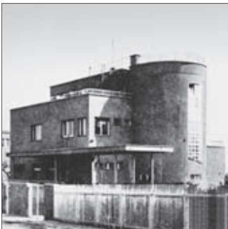
FIG. 15 RESIDENTIAL DETACHED HOUSE RADAN, JABUKOVAC 39, 1931-32