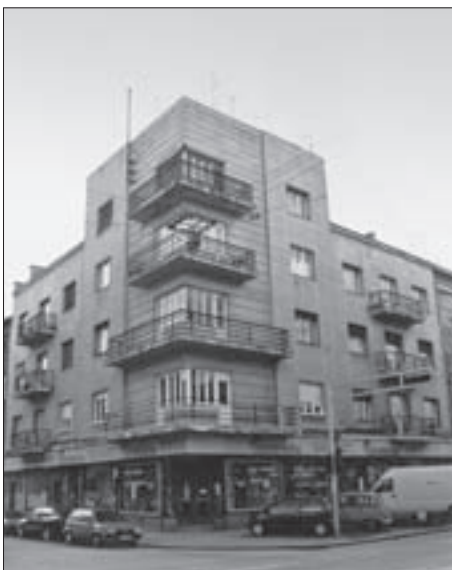
SL. 11. UGRAĐENA UGLOVNA STAMBENA I TRGOVAČKA NAJAMNA ZGRADA EISENSTÄDTER , DEŽELICEV PRILAZ 85, 1930.-31. FIG. 11 RESIDENTIAL AND COMMERCIAL CORNER TERRACED APARTMENT HOUSE FOR RENT EISENSTÄDTER , DEŽELICEV PRILAZ 85, 1930-31

ZP09. (Sl. 7.) Ugrađena uglovna stambena najamna zgrada – Trg kralja Petra Kresimira IV. 17, visine 7 etaža, sa srednjim dvorišnim svjetlikom te jednostrešnim kosim krovijem i ravnim krovom. Karakterističan tlocrt sadrži tri trosobna stana na stubište. Zidanica sa stropovima od drvenoga grednika, drvenim krovijem, stupovima zidanim u cementnom mortu, stropovima nad podrumom od armiranog betona i masivnim stubama koje su oslonjene na čelične traverze. Zgrada sa dva pročelja koja konvergiraju Novom građenju, sa po 4 prozorske osi na svako pročelje. Oblikovanje ugla riješeno je izbačenim dijelovima pročelja sa spojnim balkonom oko zaobljenog ugla u prvom katu, iznad kojeg su zaobljeni plastično oblikovani balkoni, te razdjelnim vijencima u svakom katu.