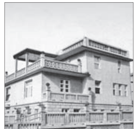
SL 9. SAMOSTOJEĆA STAMBENA ZGRADA BEDEKOVIC-SCHINDLER, GRŠKOVIĆEVA 15, 1928.-30. FIG. 9 RESIDENTIAL DETACHED HOUSE BEDEKOVIC-SCHINDLER, GRŠKOVIĆEVA 15, 1928-30

ZPo4. Samostojeća stambena zgrada – Tuškanac 27. Opis ove neizvedene zgrade tek se u detaljima razlikuje od opisa prethodne zgrade, Tuškanac 25.