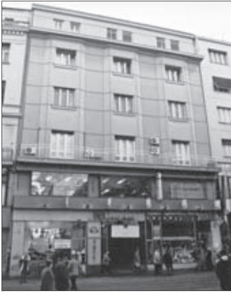
SL. 10. UGRAĐENA STAMBENA, POSLOVNA I TRGOVAČKA NAJAMNA ZGRADA EBENSPANGER , ILICA 15, 1929.-30. FIG. 10 RESIDENTIAL, OFFICE, AND COMMERCIAL TERRACED APARTMENT HOUSE FOR RENT EBENSPANGER , ILICA 15, 1929-30