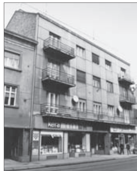
FIG. 13 RESIDENTIAL, OFFICE, AND COMMERCIAL TERRACED APARTMENT HOUSE FOR RENT EISENSTÄDTER, ILICA 186, 1930-31