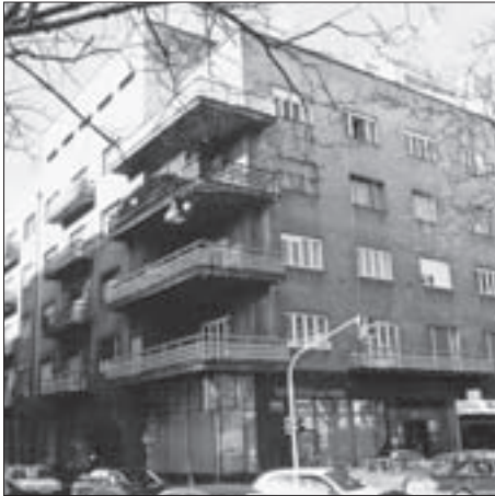
SL. 14. UGRAĐENA UGLOVNA STAMBENA, TRGOVAČKA I POSLOVNA NAJAMNA ZGRADA ROSINGER-JUNGWIRTH, DRASKOVIĆEVA 30, 1930.-31.

FIG. 14 RESIDENTIAL, COMMERCIAL, AND OFFICE CORNER TERRACED APARTMENT HOUSE FOR RENT ROSINGER-JUNGWIRTH, DRASKOVIĆEVA 30, 1930-31