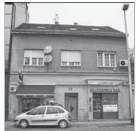
FIG. 17 RESIDENTIAL AND COMMERCIAL APARTMENT HOUSE FOR RENT PALČIĆ, OZALJSKA 8, 1935-36