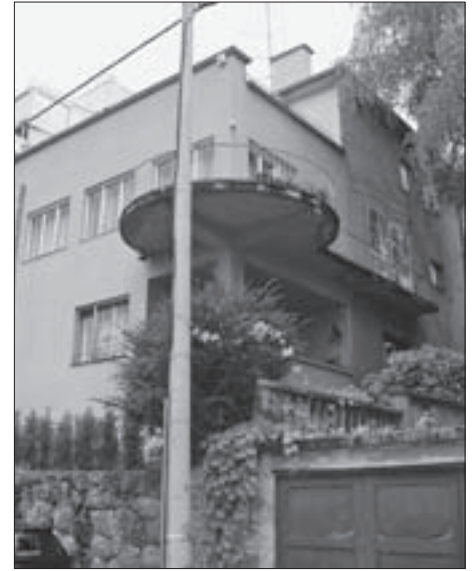
SL. 18. UGRAĐENA STAMBENA NAJAMNA ZGRADA PICK, DEZMANOV PROLAZ 8, 1935.-36. FIG. 18 RESIDENTIAL APARTMENT HOUSE FOR RENT PICK, DEZMANOV PROLAZ 8, 1935-36