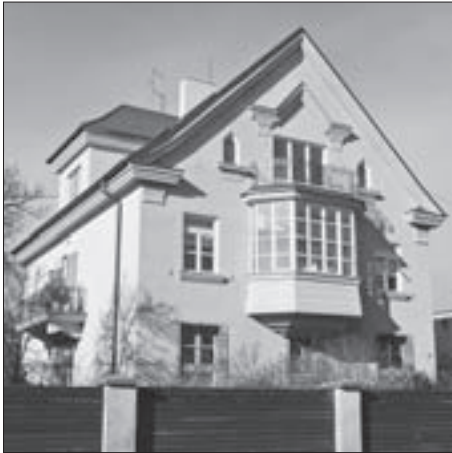
SL. 4. SAMOSTOJEĆA STAMBENA ZGRADA SCHÖNBAUM , TUŠKANAC 25, 1926.

FIG. 4 RESIDENTIAL DETACHED HOUSE SCHÖNBAUM , TUŠKANAC 25, 1926