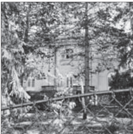
FIG. 6 RESIDENTIAL DETACHED HOUSE BOGDANOVIC , TUŠKANAC 90, 1927-29