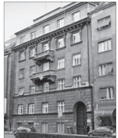
FIG. 3 RESIDENTIAL TERRACED APARTMENT HOUSE FOR RENT “OMEGA” FOR HOUSING CONSTRUCTION, KING ZVONIMIR ST. 3, 1923-24