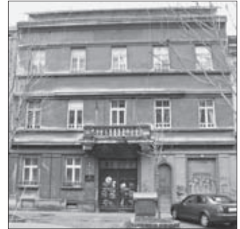
SL 7. UGRAĐENA UGLOVNICA STAMBENA NAJAMNA ZGRADA DRAGANEĆ, TRG KRALJA PETRA KRESIMIRA IV. 17, 1927.-28. FIG. 7 RESIDENTIAL CORNER TERRACED APARTMENT HOUSE FOR RENT DRAGANEĆ, KING PETAR KRESIMIR IV SQUARE 17, 1927-28