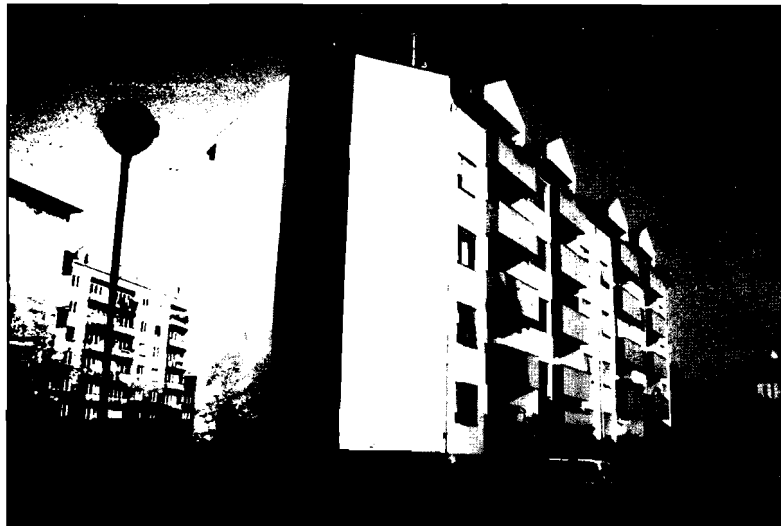
Slika 6. Stambena zgrada u Karlovcu