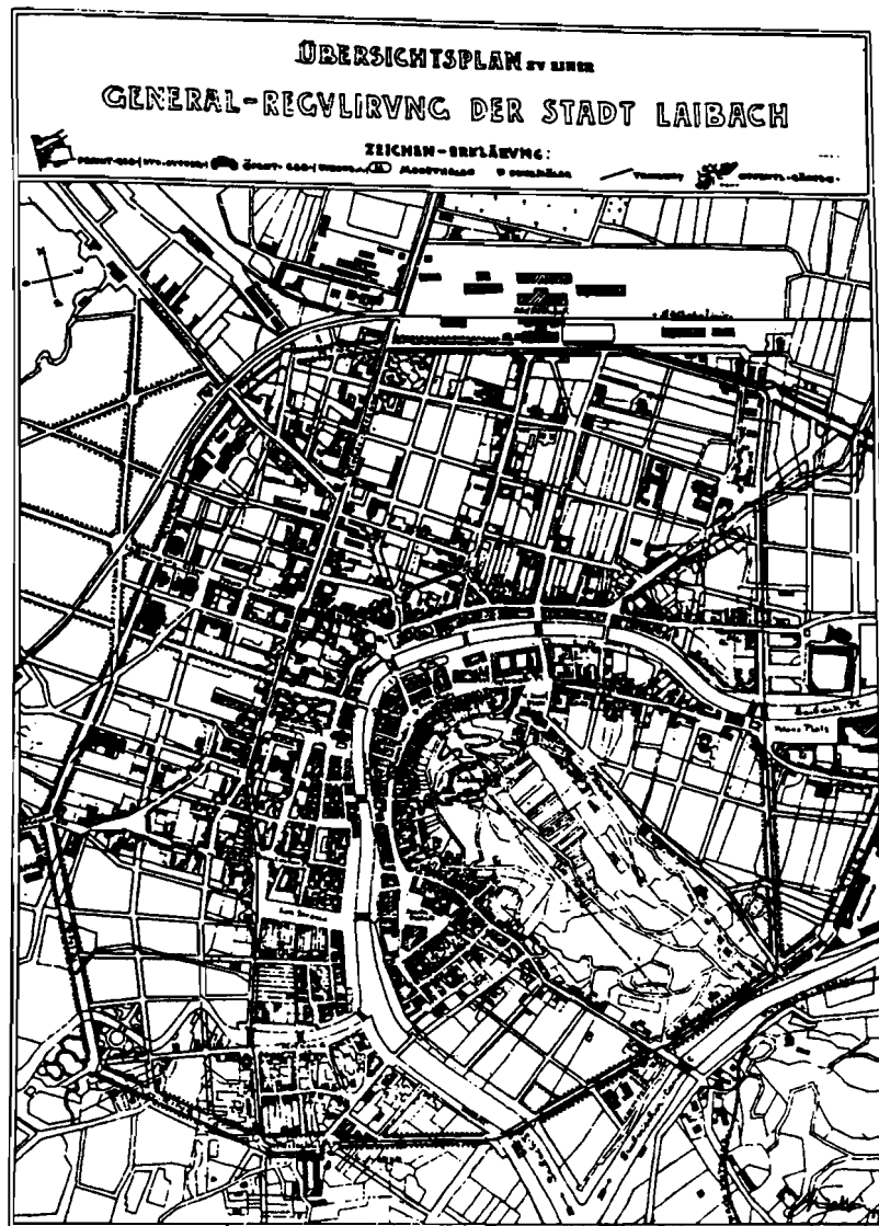
Slika 3. Pregledni plan Fabianijeve opće regulacije grada Ljubljane

tipologiji ringa ). On je proistekao iz Fabianijeve ocjene da je "arhitektonski nužno potrebno... da se na periferiji cijeli grad obujmi širokom kružnom cestom 18 , što je vidljivo na preglednom planu opće regulacije grada Ljubljane (sl. 3). 19