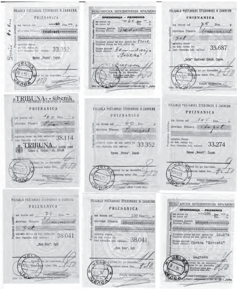
Priznanice za nabavu novina i časopisa, 1935.-1936

je, među ostalim, garantiralo aktivan kulturni, čak i politički život unutar njihovih zidina, razmjene misli i ideja, pa i bogati fond ukoričenog znanja u samostanskim knjižnicama. O važnosti knjižnice u hvarskom dominikanskom samostanu je 1525. g. govorio i njegov stanar, dominikanac Vinko Pribojević u svome znamenitom govoru naslovljenom „O podrijetlu i zgodama Slavena“, što se smatra jednim od prvih izričaja panslavenske misli. Nažalost, točan broj, sadržaj i sudbina knjižnog fonda do danas je nepoznata. U valu ukinuća crkvenih redova, udruga i samostana koje je početkom 19. stoljeća provodila francuska vlast na područjima koji su do propasti Venecije