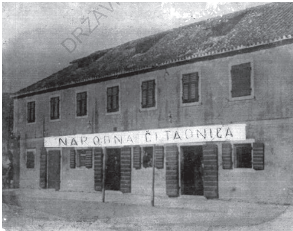
Prvo sjedište narodne čitaonice na Pjaci u Jelsi, danas Trg narodnog preporoda, fotografija s kraja 19. stoljeća.