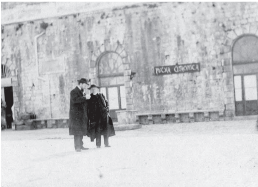
Prva javna čitaonica u gradu Hvaru na glavnom trgu (Pjaci), oko 1907.

Međutim, nastojanjem ravnateljice i ljubitelja knjižnice malo pomalo obnovljen je krov i uređeni su zatvori na zgradi. Nakon što je dvadeset godina trajala bitka za novi, adekvatni prostor gradske knjižnice i nakon što su odbačena četiri različita projekta, 2020. godine konačno se pojavila nada – prostor nove knjižnice bit će u dvorištu palače Dojmi, mjestu koje je cijelu povijest bilo isključivo vrt, odnosno zemljani nasip podignut iznad gradskog trga. U trenutku nastajanja rada u tijeku su radovi na iskapanju temelja. Nakon što knjižnica konačno pronađe novo mjesto, ostaje prevrijedan gradski prostor koji će, sukladno sad već davnoj ideji Matice hrvatske, ostati namijenjen kulturnoj svrsi. Izgradnja nove, suvremene knjižnice procijenjena je do 2027. godine.