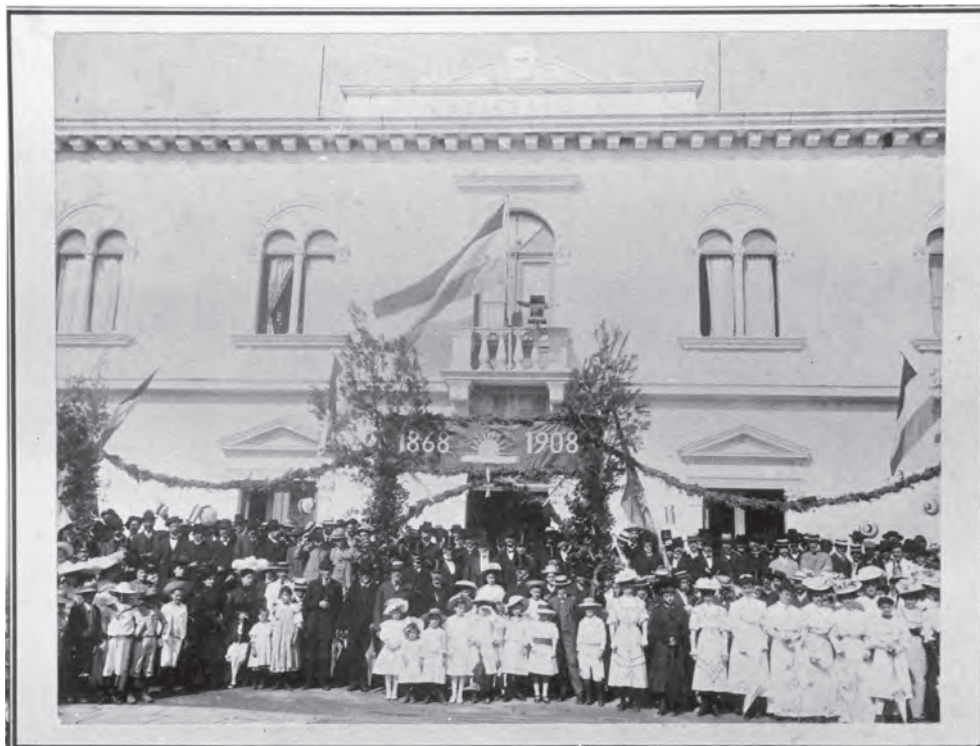
Zajednička fotografija s proslave četrdesete obljetnice osnivanja čitaonice, 1908.