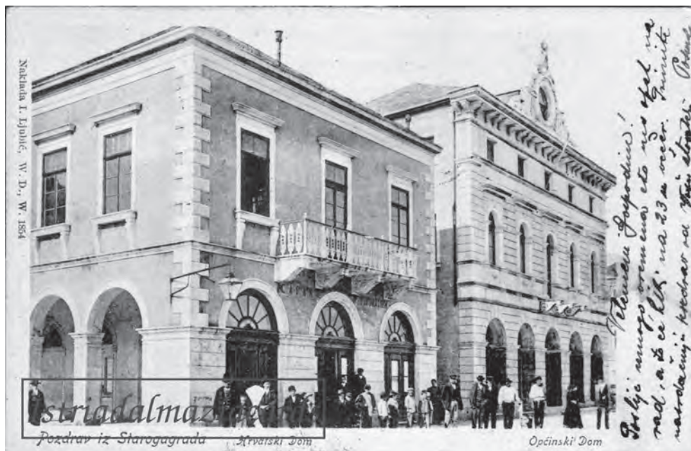
Zgrada Hrvatskog doma (Čitovnice) i općinskog doma u Starom Gradu početkom 20. stoljeća

pogotovo uoči i nakon stogodišnjice 1974. godine koja je, kako Račić navodi, ostala neobilježena, to se počelo ostvarivati tek krajem osamdesetih godina dvadesetog stoljeća, u nagovještaju demokratskih promjena. O tome se doznaje iz dva teksta koja su u veljači i prosincu 1989. godine objavljeni u regionalnim novinama Slobodnoj Dalmaciji. U prvom novinar I. Krasnić izvještava o obilježavanju 120. obljetnice čitaonice, koja je u prvi plan postavila određivanje financijskih sredstava za obnovu zgrade i prikupljanje fonda koji se, po riječima novinara, godinama nalazi u mjesnim konobama. 21 Drugi novinski tekst koji je napisala Sofija Čavić, djelatnica u kulturi iz Staroga Grada, navodi kako na cijelom otoku postoje samo školske knjižnice smještene u neodgovarajućim prostorima i siromašna fonda, ali i nedostatak stručnog kadra. 22 Opisuje sastanak s profesorom Veseljkom Velčićem, tadašnjim predsjednikom Odbora za knjigu, u kojem je određeno da će se u zgradi čitaonice u Starome Gradu osnovati suvremeni bibliotečno-informatički centar koji će ispuniti potrebe svih korisnika na otoku, uključujući turiste. Međutim, do realizacije nije došlo, vjerojatno zbog promjena vlasti i rata koji je uslijedio. Nakon osamostaljenja Hrvatske u knjižnici je godinama radila samo jedna djelatnica, bez adekvatne zamjene.