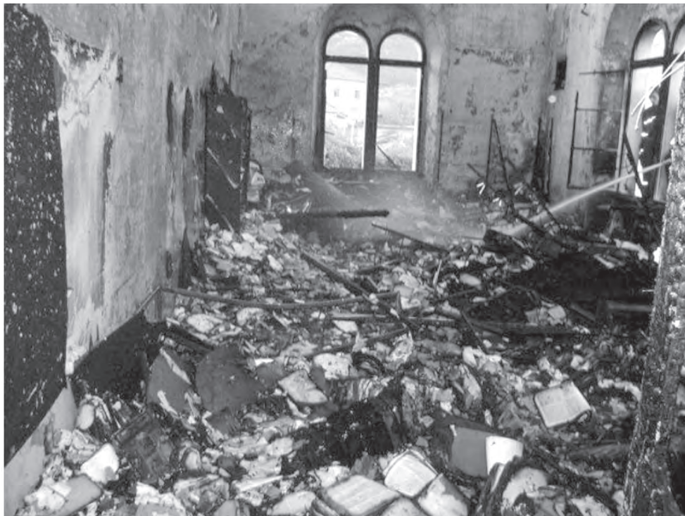
Uništena knjižnica nakon požara 10. studenog 2003. godine.

je sigurno oblikovao i knjigama iz vlastite kućne biblioteke. Tek se po sačuvanom katalogu njegove privatne biblioteke, čiji je jedan primjerak pohranjen u Nacionalnoj i sveučilišnoj knjižnici u Zagrebu, a drugi u Muzeju hvarske baštine u Hvaru, može nazrijeti njezina veličina i značaj. S ukupno 1285 nabrojanih knjiga na pedeset tri stranice, zabilježenih po naslovu, autoru, mjestu i godini tiska, zasigurno ju je moguće uvrstiti među najveće privatne biblioteke na istočnoj obali Jadrana. Najstarije izdanje u katalogu je Diodorova Historiae libri sex et Vitae libri duo , objavljena 1496., što spada u prvotiske – inkunabule. Međutim, Machiedovi unuci su zbog potreba školovanja djece odlučili prodati djedovu biblioteku, te su 1930. godine popisali inventar i tiskali katalog kako bi ga mogli ponuditi na tržištu mogućim zainteresiranim kupcima. Vijest se brzo proširila među tadašnjim uglednicima, a i u inozemstvu, najviše zahvaljujući informacijama koje su prenosili gosti iz područja srednje Europe. Najveći dio biblioteke prodan je knjižnici Karlova sveučilišta u Pragu, a dio je kupio i tadašnji ravnatelj Sveučilišne knjižnice u Zagrebu dr. Mate Tentor, inače ravnatelj te ustanove od 1927. do 1943. godine.