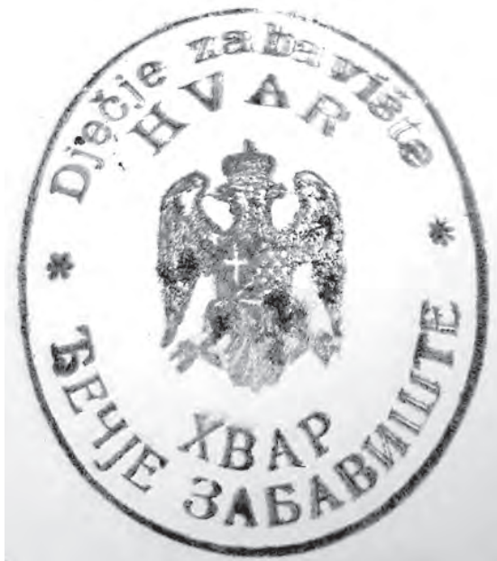
Pečat dječjeg zabavišta u Hvaru iz 1930-ih

U prosincu 1918., nedugo nakon završetka rata, ogromnog vala španjolske gripe i političkih previranja uoči raspada Austro-Ugarske Monarhije i uspostave nove države, kasnije Kraljevine SHS, u splitskim novinama Novo doba objavljen je tekst o potrebi osnivanja ženske zadruge, pozivajući se na produblјivanje aktivnosti nastalih iz potreba i nevolja Velikog rata, poput spašavanja i zbrinjavanja gladne djece i siročadi. 2 Proglas je pozivao žene na aktivni društveni angažman, uključujući obrazovanje, spremnost na javni rad i solidarnost. Ciljevi ženske zadruge su vrlo široki, obuhvaćaju niz elemenata i ono što žene mogu, a među ostalim to je osnivanje ustanova za odgoj i zaštitu djece i mladeži, moralno i materijalno pomaganje majkama, ženama i skrbnicima, pomoći udovicama, otvaranje zabavišta, kuhinja... U proglasu se jasno iskazuje interes za ženska pitanja i poziv ženama da osvijeste mogućnosti i vrline kojima bi mogle doprinijeti društvu ranjenom ratom, gladi i oskudicama.