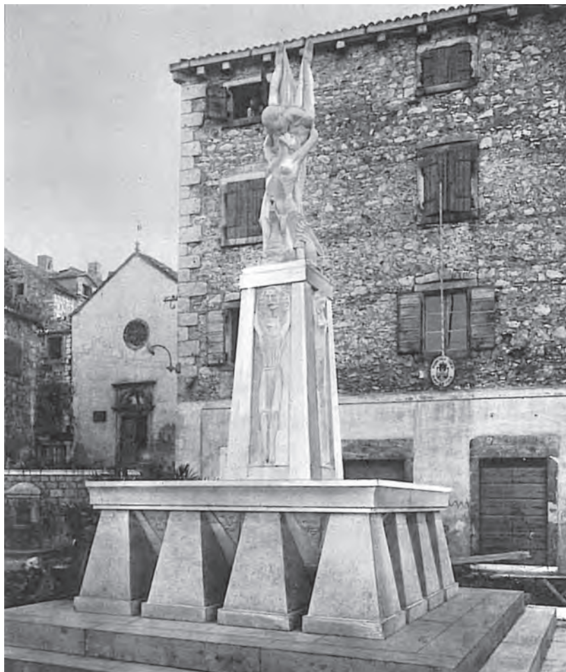
Spomenik oslobođenja, kuća Vučetić i crkva Anuncijate – prije građenja carinarnice