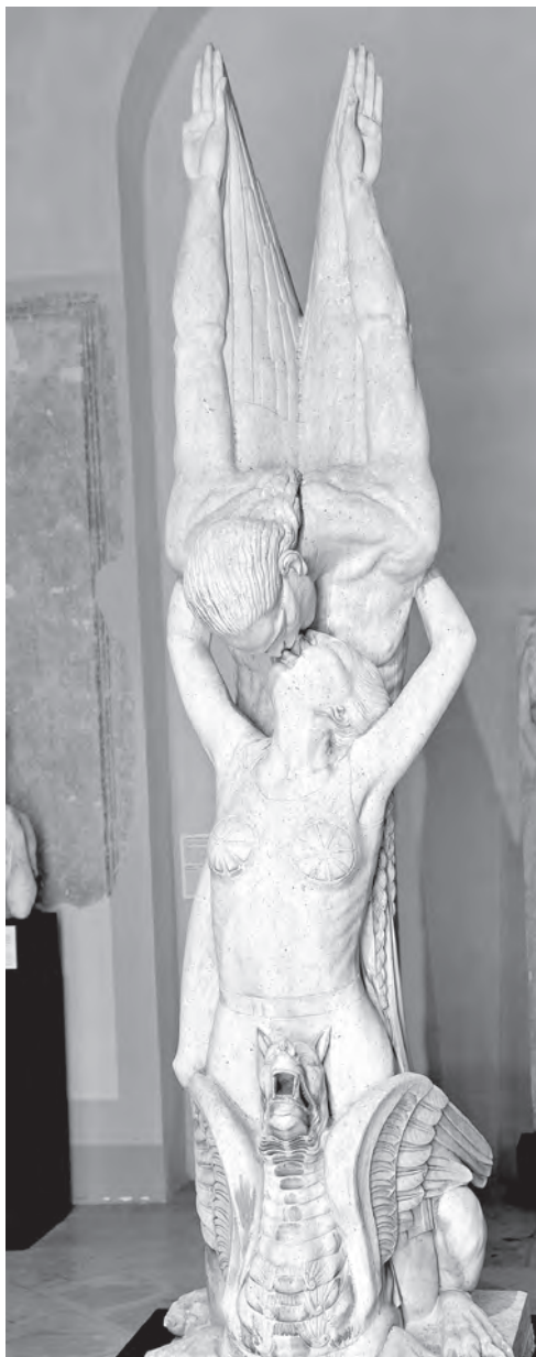
Spomenik na izložbi „Šime Dujmović – (ne)zaboravljeni kipar“, 2024.

postojećih arkada pred carinarnicom...; da u roku od 14 dana ožbuka sjeverni zid kuće zgr. 231...; da se u roku od 10 dana putem stručnjaka utvrdi jesu li radovi izgradnjom carinarnice i arkada izvršeni prema uslovima spomenute pogodbe i u niječnom slučaju da se po istima odredi jedna naknada štete u korist potpisnice ili