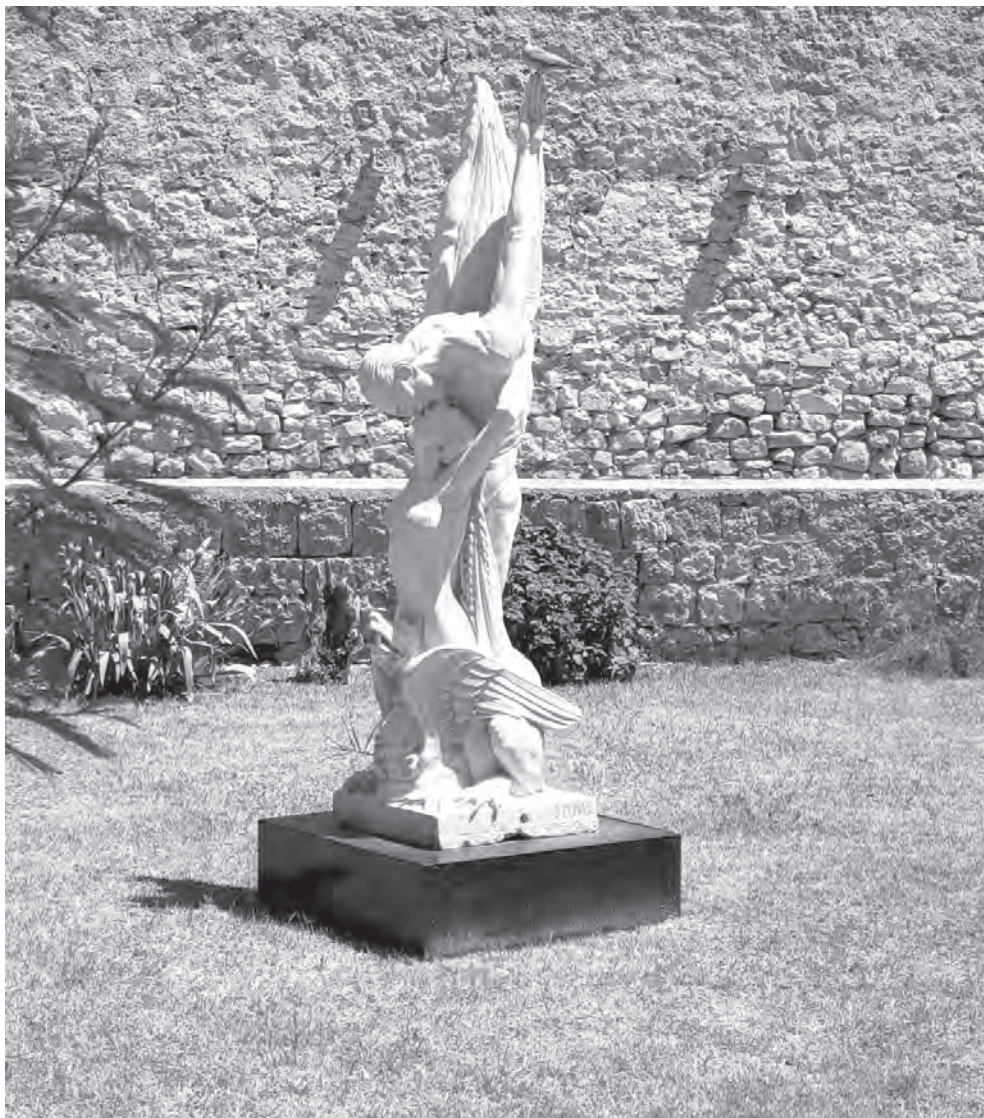
Spomenik u Ljetnikovcu Hanibala Lucića

da se radovi usklade preuzetim obvezama. Ukoliko se ovi zahtjevi ne ispune, traži da joj se isplati 60.000 dinara prema pogodbi. 20