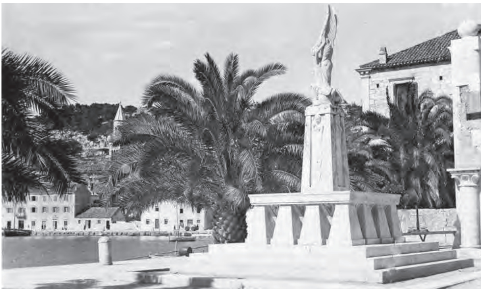
Spomenik s ogradom (oko 1930.) i bez ograde (1936.)

danas pred njom trebale su se, prema zamisli arhitekta Silvija Sponze, protezati od zgrade Arsenala sve do hotela Kovačić, koji se tada nalazio na završetku Rive. I iz ovih planova je uočljivo da je premještaj spomenika bio u planu. Kako dakle gradska vlast nije ispoštovala ugovor o eksproprijaciji, a prvi prijestup toga ugovora