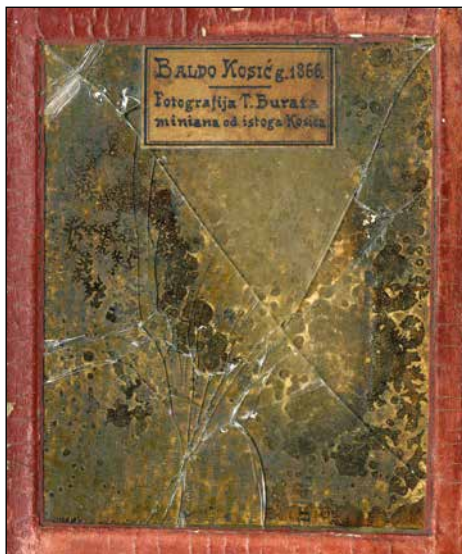
Slika 2. Naličje portreta Balda Kosića, 1866., fotograf Tomaso Burato, privatna zbirka Dubrovnik.

je značajniju natuknicu. U povećem članku navedena su zanimanja "profesor, faunist (ihtolog) i čuvar gradskog prirodnjačkog Muzeja", uz napomenu o amaterskom bavljenju slikarstvom (slike 1 i 2). 11