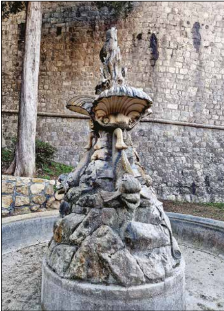
Slika 6. Mihanovićeve fontana u parku Posat, fotografirala Sanja Žaja Vrbica, 2024.