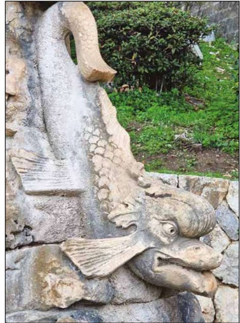
Slika 7. Detalj Mihanovićeve fontane u parku Posat, fotografirala Sanja Žaja Vrbica, 2024.