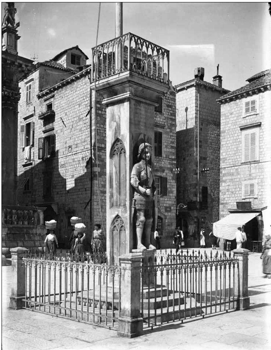
Slika 3. Orlandov stup, HR-DADU-988, stakleni negativ, Zbirka fotografija Mihovila Ercegovića, fotograf Ivan Kulišić, oko 1900. g.