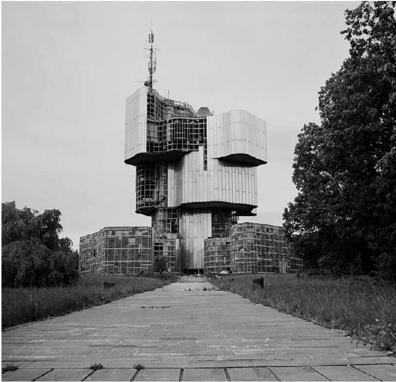
Slika 2. Spomenik na Petrovoj gori, 2012. (Tomislav Medak)

spomenika uništili ili oštetili pripadnici Vojske RSK (Banjeglav, 2012: 100), što pokazuje da je sjećanje na multietničku partizansku suradnju bilo nepoželjno nacionalističkim ekstremistima na obje strane. Neki su spomenici preživjeli rat relativno nedirnuti da bi nakon toga bili ozbiljno degradirani kroz nebrigu i neodržavanje. Spomenik Vojina Bakića na Petrovoj gori primjer je par excellence kako je u novoj hrvatskoj državi sjećanje na antifašizam osuđeno na zaborav, uništeno prvenstveno zanemarivanjem, a tek sekundarno izravnim uništenjem ili uklanjanjem.