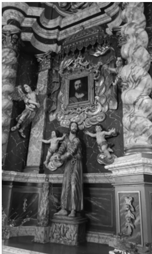
Sl. 3. Neznani kipar, Trpeći Krist.

koji je prisutan i u Ledentuovu i Stierovu planu je tzv. falsabraga, odnosno niski predbedem koji okružuje cijelu tvrđavu, a predstavlja nizozemsko obilježje po kojem se Koprivnica razlikovala od drugih utvrda tog doba. 12 Također, na uglovima tvrđave se javljaju novi fortifikaciji elementi – kavaliri. Uvođenjem kavalira postignuta je snažna trokutna obrana, a dodavanjem ravelina uspješno je riješen problem predugih bedema. 13 Iako je Stier u pisanom obliku svog izvješća donio niz prijedloga za poboljšanje obrambenog sustava, grad nije imao dovoljno sredstava kako bi ostvario njegov prijedlog, ali i unatoč tomu, koprivnička je utvrda bila najmodernija i najjača utvrda na prostoru