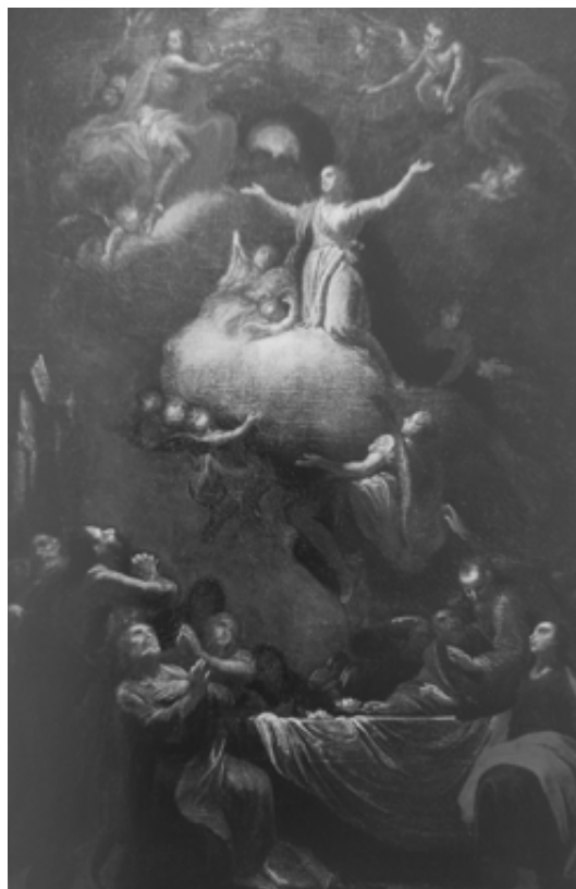
Sl. 7. Johanna Josefa Carla Henricija pripisano, Marijino uznesenje na nebo (izvor: MirjananRepanić-Braun, Barokno slikarstvo u hrvatskoj franjevačkoj provinciji sv. Ćirila i Metoda, Zagreb: Institut za povijest umjetnosti, 2004., str. 152.).

Trojstva. Također, kapela je 1730. godine bila proširena sve do samostanskog zida pred sakristijom, ali nakon potresa vanjski se zid jako nagnuo, stoga je oltar iz kapele premješten u sakristiju. Oltar se spominje u Spomenici 1854. godine, ali nakon tog mu se gubi