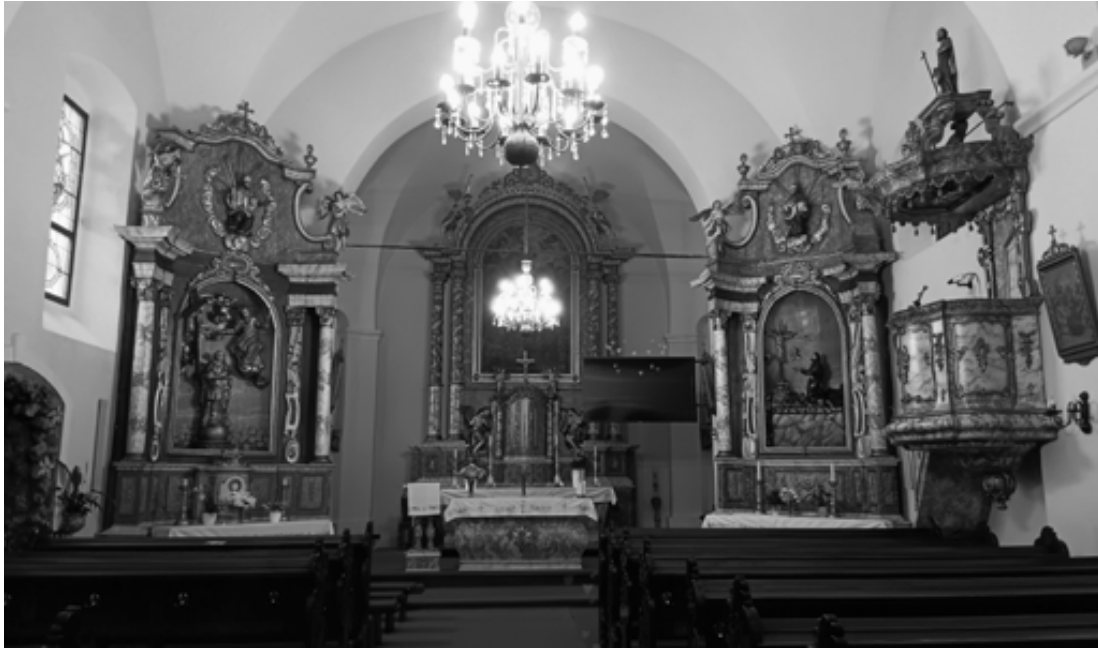
Sl. 2. Pogled na glavni i bočne oltare.

ta i gospodarstva pomogle su odredbe koje su ograničile kapetanovu vlast, budući da je kapetan imao vlast nad građanima i njihovim posjedima. Nadalje, Osmansko Carstvo je u drugoj polovini XVII. stoljeća oslabilo, što je otvorilo priliku da se granica ponovno pomakne prema istoku i time udalji od Koprivnice, otvarajući gradu mogućnost povoljnijeg prometnog položaja koji tako stvara i tranzitnu ulogu grada. Također, iako je još i u XVII. stoljeću najvažnija centralna funkcija upravo vojna, razvojem cehova i održavanjem sajmova mjerilo centraliteta postaju i civilne djelatnosti. 4