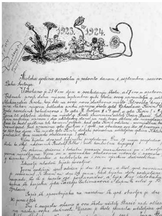
Sl. 1. Preslika iz Školske spomenice 1923. – 1924.