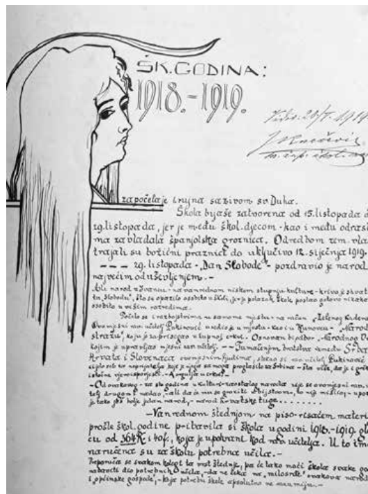
Sl. 2. Preslika iz Školske spomenice 1918. – 1919.