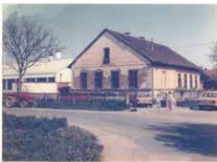
Sl. 7. Školska zgrada iz 1899. godine.