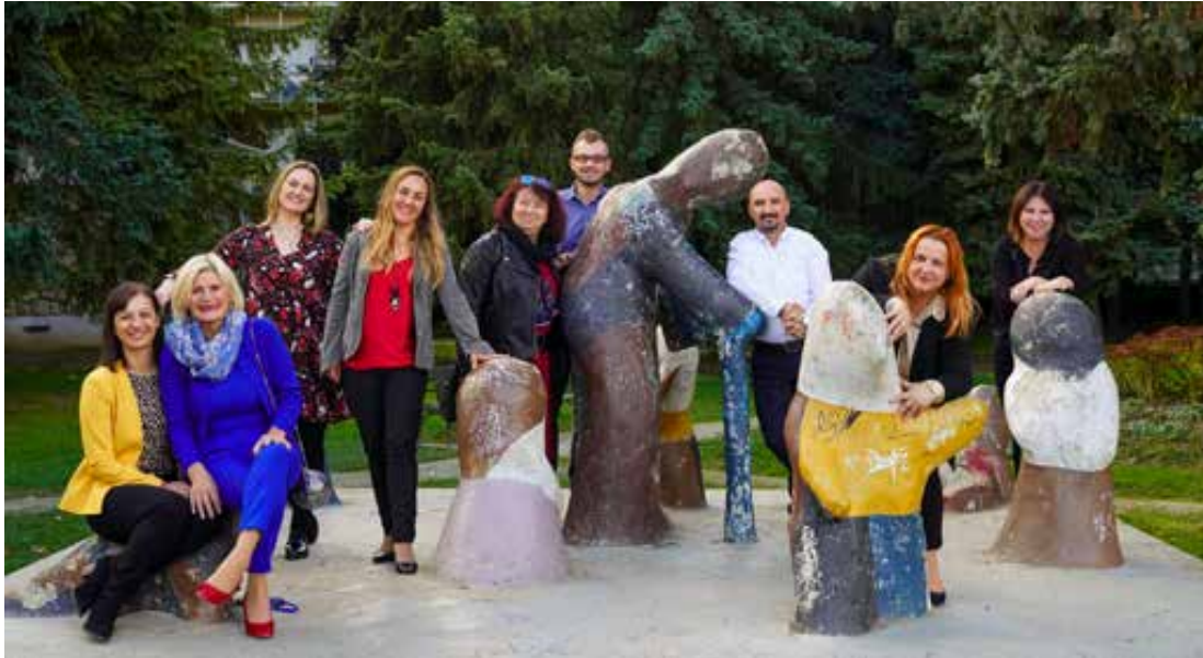
Sl. 7. Nagrađeni koprivnički učitelji pred Grupom 2022. godine.

u studenom 1989. godine. 83 Velika poliesterska igračka tjedan dana uoči otvorenja izložbe bila je dopremljena u Beograd na trg pred Dom sindikata (Slika 5). „Pijetao s gazdaricom“ izazvao je veliko zanimanje javnosti i u Beogradu, a oduševljeni mališani dali su mu nadimak „Pijevac-ban“. 84 Bio je to sjajan način najave nadolazeće izložbe „Petao na trgu“ koja je bila otvorena 9. studenog o čemu se pisalo u listu Podravka, Glasu Podravine i Večernjem listu. 85 Izložba je bila otvorena do 28. studenog 86 , nakon čega je „Pijetao s gazdaricom“ treći put „odletio“ u Zagreb na tradicionalni Novogodišnji sajam koji se održavao u prosincu na Velesajmu, u Podravkinjoj pivnici devetog paviljona. 87 Blagdansko putovanje u Zagreb 1987.