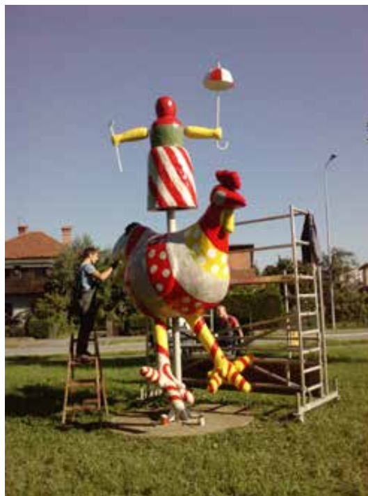
Sl. 6. Obnova Pijetla s gazdaricom 2014. godine (fotografija: Nada Matijaško).

Podravskom zborniku 2013. godine opisao je prijevoz ove velike skulpture iz kipareva atelijera u Novigradu Podravskom do Zagreba što je izazvalo veliku pažnju medija i javnosti. Zbog svojih dimenzija, skulptura je bila transportirana u pratnji policije na velikoj labudici, a ulaskom u Zagreb zapinjala je za tramvajske žice zbog čega je došlo do djelomičnog prekida prometovanja. Unatoč tome, uspješno je postavljena na glavni zagrebački trg uz odobravanje građana. Pozicioniranjem u samom središtu Zagreba postignut je sjajan marketinški efekt. Naime, skulptura je služila kao poziv posjetiteljima da prošeću do nedalekog Gornjeg grada i razgledaju izložbu. 73 Zagrepčani su brzo prihvatili novu instalaciju u poznatom im prostoru o čemu svjedoče brojne anegdote opisane u tisku za vrijeme pijetlova boravka. U zanimljivom članku koji potpisuje stanoviti Jovan Horvat u listu Podravka opisao je dječja posla koja su se svakodnevno odvijala oko skulptu-