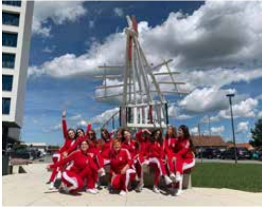
Sl. 3. Koprivničke mažoretkinje pred Pijetlom 2023. godine.

„Grupa“ u školskom centru vapi za obnovom. 35 Bez obzira na kontekst, kada se u lokalnom tisku pisalo o Zvonimiru Lončariću, neizostavno su se spominjale njegove javne skulpture u Koprivnici i značaj za ovaj kraj: umjetnik i djelo u tim su tekstovima neodvojivi.