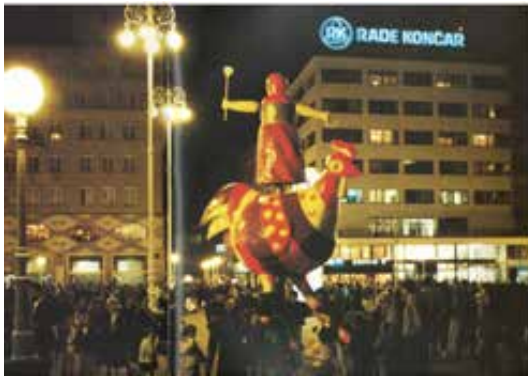
Sl. 5. Pijetao s gazdaricom u Beogradu 1989. godine.

i koprivničke mažoretkinje 2023. godine nakon povratka sa svjetskog prvenstva gdje su osvojile sedmo mjesto (Slika 3). 58 Nakon 1980., skulptura se ponovno pojavila na naslovnici božićnog i novogodišnjeg broja lista Podravke 1998. godine. 59 Napokon, upravo s Pijetlom u čestitki, Podravka je u studenome 2007., 2008. i 2009. godine u Glasu Podravine, Podravskom listu i Koprivničkom godišnjaku čestitala građanima Dan grada Koprivnice. 60 Posebno simpatičan bio je kolaž jednog učenika iz Područne škole Vinica s pijetlom koji je izašao u rubrici „Dječja stranica“ Podravskog lista 2005. godine. 61