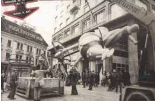
Sl. 4. Pijetao s gazdaricom, ukrcavanje na kamion nakon izložbe Pijetao na Griču, Večernji list, 7. 1. 1988.

skulptura je već bila omiljeno mjesto fotografiranja posjetitelja pred Podravkom pa su planinari iz Beograda i Zagreba, nakon razgledavanja tvornice, svoje uspomene zabilježili upravo ondje. 49