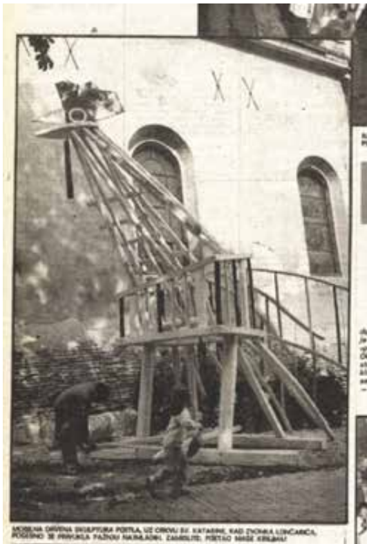
Sl. 2. Pijetao u Zagrebu pored Crkve sv. Katarine, Večernji list 10. 10. 1987.