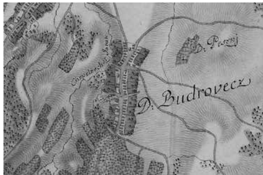
Sl. 1. Budrovec na vojnoj karti 18. st.

Spomenica škole je dokument u koji se zapisuju svi važni događaji u školi i sredini u kojoj ona djeluje tijekom svake školske godine. Prve spomenice počele su se pisati od sredine 1870-ih, kada je donesena odredba o pisanju školskih spomenica, a školske su ih vlasti 1880. godine podigle do stupnja naredbe u kojoj je detaljno opisano kako se moraju pisati. 3 Sačuvane spomenice vrlo su vrijedan izvor za istraživanje povijesti školstva u određenom mjestu i gradu jer donose zanimljive podatke o povijesti pojedinih škola, ali i samih naselja. U njima nalazimo i podatke o događajima vezanima za lokalnu i regionalnu povijest, kao i etnografske zapise. Vodili su ih ravnajući učitelji. Većeg su formata, uglavnom vrlo lijepo uvezene, a korice su ukrašene zlatopisom. Još ljepšim činio ih je krasopis pojedinih učitelja koji su posebnim zalaganjem upisivali podatke i svoje dojmove. Dakako da se pojedini toga nisu pridržavali pa su zapisi o određenim školskim godinama manjkavi i šturi podacima. Ponekad su čak i izostali, što je vidljivo u budrovečkoj Spomenici. Prema spomenutoj naredbi iz 1880. godine Spomenica se sastojala od dvije glavne cjeline: Povijest škole