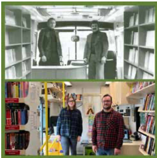
Sl. 7. Posada bibliobusa 1979. i 2025. godine.

su, a istovremeno stvaraju naviku provođenja slobodnog vremena u čitanju. Jedan je od najdugovječnijih programa koji se provodi više od 15 godina program Bibliobus vam dovodi u goste . Tim programom djelatnici bibliobusa za svoje korisnike, najčešće djecu predškolske i osnovnoškolske dobi, o trošku Bibliobusne službe, odnosno matične knjižnice, organiziraju književne susrete, igrokaze, predstave i predavanja, te tako omogućuju da kvalitetni kulturni, edukativni, umjetnički i znanstveni sadržaji stignu i do malih ruralnih sredina udaljenih od grada u kojima su iz tog razloga mnogo nedostupniji. Od novijih programa, važno je istaknuti program Smisli priču u sklopu kojega grupe korisnika različitih uzrasta na temelju postojeće priče ili zadanih elemenata napišu novu, vlastitu priču uz pomoć različitih, za to posebno pripremljenih didaktičkih materijala poput asocijativnih karata i kockica. Bibliobus u sredinama koje obilazi ima i važnu edukacijsku ulogu pa se zato redovno održavaju edukacijski posjeti djece vrtičke i školske dobi s ciljem njihovog upoznavanja sa svrhom, građom i uslugama bibliobusa i knjižnica općenito. Takve edukacijske aktivnosti održavaju se i u sklopu programa namijenjenih javnosti, na primjer u sklopu proslava Dana županije