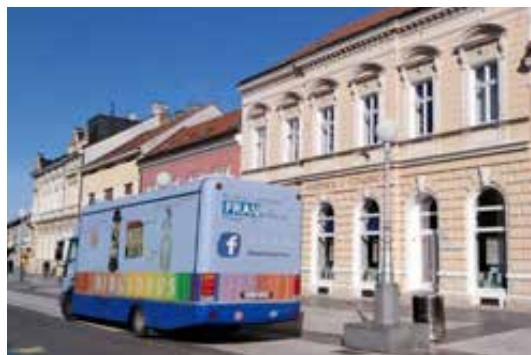
Sl. 2. Drugi bibliobus.

maju narodnu knjižnicu dužni posebnim ugovorom obavljati djelatnosti narodne knjižnice povjeriti narodnoj knjižnici u drugoj općini i gradu ili osigurati osnivanje podružnice te narodne knjižnice na svojem području. S obzirom na to da je za osnivanje knjižnice nužno osigurati knjižničnu građu, prostor, opremu, pristup informacijsko-komunikacijskoj tehnologiji, sredstva za rad, rad stručnih knjižničarskih djelatnika, te program rada i razvitka, što je za većinu općina i inicijalno i dugoročno neostvariv projekt koji iziskuje velike financijske izdatke, ulogu osiguranja knjižnične usluge za udaljena područja općina, gradova i županije najčešće preuzimaju pokretne knjižnice. Razlog tome je što pokretne knjižnice u istom vozilu s istim knjižničnim fondom, koristeći istu opremu i informacijsko-komunikacijsku tehnologiju i na temelju rada istih knjižničarskih djelatnika mogu pružati svoje usluge u većem broju međusobno udaljenih općina, mjesta i naselja. Troškove rada pokretne knjižnice pritom mogu dijeliti županija, općine i gradovi, što ih čini optimalnim, fleksibilnim, održivim i financijski najisplativijim oblikom pružanja usluga narodne knjižnice za stanovnike malih i udaljenih naselja.