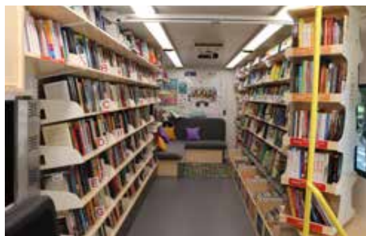
Sl. 5. Novi bibliobus – zona za korisnike.

U odnosu na prethodno vozilo poboljšani su i funkcionalni radni uvjeti za knjižničare. Posudbeni pult i radni stol za knjižničara smješteni su odvojeno od korisničkog prostora, a opremljeni su malom kuhinjom s mikrovalnom pećnicom, hladnjakom, kuhalom za vodu i umivaonikom s tekućom vodom, te ormari- ma za osobne predmete, uredski materijal i alate. U novom prostoru predviđeno je i mjesto za računalo namijenjeno korisnicima za korištenje, višenamjenski uređaj za ispis, kopiranje i skeniranje, projektor s platnom i bijela magnetna ploča za obavijesti i izložbe. Kako bi se izbjegli strukturalni problemi s prokiš- njavanjem na spoju kabine i knjižničnog pro- stora kao u prethodnom vozilu, odlučeno je da će kabina i knjižnični prostor u novom vozilu biti odvojeni. Za vanjske aktivnosti, bibliobus je opremljen tendom duljine četiri metra, koja omogućava korisnicima boravak na otvore- nom i širenje prostora bibliobusa. Novo vozi- lo, treće po redu za koprivničku bibliobusnu službu dostavljeno je u Koprivnicu polovinom