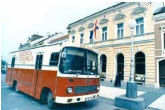
Sl. 1. Prvi bibliobus.