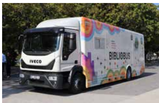
Sl. 4. Novi bibliobus – vanjski izgled.

ranec. 29 Novo kamionsko podvozje s kabinom vrijedno 97.717,17 € stiglo je u Koprivnicu u prosincu 2022. godine. 30 U financiranju izrade nadogradnje koja je krenula u lipnju 2023. godine udjelom od gotovo 50 % sudjelovalo je Ministarstvo kulture i medija RH, a uključili su se i Grad Koprivnica i Koprivničko-križevačka županija. Izrada nadogradnje je nakon obavljenog postupka javne nabave povjerena tvrtki Fera Avto d.o.o. iz Maribora. 31