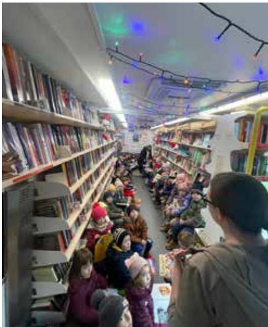
Sl. 8. Pričaonica u novom bibliobusu.

knjižnicu, u sklopu kojega se u školama otvaraju mali knjižnični kutci sa zabavnom građom iz fonda bibliobusa koja je u školskim knjižnicama rjeđe zastupljena radi manjka financijskih sredstava. 39 Osim navedenih, u bibliobusu se u skladu s potrebama na terenu nerijetko, prema potrebi, provode i programi poticanja razvoja medijske pismenosti, satovi lektire, te programi u sklopu nacionalnih i međunarodnih manifestacija s ciljem poticanja čitanja. Na razini kalendarske godine nagrađuju se najbolji čitatelji u kategorijama: djeca vrtićke dobi, djeca osnovnoškolske dobi, odrasli korisnici, vrtić i škola. Socijalni aspekt rada, a i važnosti bibliobusa najvidljiviji je kroz program Knjiga na kućnom pragu , u sklopu kojega korisnicima koji imaju poteškoća s kretanjem ili iz nekog drugog razloga ne mogu napustiti svoj dom bibliobus dostavlja knjige i drugu građu u njihove domove, te tako pruža prilagođeni pristup kvalitetnim kulturnim sadržajima onima koji