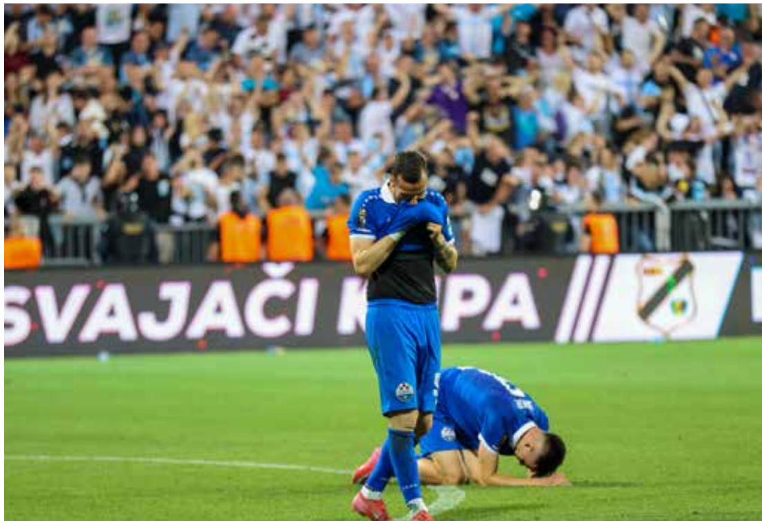
Prizor s važne finalne utakmice Slavenaša.