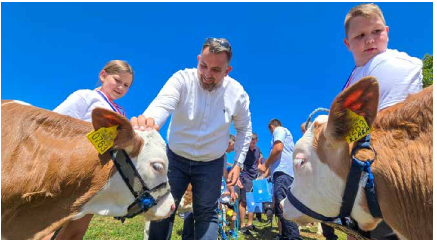
Prvi put u novoj ulozi na Bambino kupu u Goli (snimio Ivan Brkić).