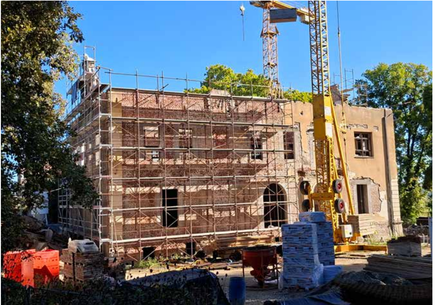
Obnova rasijskog dvorca Inkey u punom je zamahu (snimio Milivoj Dretar).