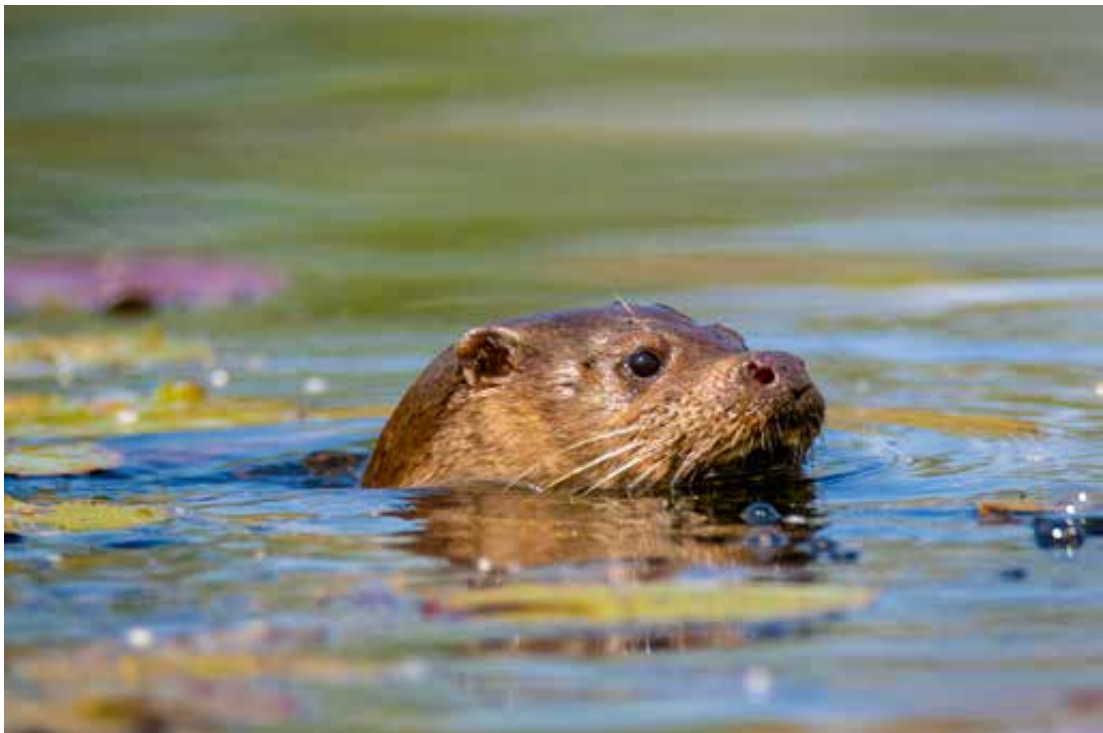
Vidra na kupanju u Dravi kod Botova.