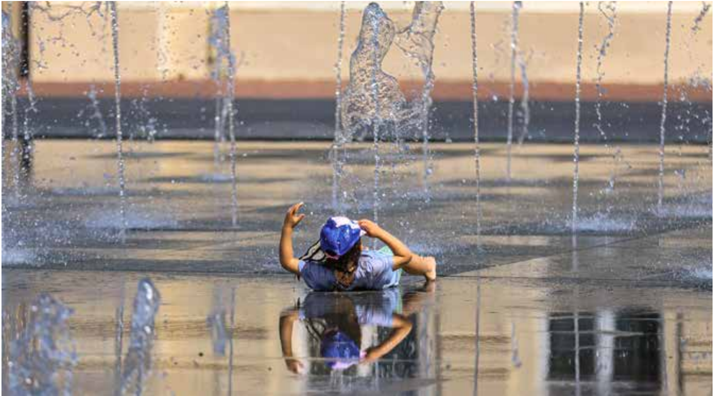
Ljetne vrućine lakše je otrpjeti uz gradsku fontanu.