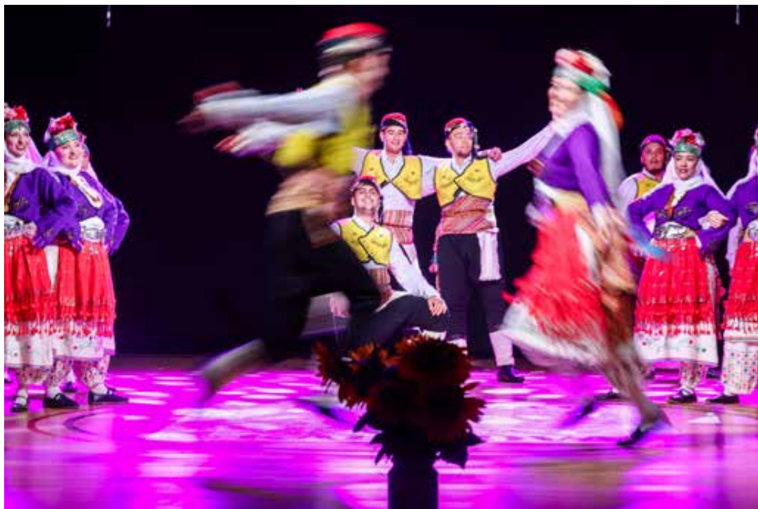
Živopisne nošnje iz raznih krajeva svijeta na Međunarodnom festivalu folkloru Iz bakine škrinje u Koprivnici.