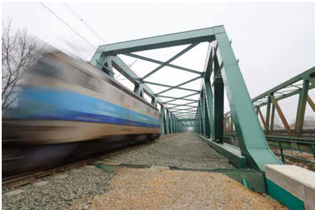
Novi željeznički most u Botovu pušten je u promet krajem 2024. godine.