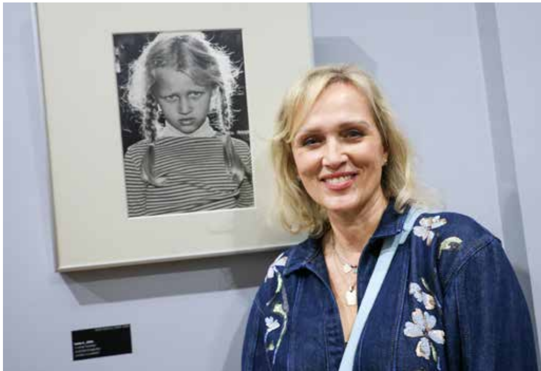
Vanna nekad i danas.