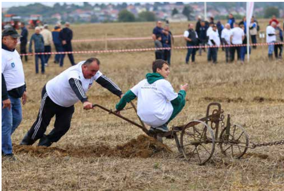
Natjecanje orača i ove je godine održano u Podravini.