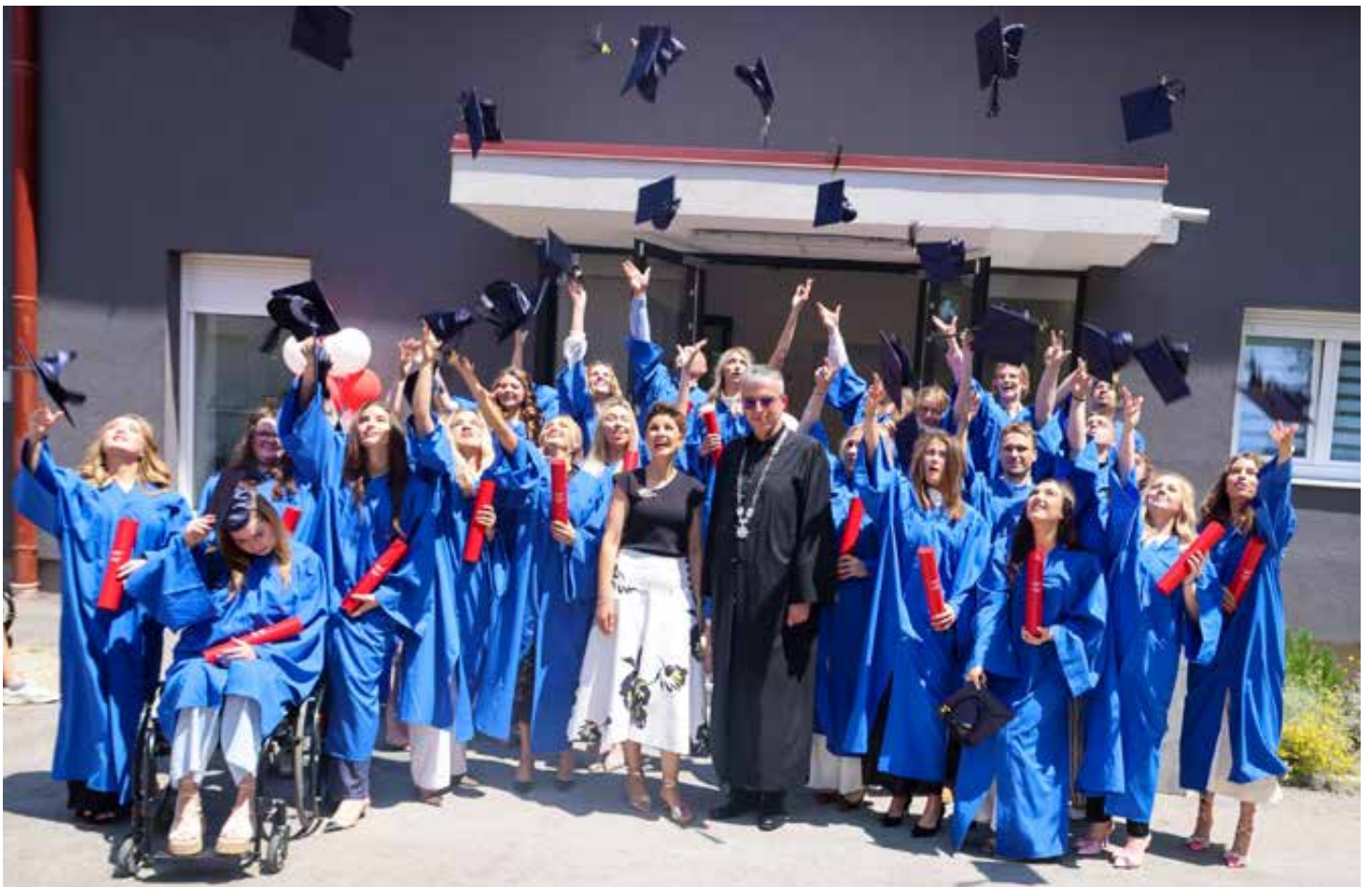
Prva generacija doktora znanosti promovirana je na Sveučilištu Sjever u Koprivnici.