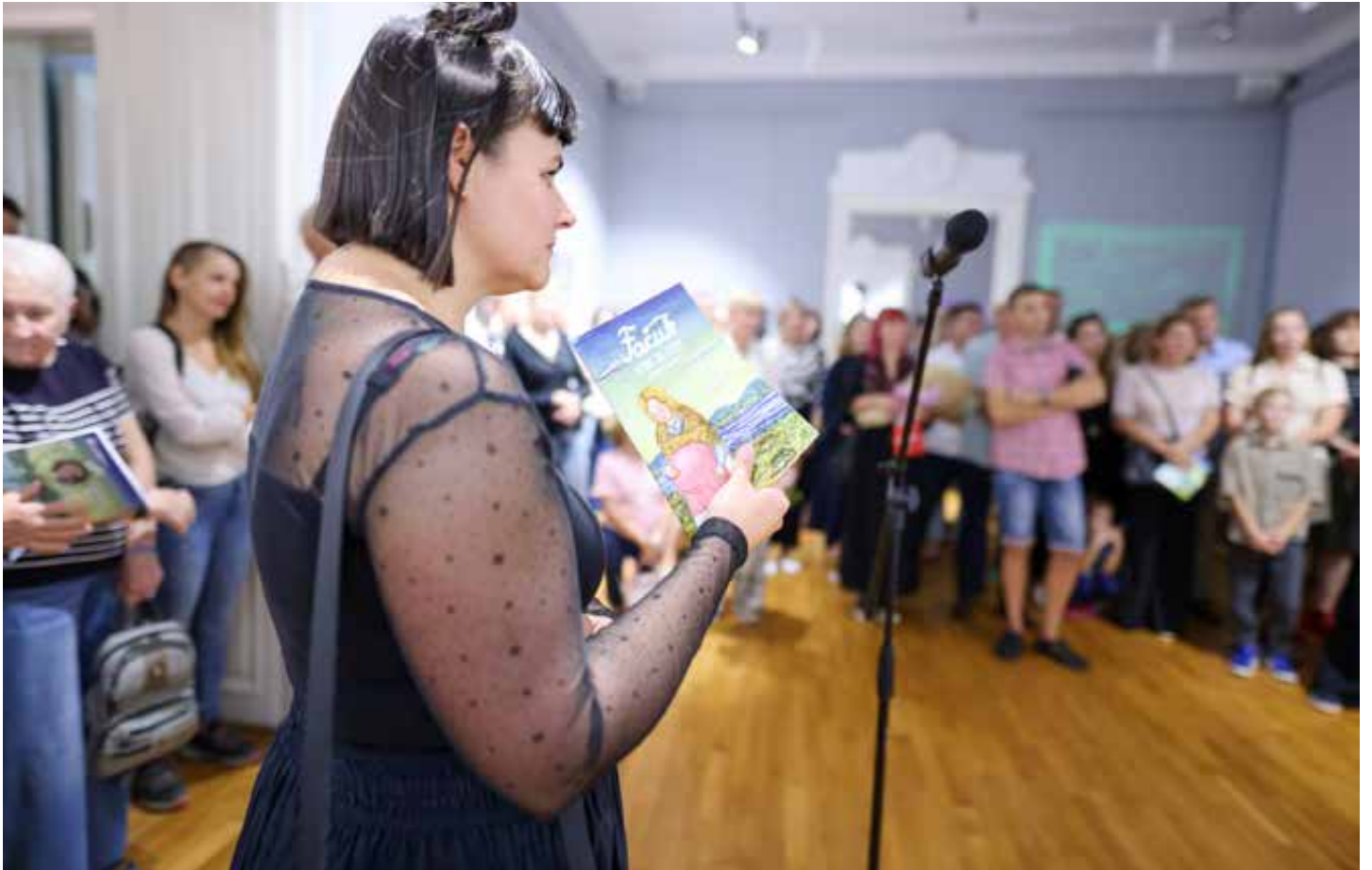
Izložba o animiranom filmu inspiriranom djelima Mije Kovačić otvorena je u Galeriji Koprivnica.