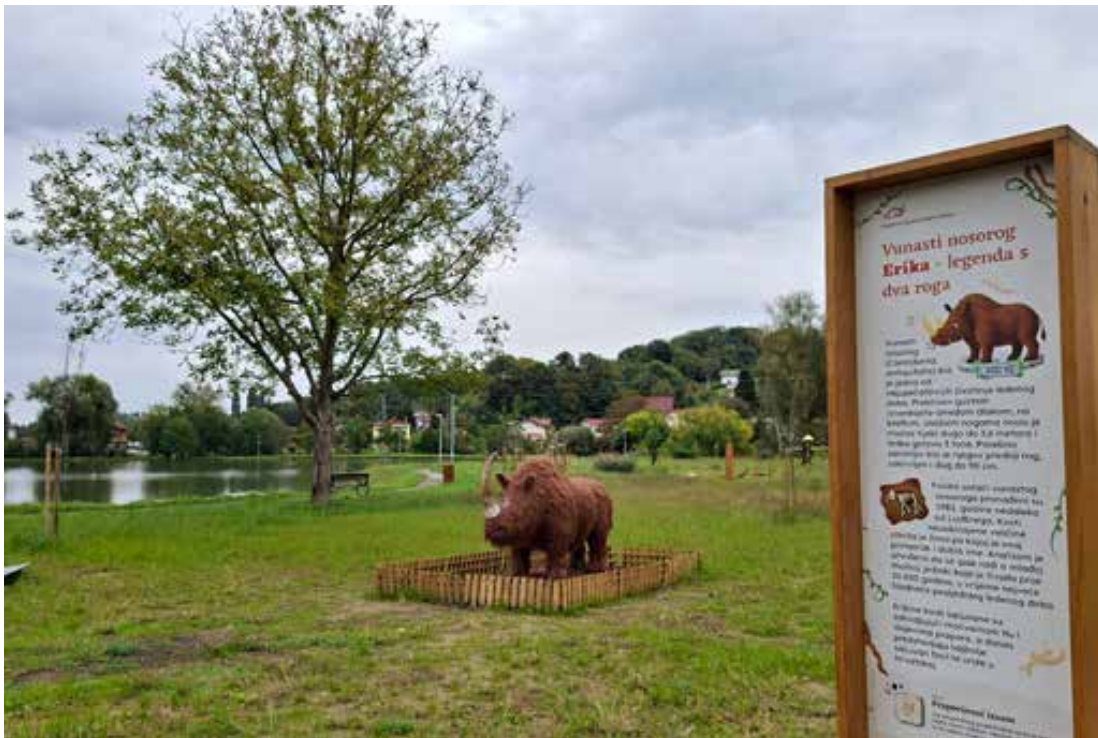
Ludbreg je ljetos postao bogatijim za atraktivni Prapovijesni park uz rijeku Bednju.