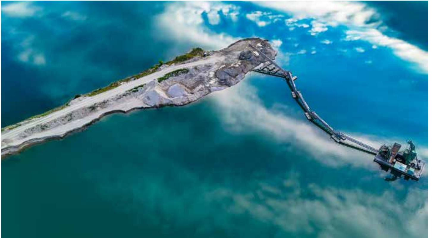
Ovako danas izgleda nekadašnje popularno kupalište Jegeniš.