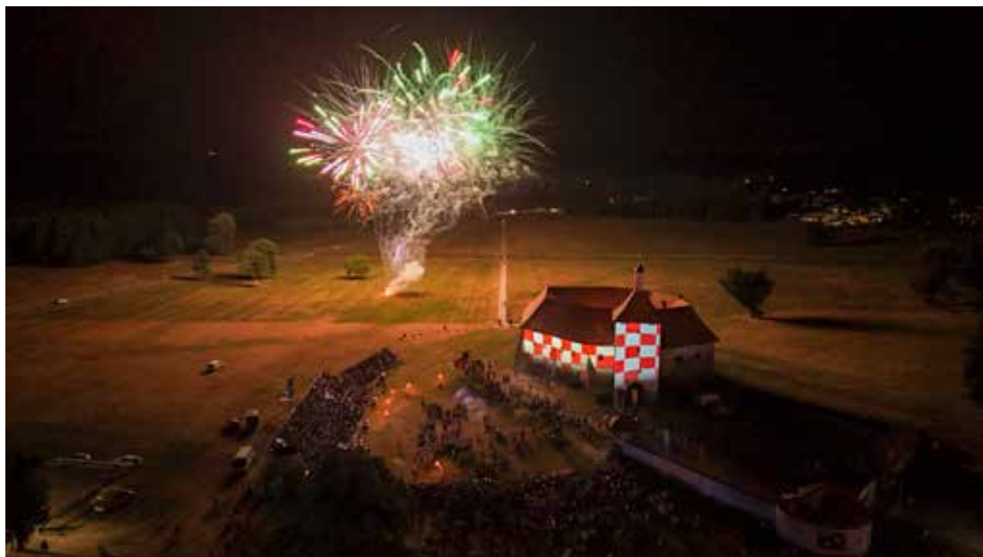
Opsada Starog grada u Đurđevcu i ove je godine bila najvažniji dio Picokijade.