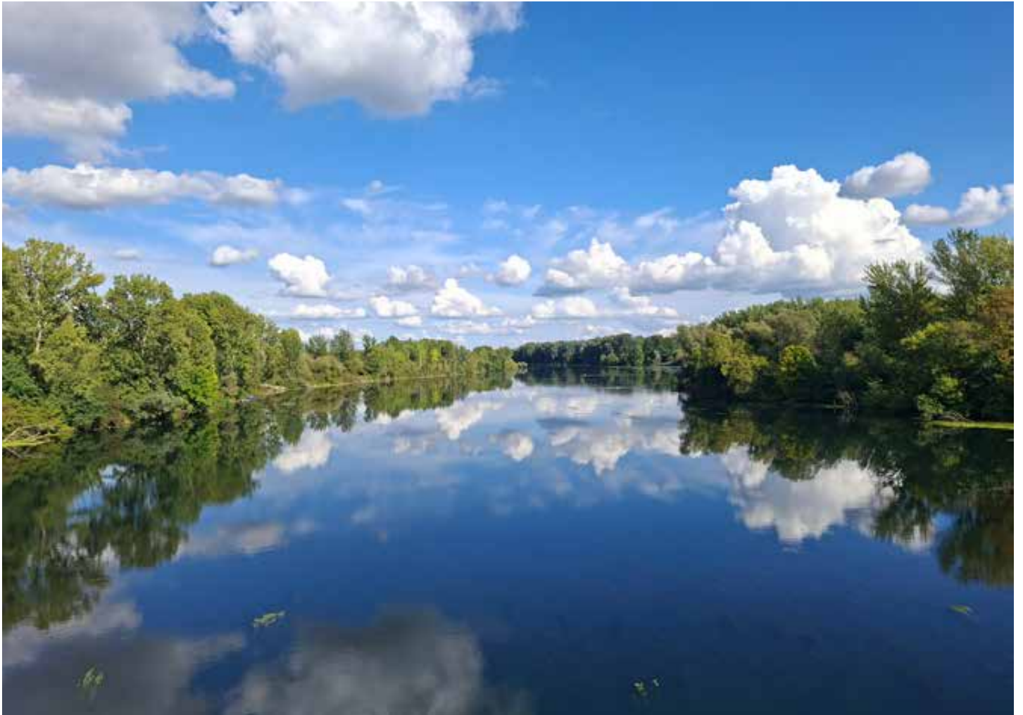
Rijeka Drava u popodnevnom smiraju.