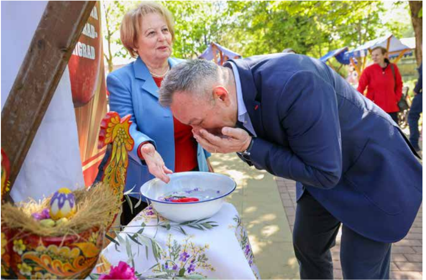
Obredno umivanje na Cvjetnicu osigurava dobro zdravlje i ljepotu.