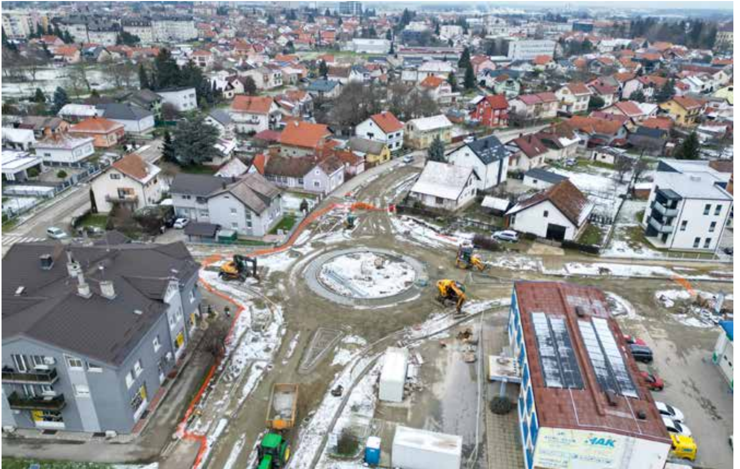
Koprivnica je i ove godine bila veliko gradilište. Veselimo se promjenama!.