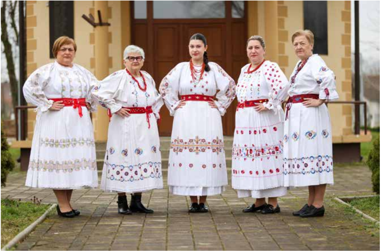
Žene iz Hrvatskog srca Drnje ponosno nose svoju nošnju.