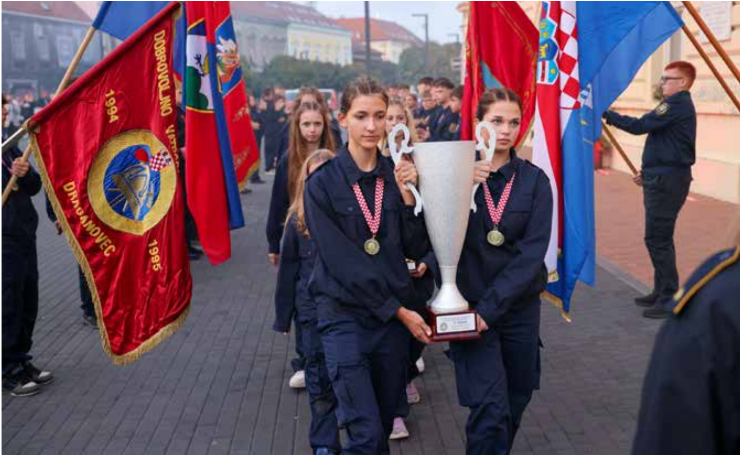
Vatrogasne prvakinje Hrvatske svečano su dočekane u centru Koprivnice.