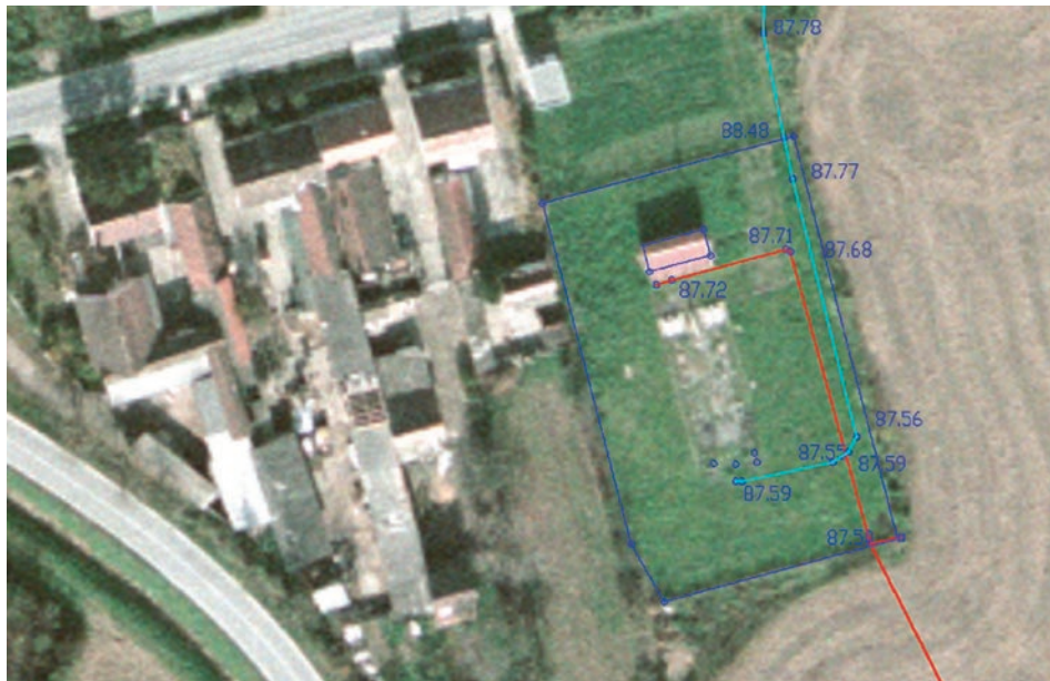
Slika 3. Digitalni ortofoto plan 1:5000 s ucrtanim vodovima i pripadajućim visinama.

Osim tih dviju vrsta podloga, od Geodetskog zavoda d. d. Osijek naručen je digitalni ortofoto (DOF) cijeloga područja Grada Osijeka, koji se uključuje po potrebi kada se radi na području novijih objekata, koji nisu evidentirani u katastarskom operatu (slika 3). DOF je također podijeljen u sekcije koje se po potrebi uključuju.