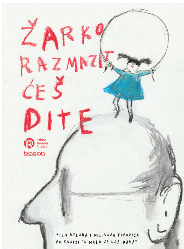
SLIKA 1. Poster animiranog filma Veljka i Milivoja Popovića Žarko, razmazit ćeš ditek! , 2024.

Unatoč nastavku studija u Zagrebu Veljko Popović ostao je u kontaktu s kolegama s Umjetničke akademije u Splitu prateći njihov daljnji rad, pa tako i stvaralaštvo Kljaković Braić. U njezinu pristupu slikarstvu izražen je storytelling , odnosno narativnost i oslanjanje na anegdote iz života koje su se V. Popoviću činile kao dobar materijal za animirani film. Prvobitno mu se javila ideja da animira likove iz zbirke karikatura Oni (2018.), ali je zaključio da ti likovi bolje funkcioniraju u obliku krokija koji ostaje u granicama jednolinijskih situacijskih šala iz svakodnevnog života jednog bračnog para.