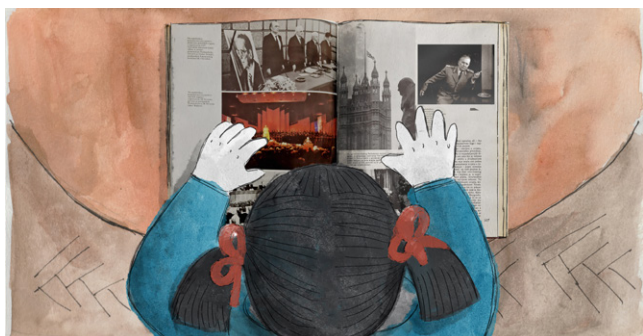
SLIKA 6. Kadar iz animiranog filma Žarko, razmazit ćeš dite!