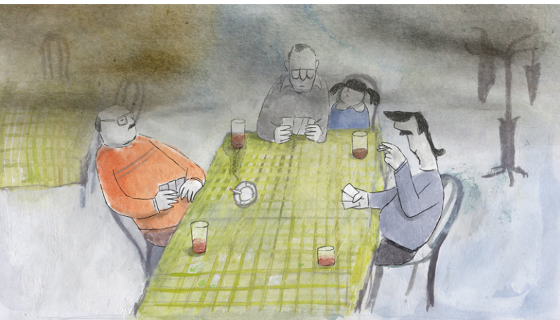
SLIKA 5. Kadar iz animiranog filma Žarko, razmazit ćeš dite!

humora i poetike svakodnevice s blagom ironijom kojom „savršeno pogađa u samu bit humora i poetike svakodnevice i plemenite fjake mediteranskog podneblja“. 29