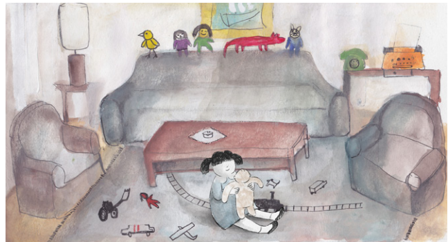
SLIKA 8. Kadar iz animiranog filma Žarko, razmazit ćeš dite!

potičući ih da u francuskom prijevodu upotrebljavaju fraze, dijalekt ili sleng koji su u duhu izvornoga izraza, ali ujedno razumljivi i bliski frankofonskoj publici. Francuski naslov bitno se razlikuje od hrvatskog, odnosno engleskog naslova filma i glasi Pas de poupée pour Tisja (u slobodnom prijevodu Nema lutke za Tisju ), koji stavlja naglasak na to kako djed Žarko nije mogao zamisliti da njegova unuka ima djetinjstvo bez igračke kao metaforu za uskraćenost bezbrižne igre, a ne razmaženost. Usto, simbol lutke ili „bebe ćelavice“ razumljiv je gotovo svim generacijama publike na globalnoj razini.