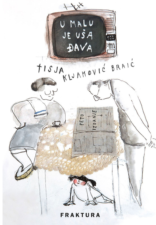
SLIKA 2. Naslovnica knjige Tisje Kljaković Braić U malu je uša đava , Fraktura, 2022., peto prošireno izdanje

Tek u knjizi U malu je uša đava pronašao je ono što mu je nedostajalo: tekst, radnju, razradu likova i njihovih odnosa, dubinu i slojevitost priče. Pored toga što mu se sviđala likovnost Kljaković Braić, sada je postojao i literarni predložak prema kojem se mogao napraviti animirani film koji bi spojio slikarstvo i animaciju, pa je i autorica knjige entuzijastično prihvatila prijedlog za suradnju. 9