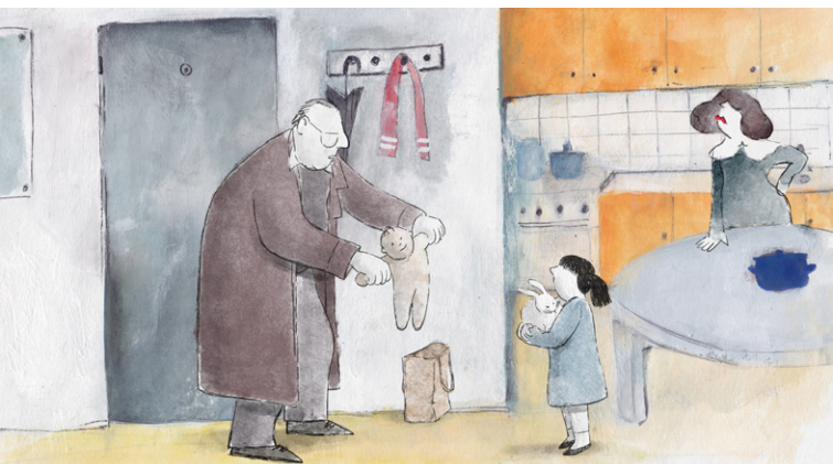
SLIKA 4. Kadar iz animiranog filma Žarko, razmazit ćeš dite!

njih nekoliko, s tim da je velik naglasak stavljen na drugo poglavlje, Soc'jalizacija s didon Žarkom (napisano dijalektom), koje je razdijeljeno na tri zasebna događaja ili priče (pod 2., 3. i 4.): kupnja lutke koju je djed Žarko poklonio unuci unatoč protivljenju Tisjine majke, odlasci Tisje i djeda u bar Hajduk i naposljetku njezino ispisanje iz vrtića zahvaljujući djedovoj upornosti. U tih trinaestak minuta 22 prikazana je dirljiva priča o djedu i unuci na temelju nekoliko događaja. Također, proslava Božića i Nove godine, koji su u knjizi objedinjeni u jednu priču, na filmu su prikazani crticama Komunističko-katolički bor i Nova godina , čime zapravo završava prikaz Tisjina bezbrižnog djetinjstva.