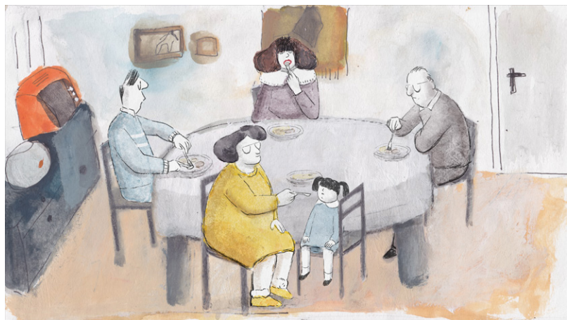
SLIKA 3. Kadar iz animiranog filma Žarko, razmazit ćeš dite!

Zbog slikarske vokacije autorice knjige Popovići nisu pristupili cijelom procesu onako kako bi inače pristupili izradi 2D animiranog filma kao kad rade s animatorima prema ustaljenim principima, poput izrade popisa modela likova ( en face , profil, T poza), razrade scenografije i drugog, koji osiguravaju da iz kadra u kadar te iz scene u scene različiti animatori imaju isti pristup crtežu, liku, pozadinama itd. Smatrali su da bi ih to udaljilo od eksperimenta u koji su se htjeli upustiti, a to je da sa slikaricom pokušaju raditi na filmu. Ona je prema zadanom scenariju tijekom duljega perioda izrade filma ilustrirala zadane kadrove s likovima u karakterističnim pozama, koji su potom animirani pa su iz kadra u kadar vidljive razlike u pristupu crtežu, pozadini i objektima, što je rezultiralo unikatnim izgledom filma. 15