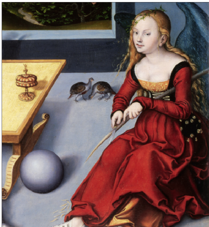
Sl. 12. Detalj slike Melankolija Lucasa Cranacha starijeg, 1532. 42

može se pokušati dati općeniti primjer. Jedan od njih bi bio prikaz djevojke u renesansnoj haljini na slici Melankolija iz 1532. godine Lucasa Cranacha koja se nalazi u muzeju Unterlinden (Sl. 12).