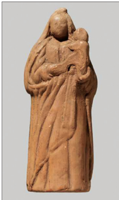
Sl. 7. Djevica Marija s Djetetom, 16. stoljeće (H. S. METTE, 2012, 117)

Nalaz kipića od gline/terakote, teritorijalno najbliži našem (osim muške male skulpture s Principija), pronađen je u Sloveniji, u mjestu Ormož. Radi se o antropomorfnoj skulpturi izrađenoj od crvenkaste gline s primjesama pijeska. Glava je pravokutnog oblika, s jasno naznačenim očima, ustima, nosom i bradom. Donji dio figure je šupalj, a visoka je 6,7 centimetara. U glini su izvedeni detalji bluže, koja ima nabore. 9 Predmet nije pobliže datiran, a ne iznose se ni pretpostavke o njegovoj namjeni. Navodi se da su u Ormožu, u blizini izvora, postojale keramičarske radionice, te da su keramiku izrađivali lokalni majstori. 10