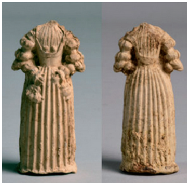
Sl. 10. Prednja i stražnja strana kipića koji prikazuje ženu (sv. Doroteja?), Dresden, 15. stoljeće (J. BEUTMANN, 2020, 59)

grada Praga. Radionica je već u 14. stoljeću proizvodila keramičke skulpture koje su bile predmet pobožnosti. Većina ih se datira u 15. i 16. stoljeće i rađene su u jednostrukom ili dvostrukom kalupu. Funkcija im je široko određena. Mogle su služiti kao dio kućnog oltara, dio prikaza scene Rođenja, poklon pri rođenju djeteta, amajlija, suvenir s hodočasničkom putovanja ili igračka. 20