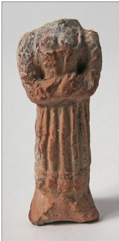
Sl. 1. Mala terakotna skulptura, prednja strana

Na pojedinim dijelovima skulpture vidljivi su tragovi smeđe glazure. Haljina ima dugačke rukave, no zbog oštećenosti i izlizanosti gline nije moguće utvrditi jesu li priljubljeni uz tijelo ili široko oblikovani. Donji dio haljine prikazuje uzdužne nabore, a završava izrazitijim vodoravnim zadebljanjem. Sam kipić ima svojevrsno postolje koje nalikuje tronošcu. Stražnji dio terakotne plastike nije obrađen; ravan je, odrezan te na njemu postoji urezano obrnuto slovo T (Sl. 3).