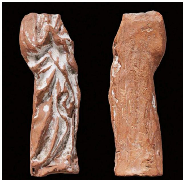
Sl. 8. Prednja i stražnja strana male terakotne skulpture Marije iz 14. stoljeća (H. S. METTE, 2012, 120)

i datira se u 14. stoljeće (Sl. 8). Mala skulptura koja prikazuje Mariju i Dijete iz 16. stoljeća nalazi se u Kraljevskom kabinetu kurioziteta u Kopenhagenu. 11 Rapskom primjeru naizgled je srodna figura iz Kraljevskog kabineta kurioziteta po boji gline od koje je izrađena. Ipak, za potvrdu te tvrdnje bilo bi poželjno pregledati nalaz i provesti analizu gline.