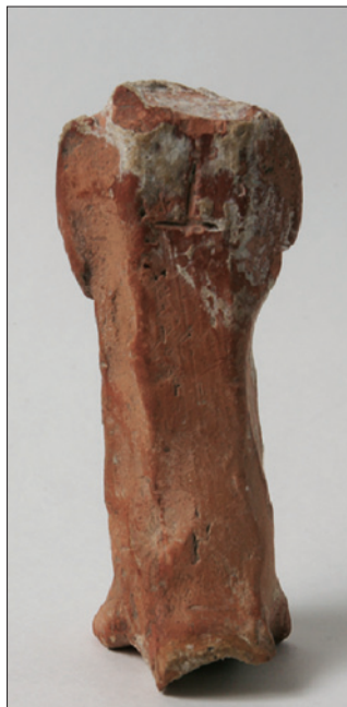
Sl. 3. Mala terakotna skulptura, stražnja strana