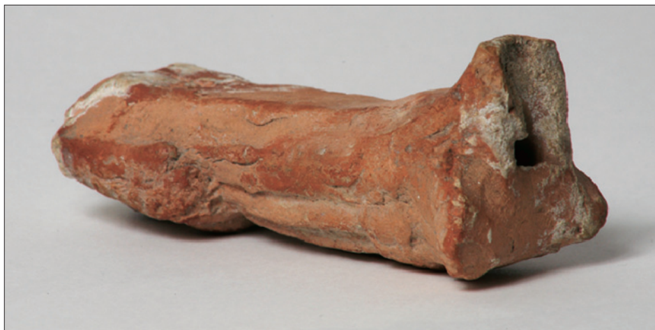
Sl. 4. Mala terakotna skulptura, donji dio