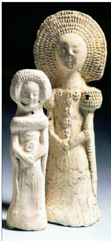
Sl. 5. Kruseler Püppchen 5

Godine 1978. pronađen je gornji dio – glava tipa Kruseler Püppchen u Gelbsreuthu. Ulomak je visok 5,5 cm i na prednjoj strani ima tamnosivu patinu. Na njemu se vidi i polovica ukrasnog diska. Oči i usta su samo slabo naznačeni, dok je kosa u potpunosti prekrivena kapom ili kapuljačom.