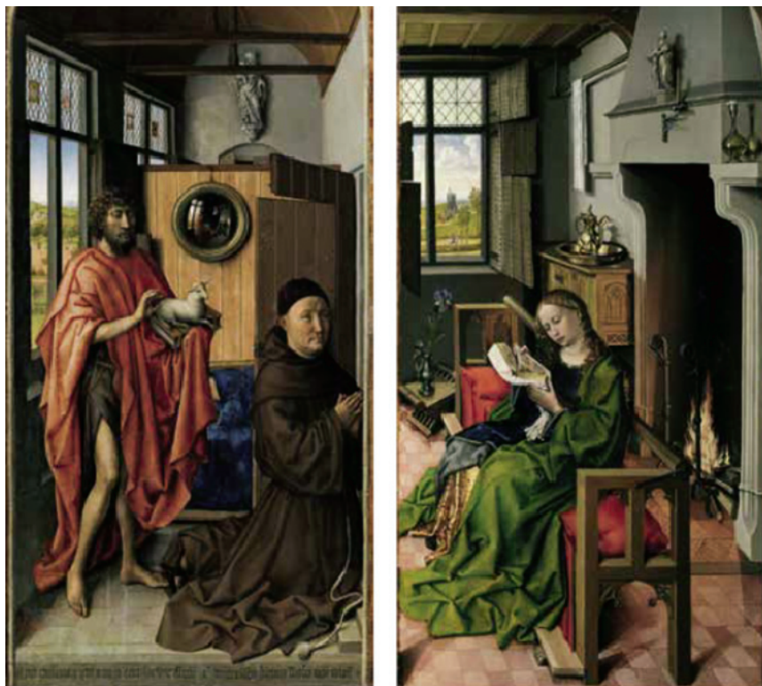
Sl. 11. Robert Campin, Heinrich iz Werla sa sv. Ivanom Krstiteljem (lijevo) i sv. Barbarom (desno), 1438.

Male skulpture izrađene u srednjem vijeku koje su služile kao religijski predmeti, tj. prikazi svetaca obično imaju slabije obrađenu bazu jer su se držale u kutijicama. Izrada takvih predmeta nestaje s protestantizmom, ali ponovno oživljava u obliku izrade sitne plastike za dekoraciju. 37 U ovom rapskom primjeru vidimo kako je baza čvrsta i omogućuje samostalno stajanje. Skulpture koje su bile profane prirode i izrađene prije 17. stoljeća bile su monokromatske, a na rapskoj je pronađen samo trag sjajnog smeđeg premaza.