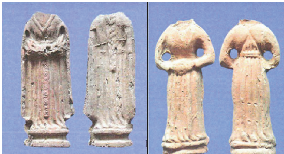
Sl. 9. Prednja i stražnja strana kipića koji prikazuju žene u odjeći iz 15. stoljeća (T. BORKOWSKI, 2004, 236, 237)

također čvrsto i stabilno kao na prethodnom primjeru. Obrađen je s obje strane. Oba primjera pronađena su bez glave (Sl. 9).