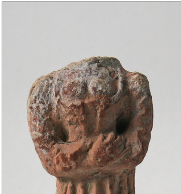
Sl. 2. Mala terakotna skulptura, detalj prednje strane