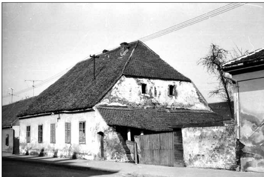
Slika 5. Kuća starog kućnog broja 71. Snimka iz šezdesetih godina 20. st.