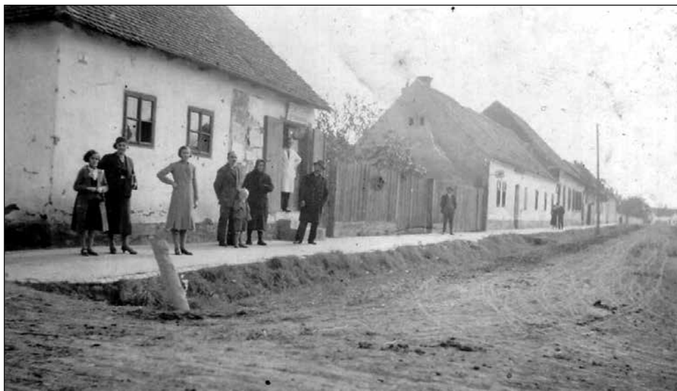
Slika 3. Red starih kuća na istočnoj strani ulice. U prvoj je (izgleda šezdesetih godina 19. stoljeća) bila brijačnica Stjepana Fehira.

Na mjestu nekadašnje kovačnice nalazi se trokatnica s poslovnim prostorima i potkrovljem, koja nosi kbr. 3. U zgradi se nalaze 17 stambenih i sedam poslovnih prostora. 17