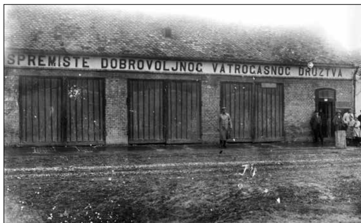
Slika 6. Spremište Dobrovoljnog vatrogasnog društva, koje se koristilo do završetka gradnje novog spremišta 1922. godine, a nalazilo se u južnom krilu nekadašnjih biskupijskih staja na području današnje tržnice.