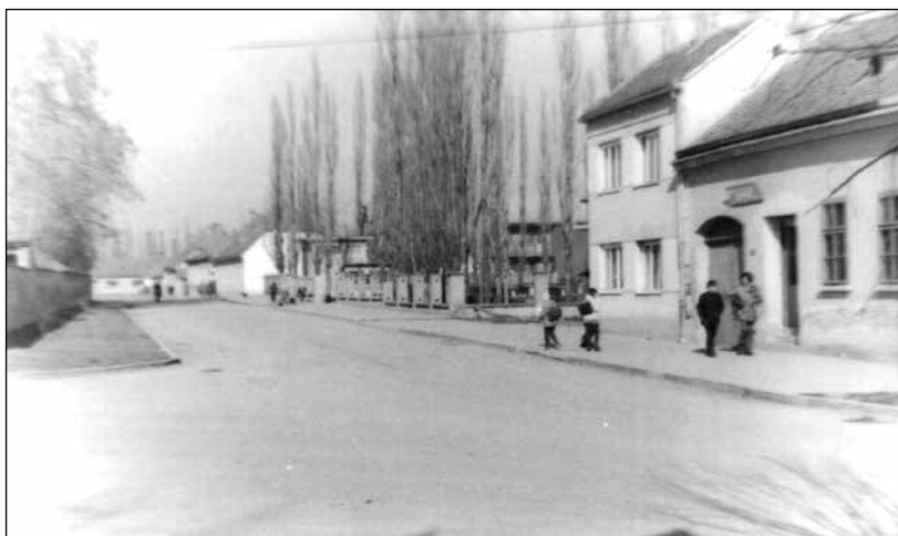
Slika 7. Pogled na ulicu s južne strane sedamdesetih godina 20. st.