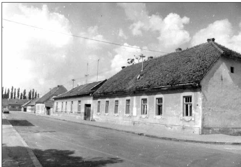
Slika 2. Red starih kuća na istočnoj strani ulice.

U nastavku teksta donosimo opis starih kuća koje su nekoć postojale na istočnoj strani ulice. Označili smo ih brojevima iz stare numeracije kuća iz sredine 19. stoljeća. 9 Sada su ovdje četiri trokatnice s potkrovljem.