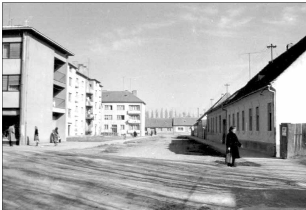
Slika 8. Pogled na ulicu s južne strane. Lijevo u zgrade na zapadnom dijelu ulice.

Nakon navedenih zgrada na zapadnom dijelu, dalje na jugu ulice nalazi se dugačak zid, iza kojeg se nalaze zgrade Bogoslovnog sjemeništa i starijeg Doma za umirovljene svećenike. Bogoslovno sjemenište ima adresu Strossmayerov trg 5.