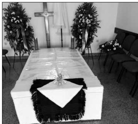
Slika 3. Odar ukrašen kajačkim tekstilom – vunena i bijela ponjava, Vrpolje 2019. godine.