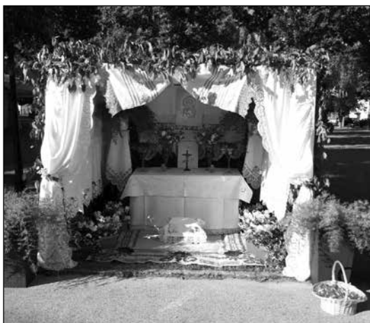
Slika 4. Sinica u Oriovcu 2024. godine.

od uporabnog tekstila. Najčešće postoji konstrukcija, okvir na koji se slažu prekrivači od bijeloga tkanja, čija je primarna svrha bila prekrivanje kreveta, a ta konstrukcija natkriva stol s vjerskim predmetima pred kojima se odvija dio obreda. Pred stolom je često i na zemlji vunena prostirka, na kojoj svećenik stoji dok izvodi obred. Na slici 4 prikazana je sinica u Oriovcu 2024. godine.