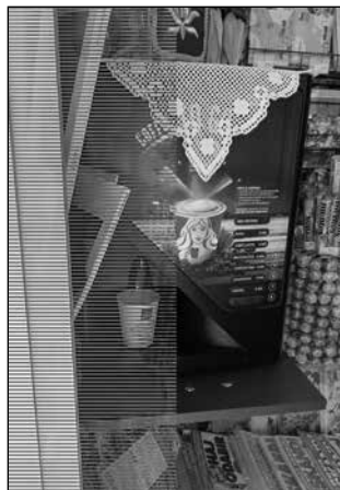
Slika 1. Ukrašeni stroj za kavu na kiosku prigodom Vinkovačkih jeseni 2021. godine.

odvijanja tih manifestacija najvidljiviji je i izrazito istaknut urbani šokački identitet. To se ne odnosi na samu smotru, nego na oznake šokačkoga identiteta po ta dva grada, npr. na trgovačkim objektima (npr. ukrašenim izlozima u Đakovu), gledatelje koji smotre prate odjeveni u tradicijsko ruho ili nose njime inspirirane detalje, tamburašku glazbu u ugostiteljskim objektima itd. U Vinkovcima je prilikom Vinkovačkih jeseni 2021. godine stroj za kavu na kiosku na vinkovačkom korzu ukrašen čipkastim stolnjačićem – heklanim miljeom (slika 1), komadom tekstila koji pripada šokačkoj tradicijskoj kulturi, i predmetom ukrašenim zlatovezom. Istraživanje je, dakle, usmjereno na kulturu zajednice ljudi čiji se pripadnici identificiraju kao Šokci, a ne na geografski definiran prostor.