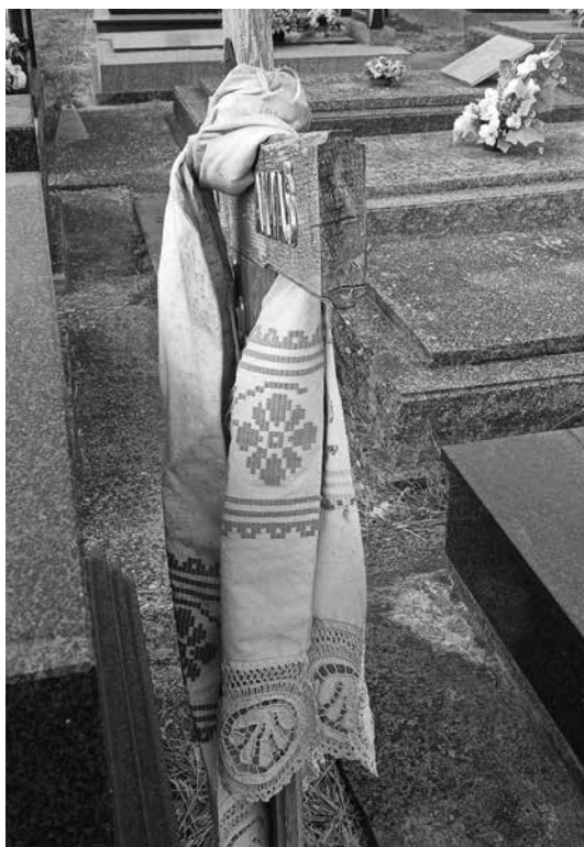
Slika 5. Križ ukrašen otarkom na groblju u Bogdanovcima 2024. godine.

Osim što se tekstilije koriste za ukrašavanje prilikom crkvenih blagdana, koriste se i prilikom događanja povezanih s folklorom, ali i životnim običajima. U prošlosti se prilikom ukopa svećeniku poklanjao otarak , a otarcima su bili ukrašeni i križevi u pogrebnoj povorci. U Bogdanovcima se održala praksa da se križ s imenom pokojnika ukrasi otarkom i ostavi na groblju. Na slici 5 takav je primjer, fotografija je snimljena 2024. godine. To je jedan od rijetkih slučajeva da je tekstil prepušten uništenju, jer se inače s njime vrlo pažljivo postupalo i čuvalo ga se.