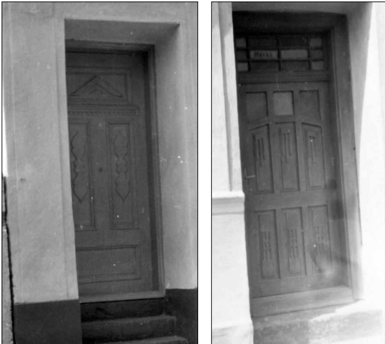
Slika 5. Ukrašena ulazna vrata na trim 70-ih godina 20. st.

Parcele su uglavnom dijelili na dva dijela. Prvi, prednji dio je avlija i u njoj je smještena kuća. Kuće su uglavnom bile zabatom prema ulici, sokaku ili drumu , s dva prozora na toj strani kuće. Na zabatnom trokutu često su se mogli vidjeti inicijali vlasnika i godina izgradnje kuće. Osim ukrašavanja zabata, pozornost se posvećivala i ulaznim vratima (slika 5). Osobito ako su to bila vrata s kojih se ulazilo na trijem s ulice. Ona su bila rezbarena geometrijskim motivima, a u otvore u gornjem dijelu umetano je obojeno staklo.