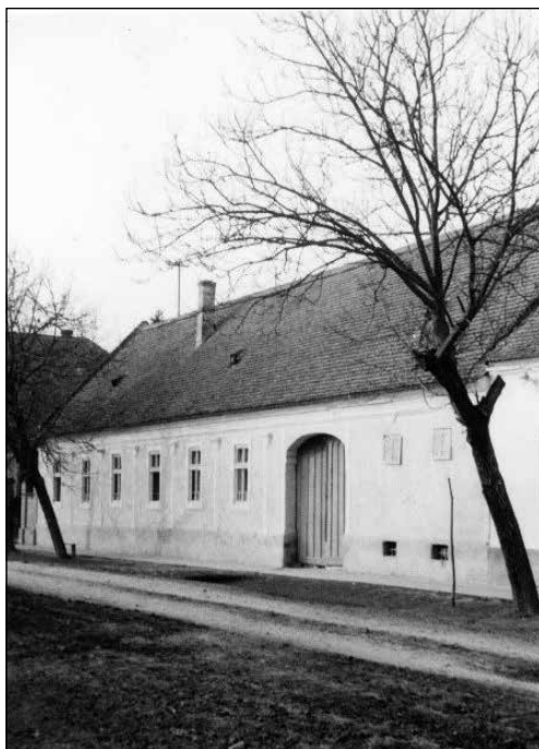
Slika 14. Kuća u Širokom Polju, 1974. godine.