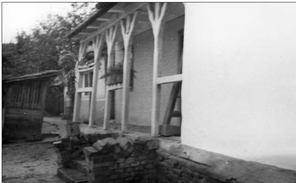
Slika 8. Trim ispred kuhinje i sobare.