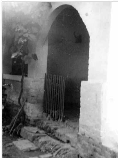
Slika 13. Doziđivana kuća u Strizivojnoj i ulaz u trijem, 1974. godine.