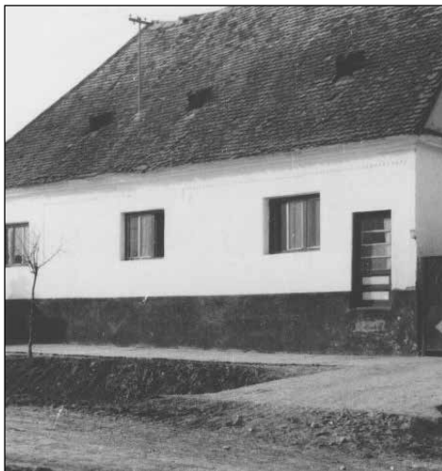
Slika 12. Najstarija kuća u Gašincima, 1974. godine.

„Kuća Pilić Mate M. Tita 2 koja je građena po izjavi Šilac Marije 1840. godine je višesobna zgrada, građena za zadrugu Šilac koja je ukoliko nije počela dioba imala preko 300 jutara zemlje. Kuća je nakon Šilaca promjenila nekoliko vlasnika i svaki je preuređivao za svoje potrebe, ali kako osnova postoji to ćemo uzimati onakvu kako je prvobitno građena.