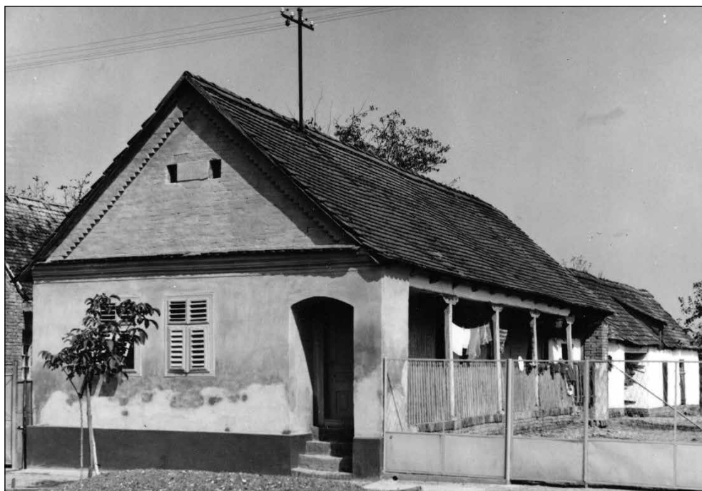
Slika 9. Trim cijelom dužinom kuće u Svetoblažju.

Drugi prepoznatljivi oblik slavonskih kuća jest kuća u ključ ili kuća na lakat . Ima tlocrtni oblik slova L i često se povezuje s Nijemcima u selu pa se naziva i švapska kuća . 27 Treći, rjeđi oblik kuće onaj je gdje je kuća građena cijelom širinom parcele, a u dvorište se ulazi kroz ajnfort . 28 S obzirom na to da je u Đakovštini najviše zastupljen uzdužni tlocrt s tri prostorije, s trijemom ili bez njega, samo ćemo donijeti opis i razmještaj tih prostorija.