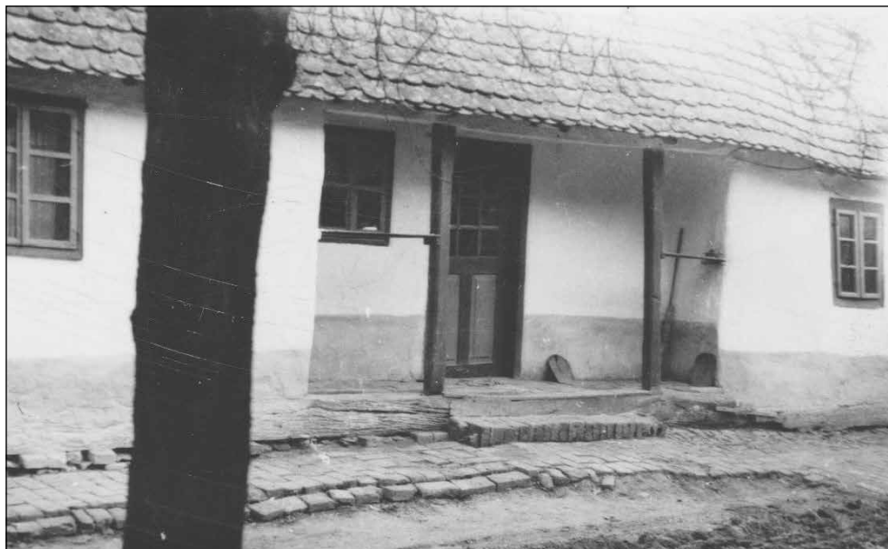
Slika 7. Trim samo ispred kuhinje.