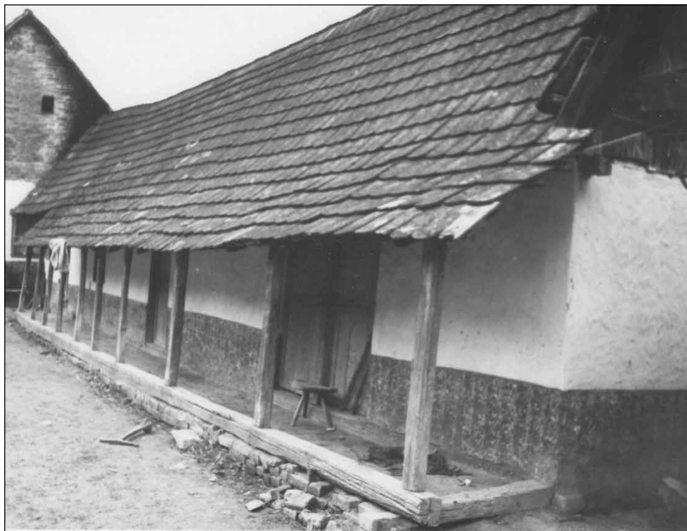
Slika 10. Selo Musić, kiljeri zadruge Velikanović.