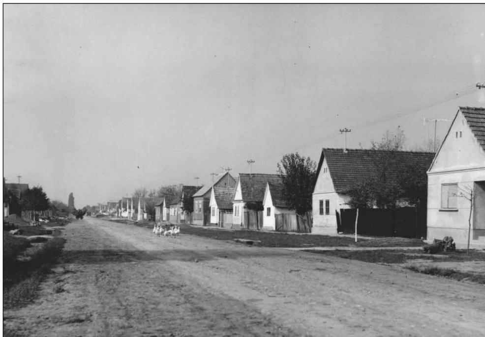
Slika 1. Izgled ušorene ulice u Budrovcima 70-ih godina 20. st.