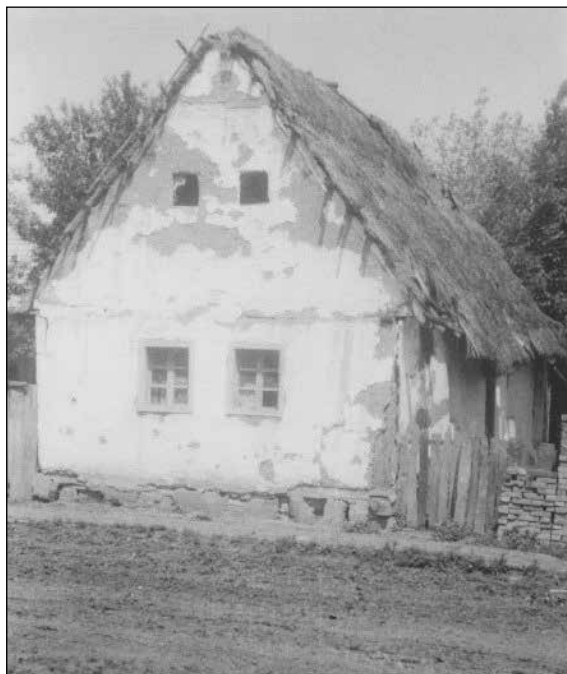
Slika 11. Kuća u Potnjanima, pokrivena raženom slamom, 1974. godine.

Većina kuća građena je po tipičnom trodijelnom tlocrtu s trijemom. Građa je drvena, a zidovi ciglom zidani. Sve su kuće pokrivene crijepom, neke su prije bile šindrom ili trskom, ali to više nije zatekao u selu, nego samo po sjećanju mještana i/ili vlasnika kuće. Samo je jedna kuća u Potnjanima pokrivena raženom slamom (slika 11.), ali kuća nije održavana i u ruševnom je stanju.