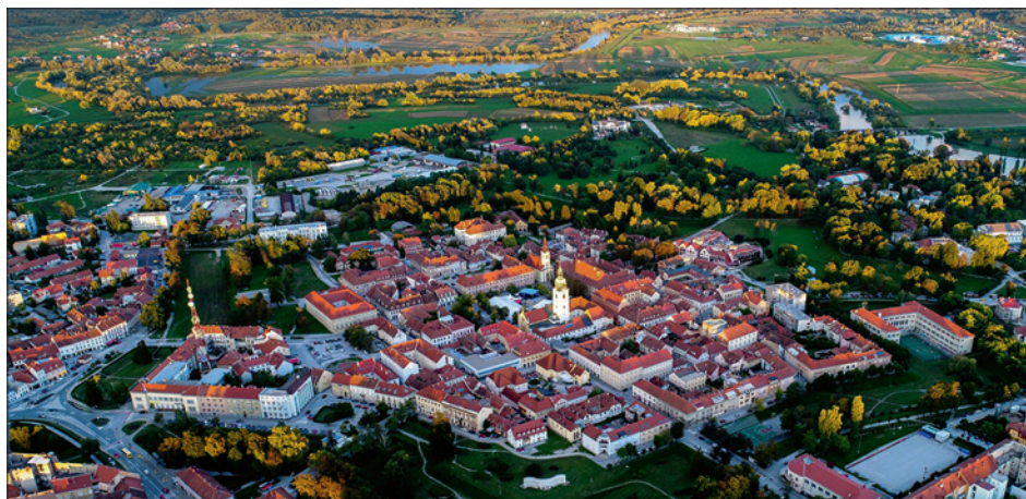
Sl. 4. Zračni snimak Karlovačke Zvijezde, povijesne jezgre grada osnovanog 1579. godine 26