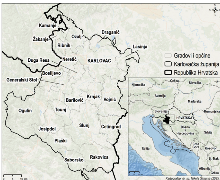
Sl. 1. Administrativna podjela Karlovačke županije (autor: N. Šimunić, 2025.)