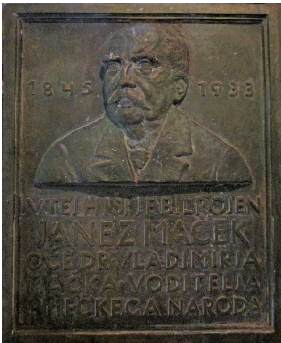
Slika 6. Današnje stanje spomen-ploče.

je i materijalnih problema, pa je unatoč osudama za izdaju odlučio napustiti apstinenciju. U veljači 1938. otputovao je u Beograd i zatražio potvrdu mandata zastupnika da bi mogao sudjelovati na skupštinskim sjednicama (time su mu isplaćene dnevnice za cijelo vrijeme od izbora 1935.). 173 Dana 2. ožujka 1938. Dobovišek je prvi put izašao pred Skupštinu kao nezavisni zastupnik. U