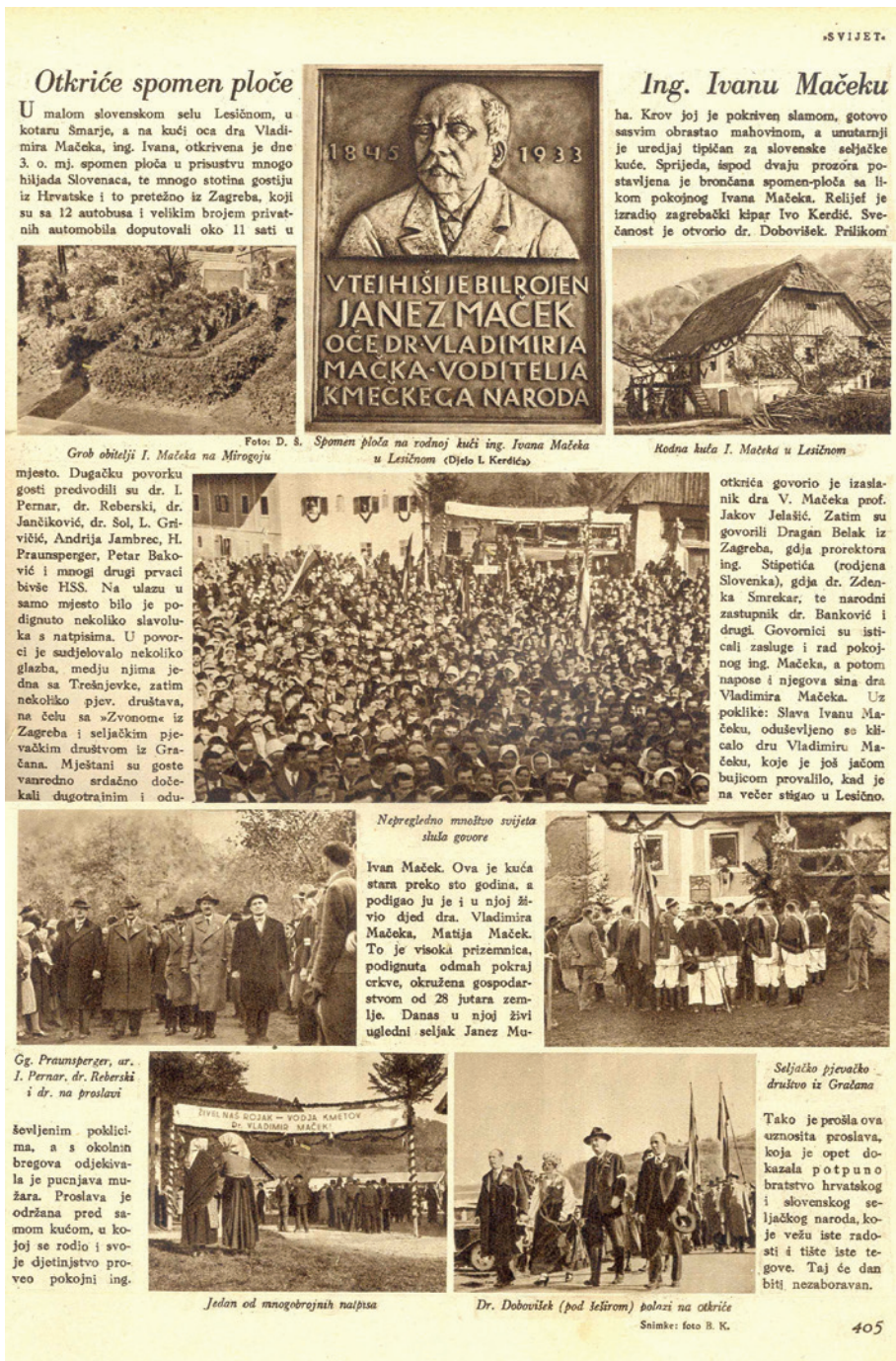
Slika 4. Fotoreportaža lista Svijet o otkrivanju spomen-ploče