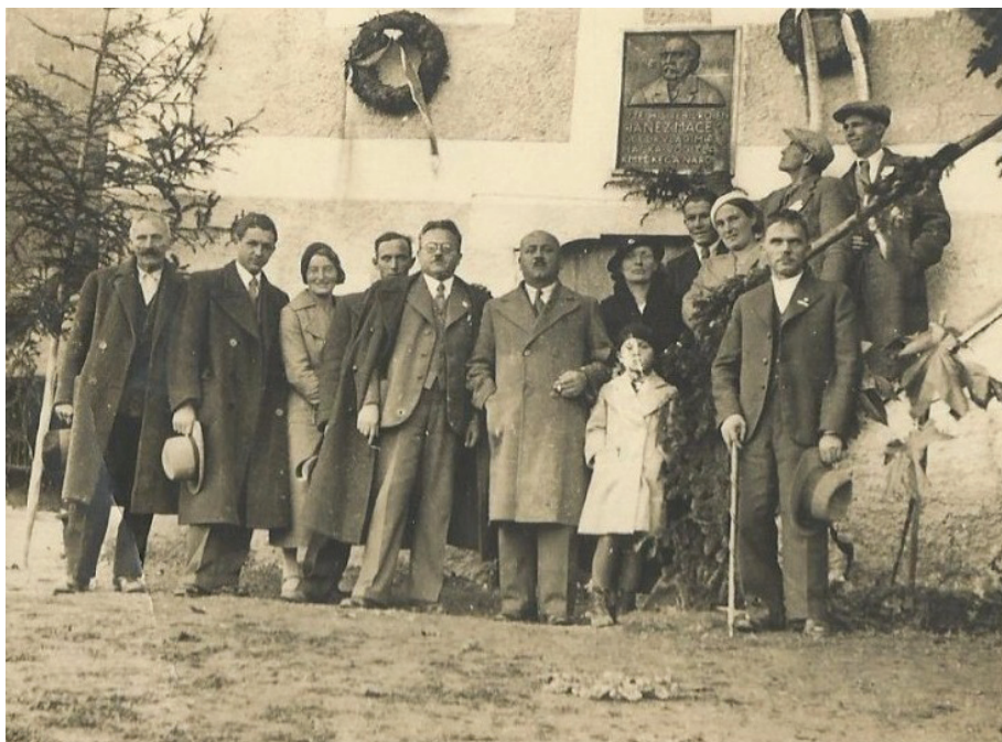
Slika 5. Razglednica s nepoznatom grupom ispred spomen-ploče