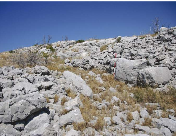
Slika 4. Stari Šibenik, ulaz na istočnoj strani utvrđenja