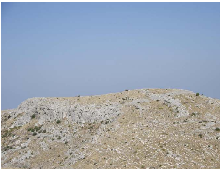
Slika 3a. Stari Šibenik, pogled sa sjeveroistočne strane