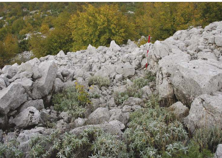
Slika 6. Kurlje, ulaz na sjeverozapadnoj strani gradine