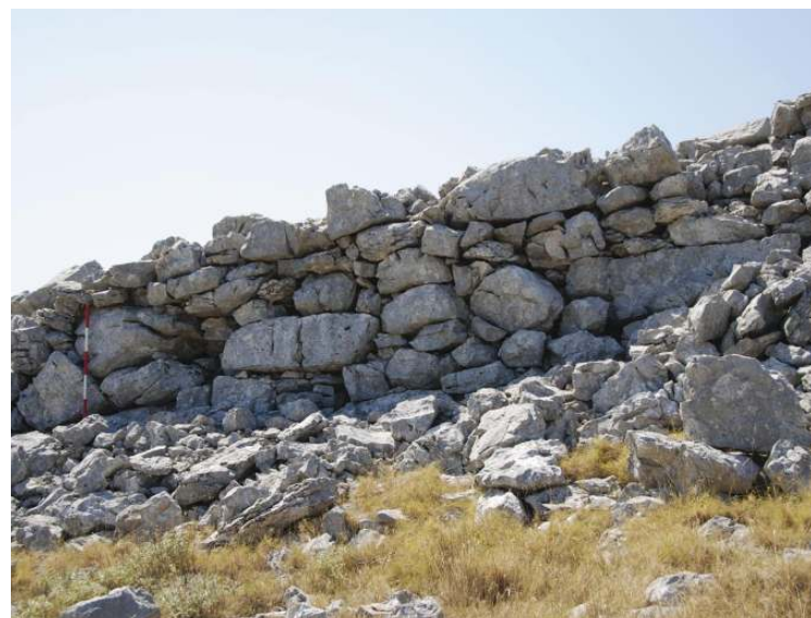
Slika 3b. Stari Šibenik, dio sjevernog bedema