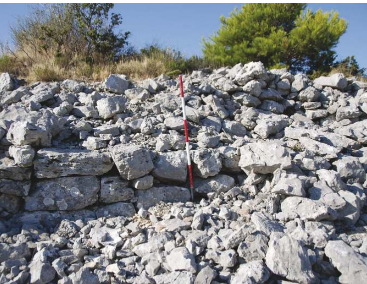
Slika 2. Mendulina, dio pojačanja na sjevernom potezu bedema