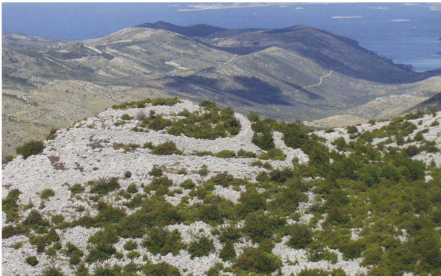
Slika 1. Kurlje, pogled s vrha na istočnoj strani