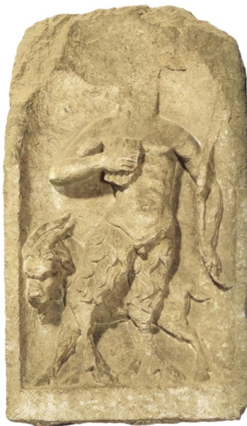
Slika 8. Votivni reljef Silvana iz Solina, Arheološki muzej u Splitu