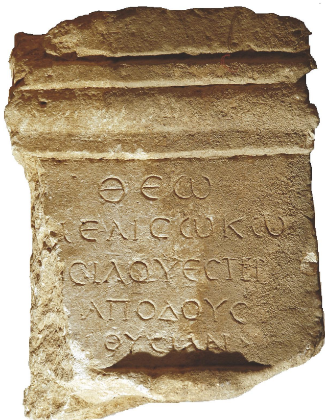
Slika 4. Melosokov žrtvenik iz Krnice, Zavičajni muzej Poreštine, Poreč