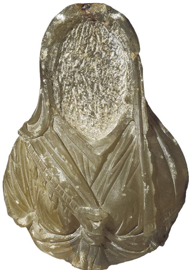
Slika 16. Poprsje Izide iz Vida, Arheološki muzej Narona, Vid