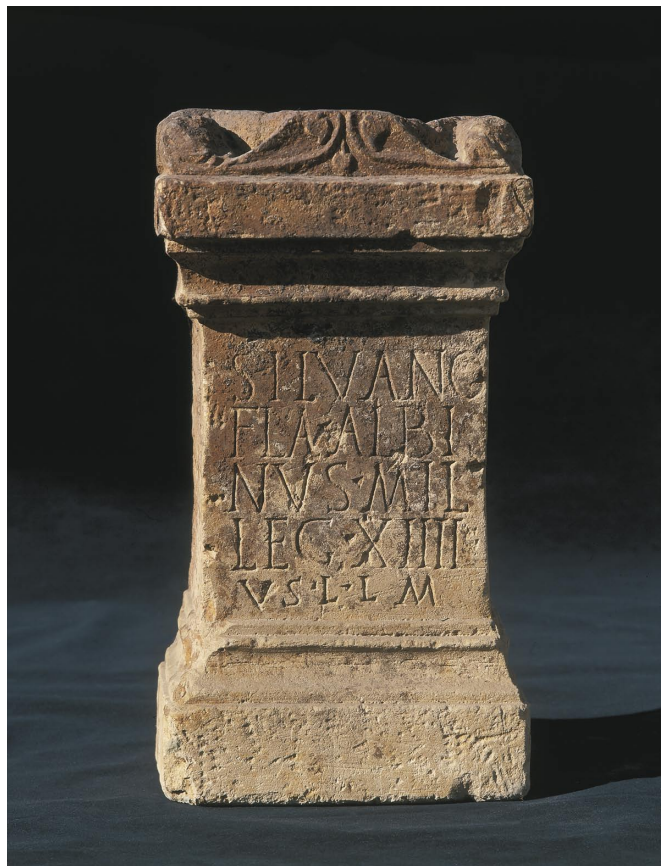
Slika 11. Žrtvenik Silvana iz Topuskog, Arheološki muzej u Zagrebu

S drugih područja, pa tako i s područja sjeverne Hrvatske, spomenici posvećeni Silvanu uglavnom su žrtvenici. Pronađeno je tridesetak žrtvenika i dva plastična prikaza. Najviše je Silvanovih žrtvenika, i to jedanaest, otkriveno u Topuskom, od kojih devet na jednom lokalitetu. Otkriće govori u prilog tezi da je na tom mjestu postojalo Silvanovo svetište. Svetište je, čini se, postojalo i u Daruvaru ( Aquae Balissae ), gdje su na jednom lokalitetu pronađena četiri Silvanova žrtvenika ( Pinterović 1975, str. 123-155 ). Jedan od tri žrtvenika na natpisu nosi posvetu Silvano M(agno)/ et Silvanae , a na drugom je reljefni prikaz Silvana s dvije družice, možda upravo silvanae . Prije nekoliko godina u Osijeku je na jednome mjestu otkriveno pet Silvanovih žrtvenika - što također