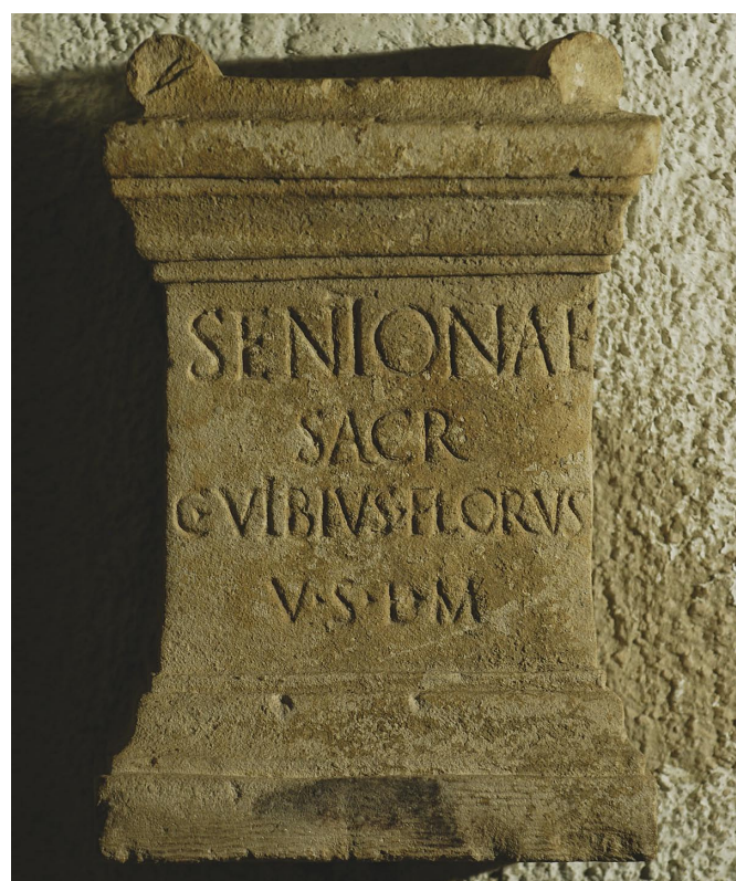
Slika 3. Žrtvenik Sentoni iz Labina, Narodni muzej u Labinu