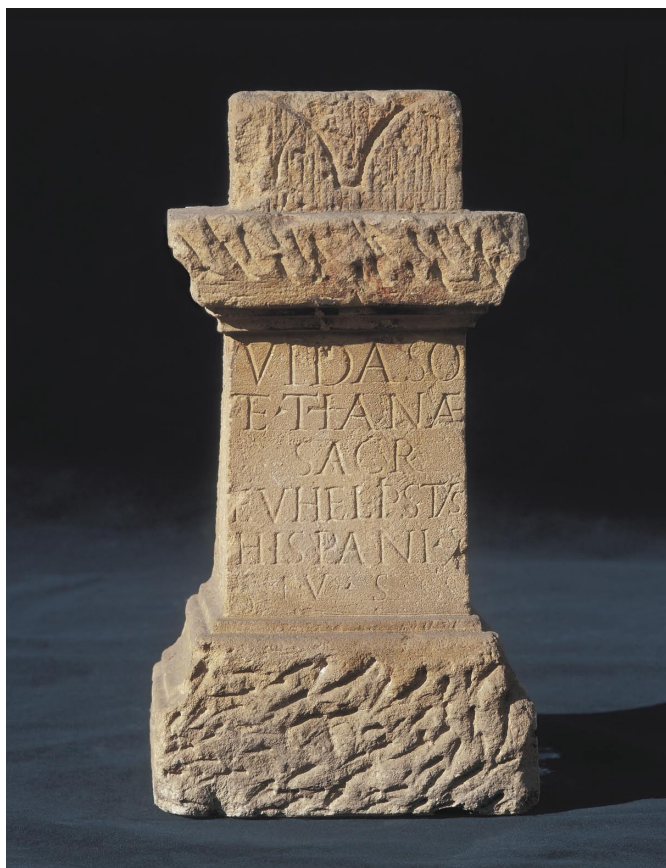
Slika 7. Žrtvenik Vidasa i Tane iz Topuskoga, Arheološki muzej u Zagrebu