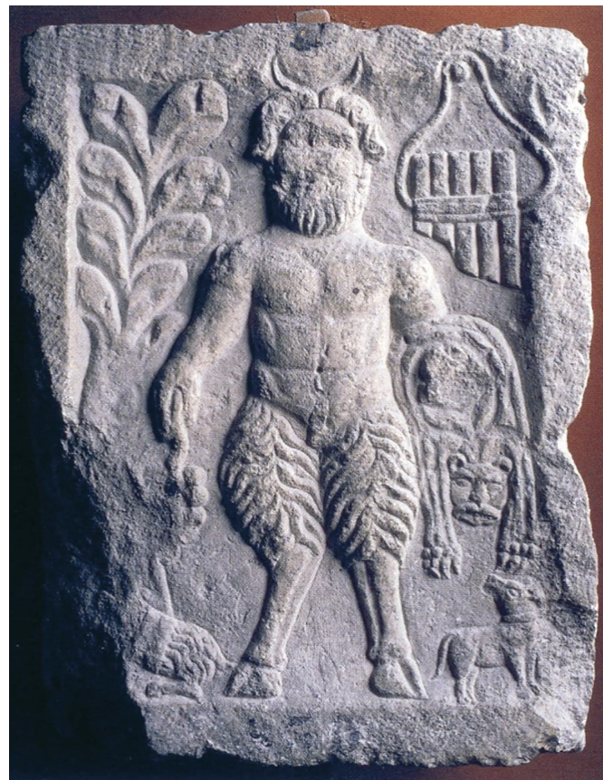
Slika 9. Votivni reljef Silvana iz Peruče, Arheološki muzej u Splitu