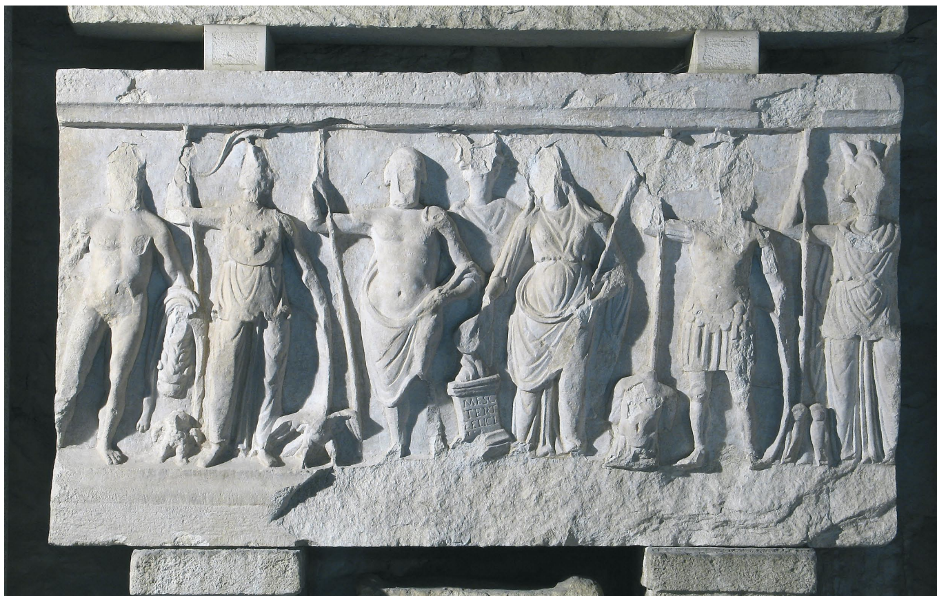
Slika 10. Reljef s prikazom rimskog Panteona iz Splita, Arheološki muzej u Splitu