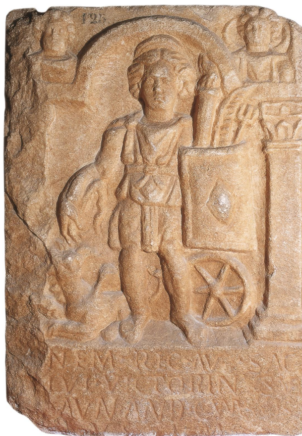
Slika 17. Votivni reljef Nemeze iz Šćitarjeva, Arheološki muzej u Zagrebu