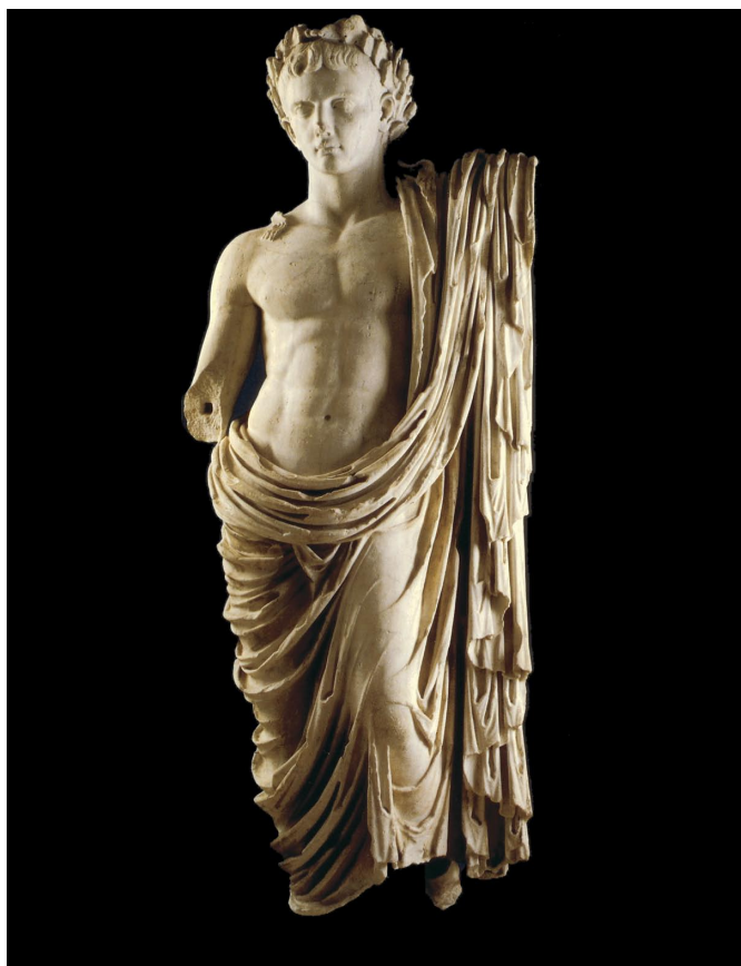
Slika 13. Augustova statua iz Nina, Arheološki muzej u Zadru