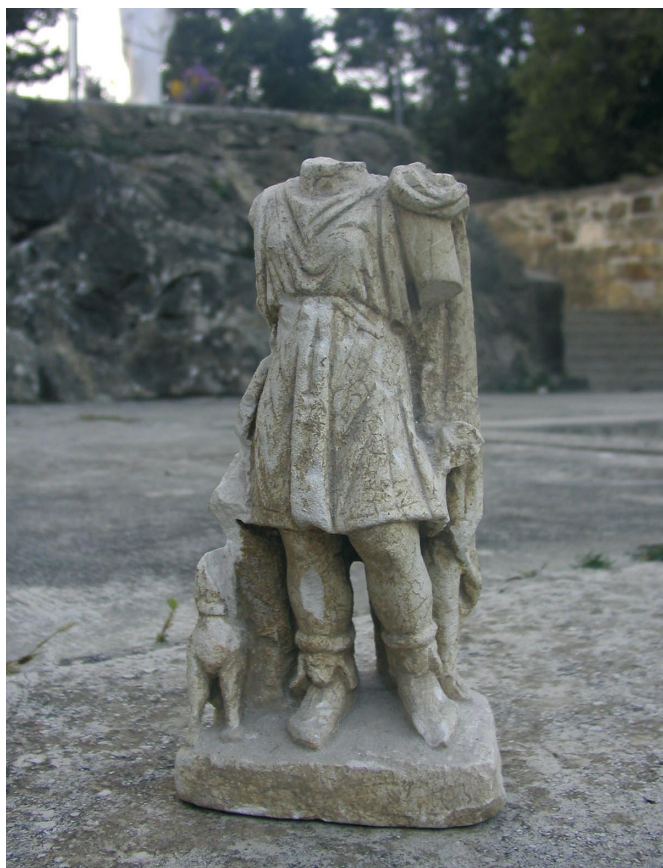
Slika 12. Dijanin kip iz Raba, Samostan sv. Eufemije u Kamporu