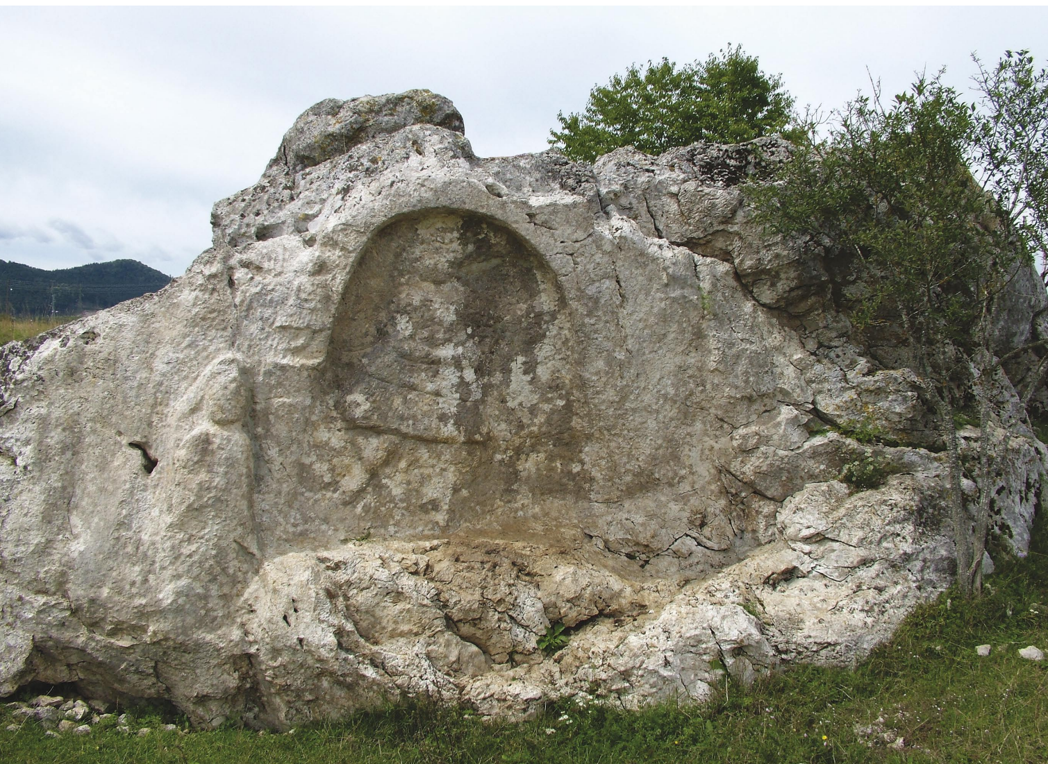
Slika 15. Mitrino svetište u Jurandvoru