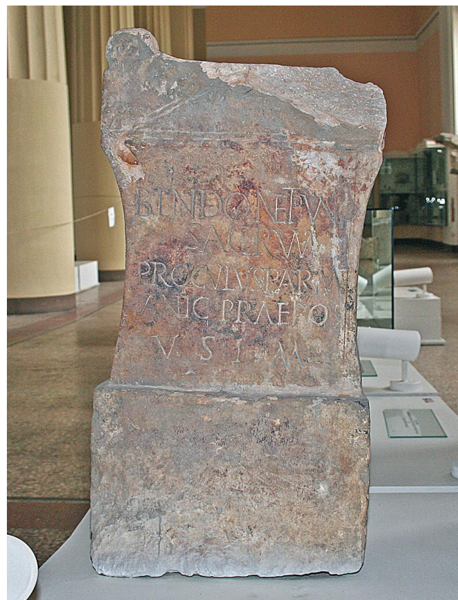
Slika 6. Žrtvenik s posvetom Bindu Neptunu iz Privilice, Zemaljski muzej u Sarajevu

Kako su potvrde štovanja kulta Binda Neptuna poznate samo s izvora Privilice, pretpostavlja se da se ondje nalazilo glavno svetište, u koje su hodočastili štovatelji s čitavog japodskog područja. Zanimljiv je podatak da je na jednom natpisu (CIL III 5483) iz Gleichenberga u Noriku ( Noricum ) zabilježeno žensko ime Bindho , koje su neki istraživači htjeli dovesti u vezu s japodskim Bindom.