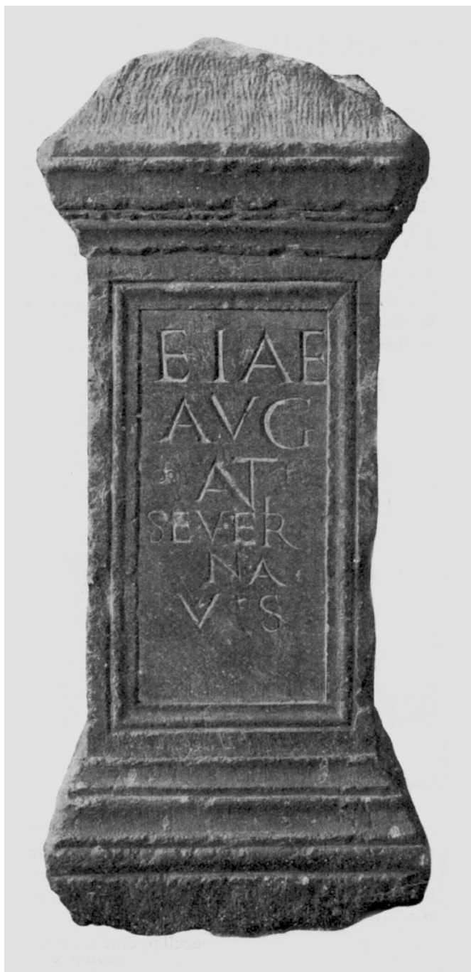
Slika 1. Ejin žrtvenik iz Pule, Arheološki muzej u Puli