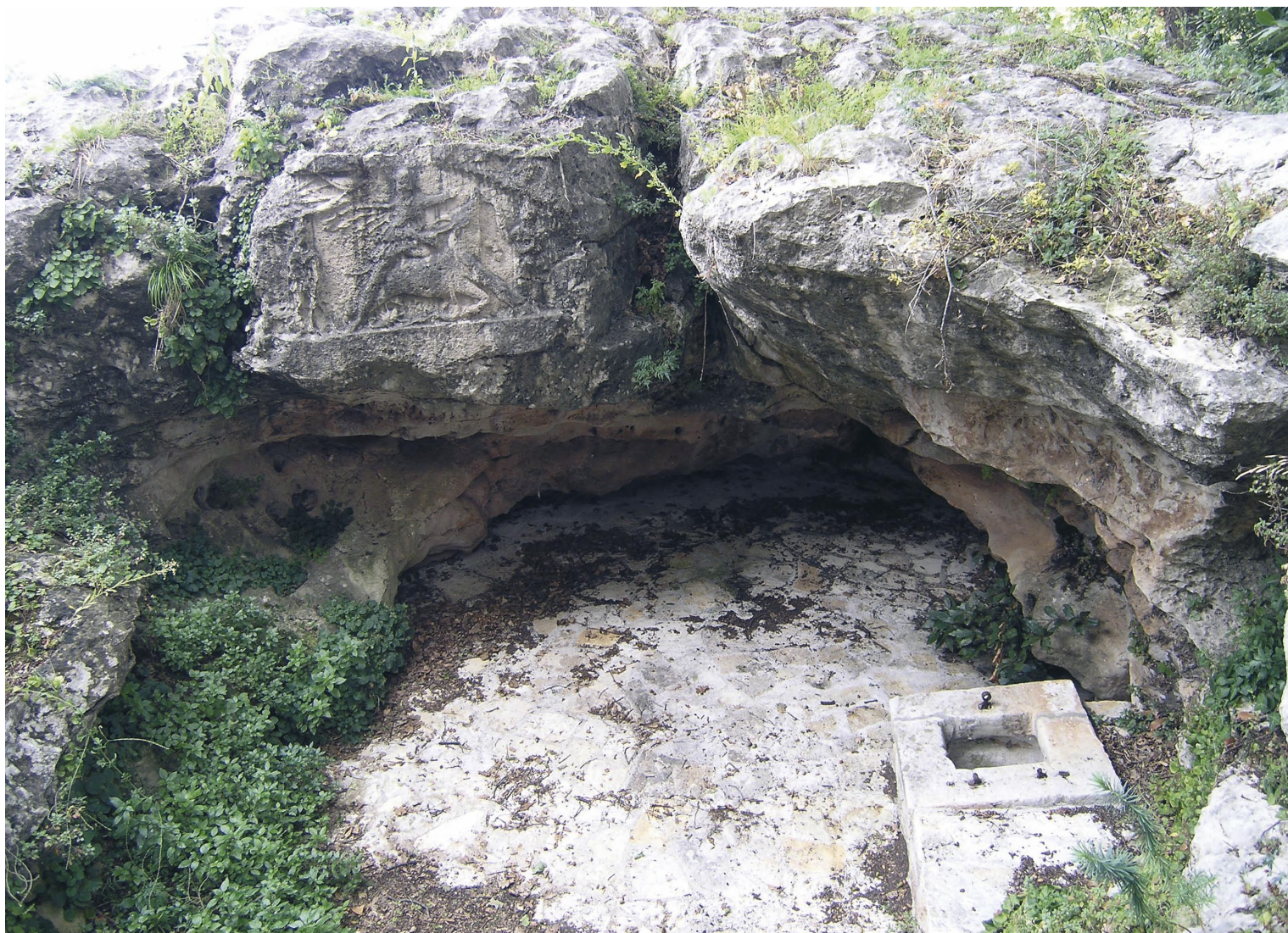
Slika 14. Mitrino svetište u Močićima