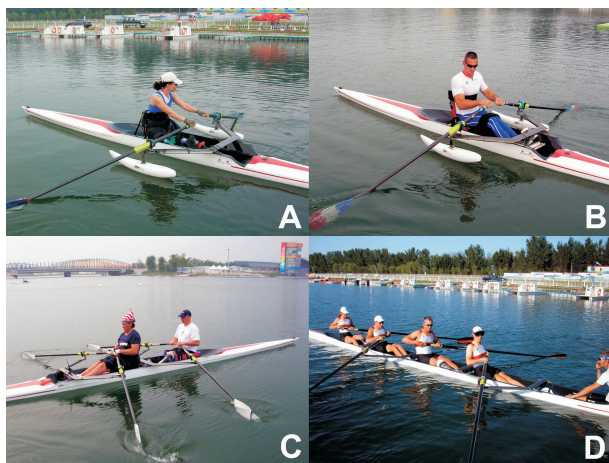
Slika 1. Natjecateljske discipline u prilagođenom veslanju: A) ženski samac (Izrael); B) muški samac (Francuska); C) dvojac na pariće (Sjedinjene Američke Države) i D) četverac s kormilarom (Njemačka). Svi su snimljeni na izlaznim pontonima tijekom POI u Pekingu, Narodna Republika Kina, 2008. godine.

Prilagođenim se veslanjem bave i žene i muškarci, a trenutno postoje četiri discipline (ženski samac – AW1, muški samac – AM1, dvojac na pariće – TAMix2x i četverac s kormilarom – LTAMix4+) u kojima se natječu veslači ovisno o stupnju tjelesnog oštećenja (Slika 1). Natjecanja se u svim disciplinama odvijaju na stazi duljine 1000 m.