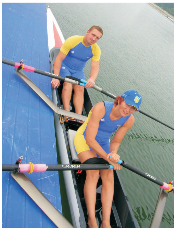
Slika 4. Ukrajinska posada dvojca na pariće u prilagođenom veslanju (TA kategorija) na POI u Pekingu, 2008. godine. Veslači preko bedara neposredno iznad koljena imaju povez (na čičak) koji ne dopušta funkcionalne kretnje u koljenima natjecatelja u ovoj disciplini.

tijekom veslačkog zaveslaja svrstavaju se u drugu kategoriju koja se naziva „Trup i ruke“ (engl. Trunk and arms, TA) (Slika 4). U tu kategoriju ulaze primjerice osobe nakon obostrane amputacije u razini koljena, osobe nakon ukočenja koljenskog zgloba te osobe koje imaju potpun prekid leđne moždine u visini prvog lumbalnog kralješka, kao i osobe s cerebralnom paralizom petog stupnja prema CPISRA. Veslači iz TA kategorije natječu se u dvojcima na pariće, a pritom veslači moraju biti različitog spola. Sjedalice su u njihovim čamcima nepomične, a iznad koljena imaju povez koji sprečava pregibanje u koljenima čime se onemogućava bilo kakvo korištenje nogu tijekom zaveslaja. Valja naglasiti da je primjenom navedenih pravila prilagođeno veslanje jedan od rijetkih sportova koji u potpunosti zadovoljava sve zahtjeve vezane uz spolnu ravnopravnost i jednaku zastupljenost oba spola na natjecanjima.