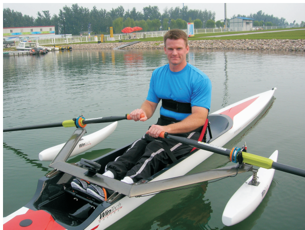
Slika 5. Veslač SAD iz A kategorije koji se natjecao u samcu na POI Peking, 2008. godine. Ispod izbočnika nalaze se plovci koji dodatno stabiliziraju čamac i sprječavaju prevrtanje. Veslač preko prsnog koša i bedara ima povež koji se oslobađa jednim potezom ruke.

naziva „Ruke“ (engl. Arms, A) (Slika 5). U tu se kategoriju svrstavaju osobe koje primjerice imaju potpun prekid leđne moždine u visini desetog torakalnog kralješka te osobe s cerebralnom paralizom četvrtog stupnja prema CPISRA. Veslačice i veslači iz A kategorije se natječu u samcima. U čamcima imaju fiksne sjedalice s naslonom na kojem se nalazi povež koji stavljaju preko prsnog koša u prvom redu s ciljem da stabilizira trup, a potom i da onemogući bilo kakvo korištenje donjeg dijela trupa tijekom zaveslaja.