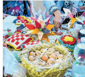
Duh prošlih vremena

U pravilu, roga je samo jedna od mnogih vještina rukovtvorina nastalih spretnim rukama koje njeguju umijeca poput tkanja, vezanja, heklanja, pletenja i šivanja, prenošeci ih s koljena na koljeno. Iako na prvi pogled može djelovati složeno, posebno ručja koja nije vična rukovtvorina, zapravo pripada među lakše ručne radove. Mnogim našim kazivačicama bila je zapravo i jedan od prvih vlastitih izlazova u svijetu ručnoga rada. Prisjećajući se dana kad su je izradivale, žene često evociraju uspomene na školske prijateljice i prijatelje, brižne učitelje i učitelje, prve simpatije i udvaranja. Bili su to za njih bezbrižni dani kad se pjevalo svugdje i svagda, kad je kolo zaista bila igra i kad su pripovijedanja starijih bila i zabava i škola. Pa