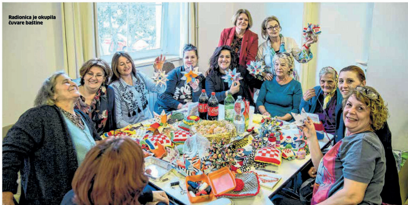
Radionica je okupila čuvarice baštine

Iako na prvi pogled može djelovati složeno, roga pripada među lakše ručne radove. Mnogim našim kazivačicama bila je i jedan od prvih izlazova u svijetu ručnoga rada. Prisjećajući se dana kad su je izradivale, žene često evociraju uspomene na školske prijateljice, brižne učitelje, prve simpatije i udvaranja. Bili su to za njih bezbrižni dani kad se pjevalo, kad je kolo zaista bila igra i kad su pripovijedanja starijih bila i zabava i škola. Pa sjetete se onda i raznih anegdota, opjevanih u narodnim stihovima tzv. starovinskog pjevanja, govori Dunatov