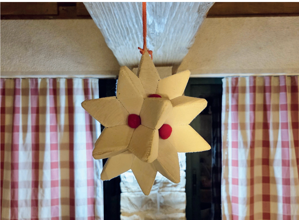
Slika 2. Svadbena roga u Rodaljcama

kod Nove Gradiške, naime, unazad nekoliko godina na poticaj ženske Udruge za promicanje aktivnog sudjelovanja Studio B na tjednim se susretima izrađuju identični predmeti s nijansama u izradi, većinom namijenjeni za prodaju na sajmovima. Ondje je predmet poznat pod drugim imenom – šiška , a djelovanjem udruge postao je prepoznatljivim simbolom sela, koliko im je poznato, jedinstvenim u okolici.