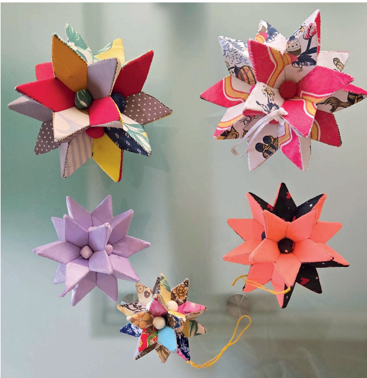
Slika 1. Primjeri roga