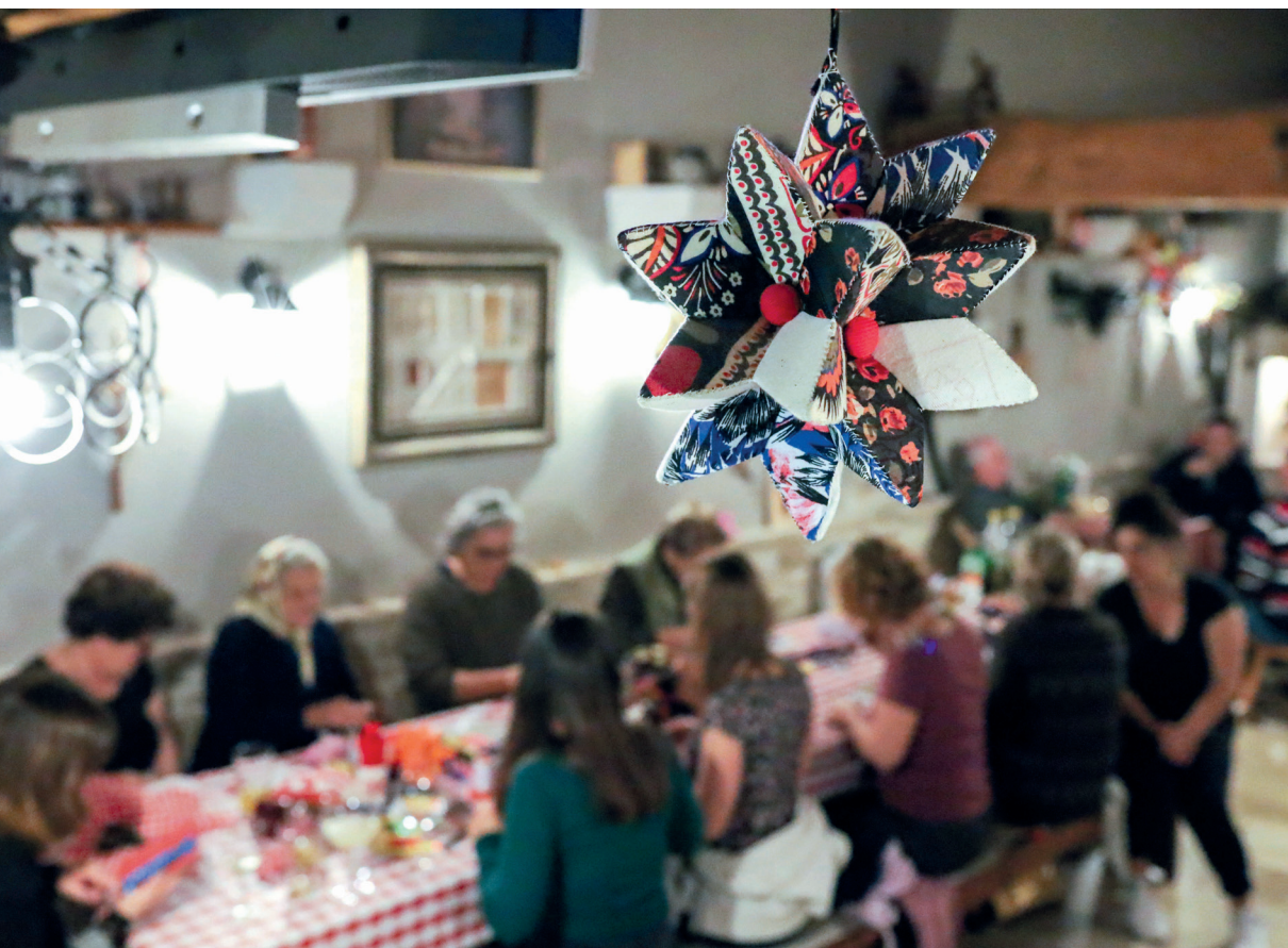
Slika 3. Susret-radionica izrade roge u Srcu Bukovice , Rodaljice (iz privatne arhive autora)

su svoje prve roge izradile tek na susretima u okviru Udruge Studio B, 7 premda se šiška jest izrađivala u Bodovaljcima oko 1960-ih godina, ali i ranije. Kod njih se inicijativa za suvremenu revitalizaciju prakse javila kada je žena iz „komšiluka“ pokazala jednoj od polaznica radionica tehniku izrade predmeta za koji su u tom trenutku smatrale da je autohtoni bodovljanski ukras. Izradu šiške uklopile su u širi okvir izrade i drugih tradicijskih ukrasa na radionicama, često tematski obilježenih godišnjim dobom ili blagdanom, pa tako osim roge izrađuju i npr. cvijeće ili ukrasne bundeve od tkanine.