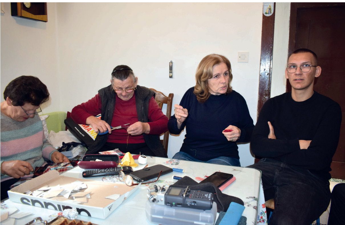
Slika 5. Fotografija s terena, Donji Bitelić

originalnu moravsku zvijezdu potaknuta činjenicom da se i ona prodavala u posebnim kompletima za sastavljanje pa ju je svatko mogao vlastoručno sastaviti. 16 Štoviše, pretpostavlja se da njezini početci sežu u prvu polovicu 19. stoljeća kada su je u njemačkom internatu u Nieskyju dječaci izrađivali u okviru satova geometrije (usp. Petig 2015: 167). Svakako, zanimljiva je paralela koju možemo povući s našom pričom, budući da su mnoge naše kazivačice u razgovoru istaknule kako su svoje prve roge izradile upravo u osnovnoj školi, najčešće u okviru nastave Domaćinstva ili Tehničke kulture . Unatoč ovom podatku, u Hrvatskom školskom muzeju u Zagrebu dosad nismo uspjeli pronaći nijedan pisani ili materijalni podatak koji bi potvrdio rogu kao dio nastavnog programa. Tako je trag njezine pedagoške uporabe u pedesetim i šezdesetim godinama prošlog stoljeća zasad ostao na razini usmene predaje, što upućuje na nužnost daljnjih istraživanja i arhivskih uvida.