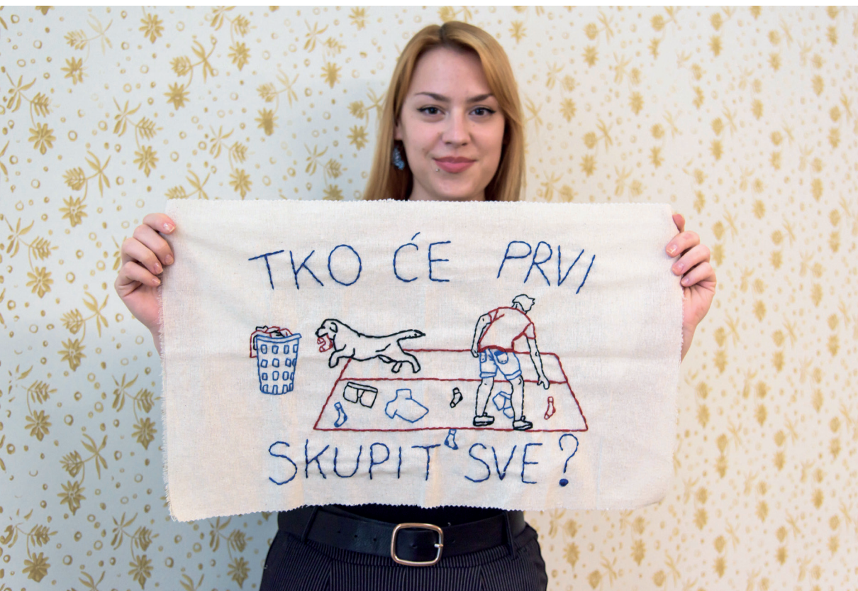
Slika 2. Sudionica radionica reinterpretacije zidnjaka

godina 20. stoljeća. Vješali su se na zid, obično u kuhinji, prvo kao zaštita od prskanja tijekom kuhanja, a kasnije i kao ukrasni predmeti koji su prenosili razne poruke. One su se mogle ticati osobne higijene, zdrave prehrane, bontona i slično, no najčešće teme bile su ljubav te muško-ženski odnosi. Od zadanih tradicijskih vrijednosti rijetko se odstupalo, a žene su uglavnom bile prikazivane kroz prizmu poslušnosti, ljubavi i obiteljske dužnosti. Ovaj radionički ciklus usmjerio se na kritičko čitanje zidnjaka, ukazivanje na rodne stereotipe prikazane na njima, njihovu suvremenu reinterpretaciju i osnaživanje žena (Slika 2). Prvi susret bio je posvećen osmišljavanju osnažujućih poruka koje reflektiraju suvremene potrebe i identitete žena, dok su se u preostala tri susreta te poruke vezle na pamučnu tkaninu. Voditeljice radionica bile su samostalne umjetnice Hana Lukas Midžić i Ivana Ognjanovac, koje su kod sudionica poticale kreativnost, zajedništvo i kritičko propitivanje tradicionalnih obrazaca.