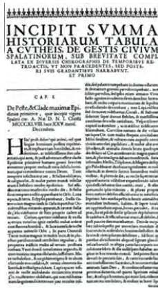
Lučić, Ivan, De regno Dalmatiae et Croatiae libri sex , Amstelaedami, 1666., stranica 381, Tabula a Cutheis .

Peste, & Clade maximae Epidemiae primitivae, quae incepit vigere Spaleti cur. A. Nat. D. N. I. Christi MCCCXLVIII, luce XXV mensis Decembris. Tanta fuit mortalitas, ut vix sacerdotes sufficerent ad sepeliendum mortuos, nec ullus locus vacuus esset in coemeteriis. Multi sine sacramentis decesserunt, et urbs tota in luctu et terrore versabatur. (O kugi i velikoj prvotnoj pošasti koja je počela harati u Splitu 25. prosinca 1348. godine. Smrtnost je bila tolika da svećenici jedva stizahu pokapati mrtve, a nijedno mjesto na grobljima nije ostajalo prazno. Mnogi su umrli bez sakramenata, a cijeli je grad bio obavijen tugom i strahom.) 76