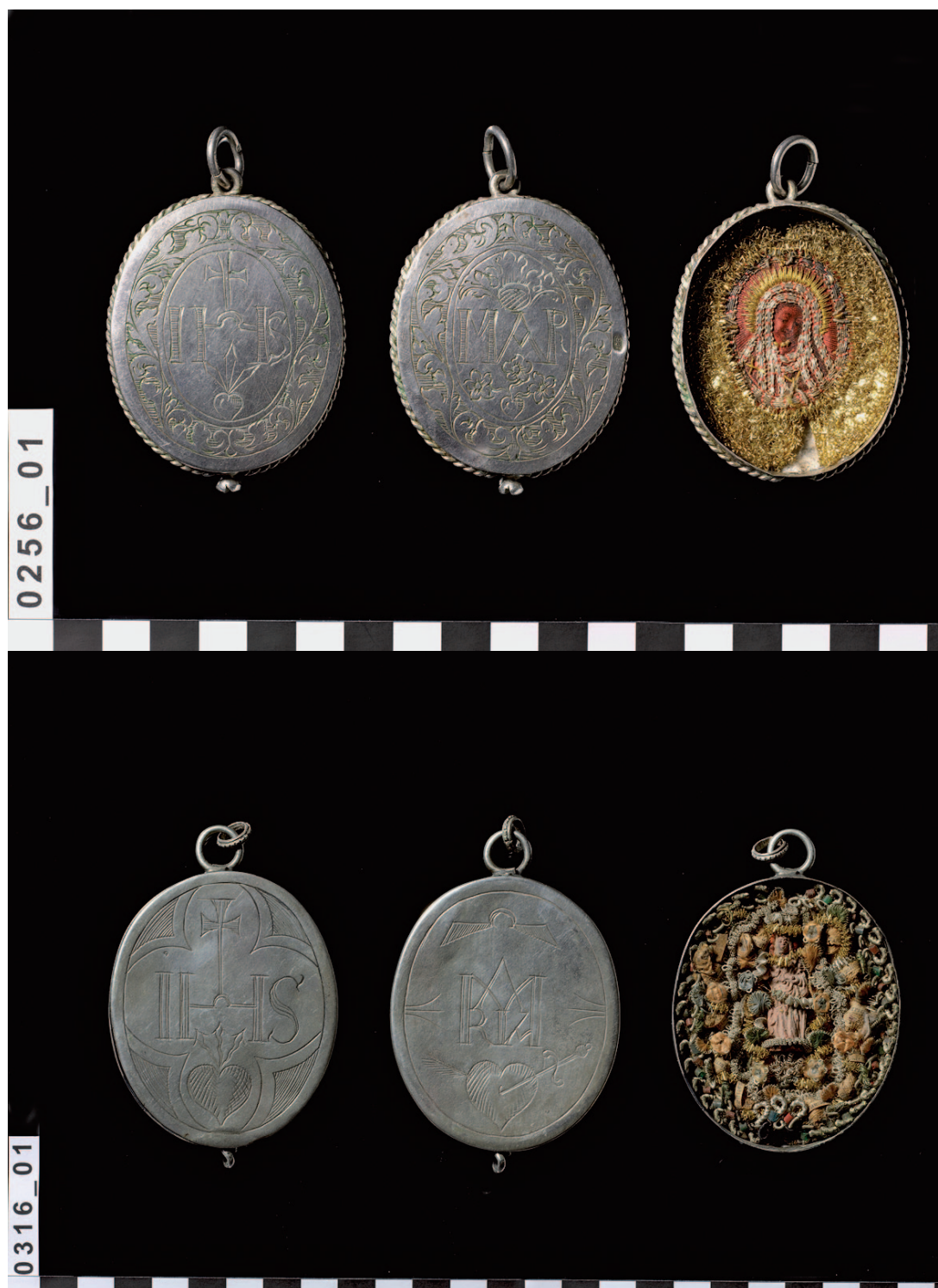
Sl. 1 Primjerci putnih blagoslova proizvedenih u 18. stoljeću vjerojatno u Austriji (gornji) i južnoj Njemačkoj (donji)