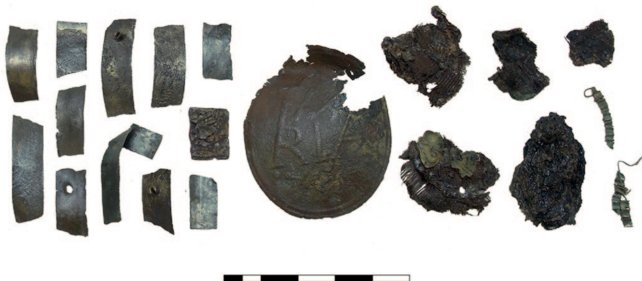
Sl. 2 Putni blagoslov iz gr. 262 oko crkve sv. Nikole biskupa u Žumberku. Lijevo su ulomci bočnih stranica, u sredini jedna sačuvana stranica, najvjerojatnije stražnja, a desno su ostaci ispune. Krajnje desno su vidljiva dva ulomka savijenog lima od bakrene legure oko kojeg je namotana metalna žica, odnosno ostaci posebnog samostanskog veza Klostergespunstarbeit

Fig. 2 Travel blessing from Grave 262 around the Church of St. Nicholas the Bishop in Žumberak. On the left are fragments of the side walls; in the centre is one preserved plate, most likely the back plate; and on the right are the remains of the filling. On the far right, two fragments of bent copper alloy sheet metal are visible, around which metal wire is wound—specifically, the remains of specialized monastic embroidery, Klostergespunstarbeit