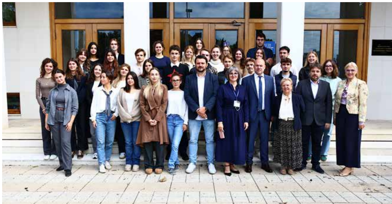
Studenti studijskog programa Veterinary Medicine nakon uvodnog predavanja (autor: Juginović, 2024.).