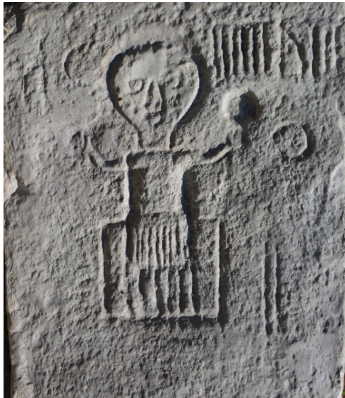
Slika 2: Svete gore nad Bistrico ob Sotli, Slovenija. Figuralni relief

Morda se je nekaj podobnega zgodilo v Plaveču na Moravskem (R Češka), kjer je v romanski rotundi Marijinega vnebovzjetja na vrhu kot kamnita spoljva vzdana štiriobrazna figura (slika 3), ki bi lahko ustrezala Svetovitu.