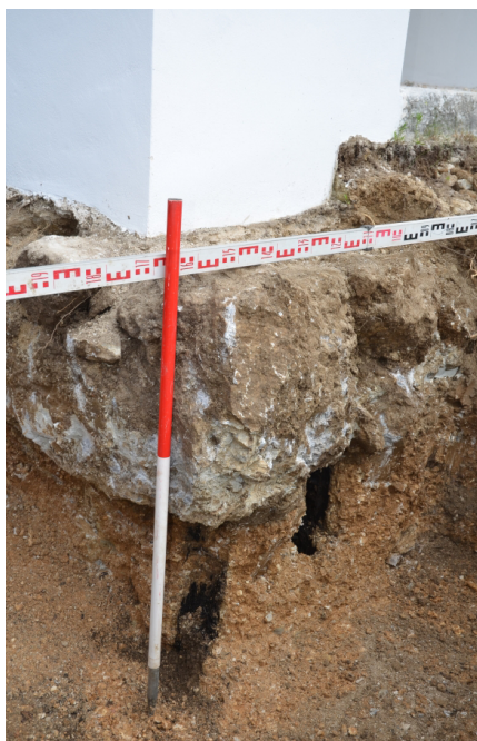
Slika 6: Sv. Kancijan, Reka pri Cerknem, Slovenija. Vidna kola pod zahodnim vogalom cerkve

Pod Kresnikovo cerkvijo stoji na drugem bregu Idrjice Sv. Kancijan . Gre za srednjeveško cerkvico, ki ima prvo pisno omembo iz leta 1570 (Höfler 2016:47). Os njene ladje ima azimut 60^\circ , kar ni astronomska smer, ampak govori za usmeritev na neko konkretno sosednjo točko. To bi lahko bil sv. Janez Kresnik. Pravokotnica proti tej cerkvi z osjo sv. Kancijana tvori kot 60^\circ , kar nakazuje uporabo enakostraničnega trikotnika pri določanju tlorisa cerkve. Kakorkoli, leta 2016 so pri podbetoniranju temeljev opazili, da zahodni vogal cerkve stoji na skupini (slika 6) najmanj dveh lesenih kolov (Mlinar 2017). Ker izkop ni segel za zunanjo ravnino vogala, ne vemo, ali je za obema koloma stal še tretji kol. Vsaj verjeten pa je. Koli pod vogalom tam nimajo nobenega statičnega pomena in njihov obstoj lahko pojasnimo samo simbolno. Gre za uporabo tehnike gradnje