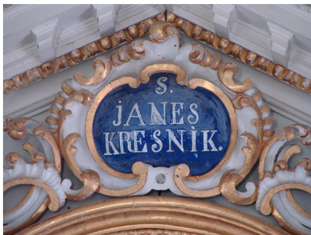
Slika 5: Sv. Janez Kresnik, Šebrelje, Slovenija. Napis v cerkvi

Vendar ima ta šebreljska cerkev prav posebno nadaljevanje. Leta 1763 je bila po odredbi cesarja Jožefa II. porušena. Šebrelje so v 19. stoletju najverjetneje spadale v skrivno staroversko teritorialno skupnost »Cerkljanska gmajna« (Pleterski 2022:129, sl. 4). Staroverci so bili tedaj v vasi tako močni, da so uspešno dosegli postavitev novega