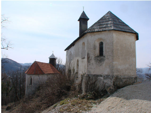
Slika 1: Jurijeva (spredaj) in Martinova (zadaj) kapela na Svetih gorah nad Bistrico ob Sotli, Slovenija