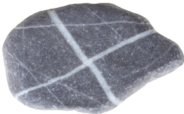
Slika 9: Krint, Slovenija