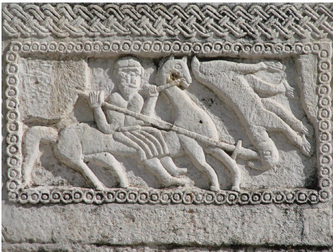
Slika 4: Žrnovnica, Hrvaška. Relief na zahodni fasadi Blažene gospe

v njem dvoboj Peruna in Velesa (Milošević 2013:41–63), Belaj borbo sv. Jurija s pošastjo (Belaj 2012). Opozarjam, da Perun pomeni funkcijo gospodarja strele, ta funkcija pa v krožnem teku leta prehaja z moške na žensko mitično osebo in obratno. Zato ne preseneča, da oseba na žrnovskem reliefu nosi brado, hkrati pa jezdi na konju »po žensko« (podrobneje: Pleterski 2023:311–314). Prav različno tolmačenje prizora dokazuje, kako mojstrsko je znal klesar doseči njegovo mnogopomenskost, da je ustrezala predstavam vsakega gledalca, tako kristjana kot staroverca. Je bil naročnik reliefa staroverec, ki se je pretvarjal, da je kristjan? V obratni možnosti ne vidim smisla.