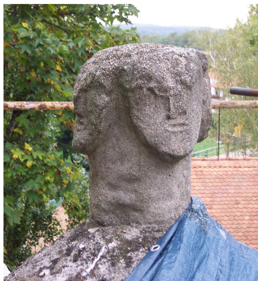
Slika 3: Plaveč, Moravska, Češka. Štiriobrazna figura na vrhu rotunde