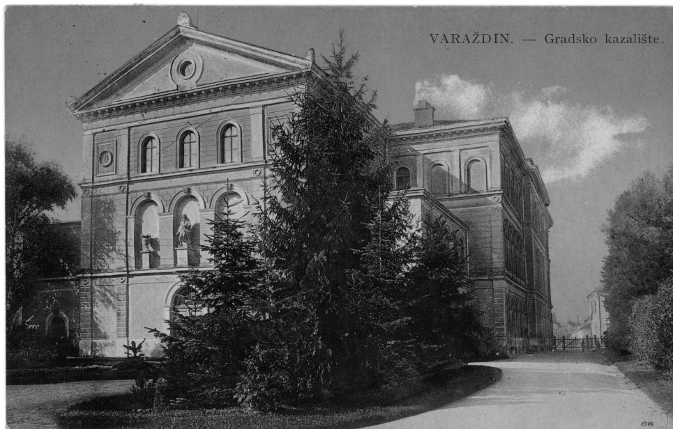
Fotografija 1. Razglednica Vatroslava Jagića, prednja strana; putovala 6. kolovoza 1910. godine.

Razglednica sadrži niz višeslojnih informacija koje su poput tkanine nastale sabijanjem i ukrštanjem vizualnoga i tekstualnoga sadržaja koji je ispreplitan od trenutka njezine proizvodnje do slanja u varaždinske poštanske ured. Najprije je potrebno osvrnuti se na relevantnu historiografiju.