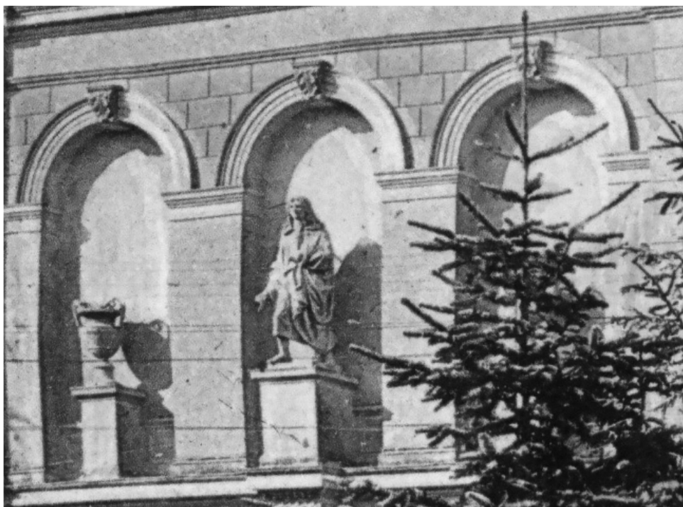
Fotografija 3. Razglednica Vatroslava Jagića, detalj pročelja sa skulpturom Ivana Gundulića; putovala 6. kolovoza 1910. godine. (Digitalizirao Kruno Sudec 2023., Državni arhiv u Varaždinu).

čani kip Ivana Gundulića. Odrasli pisac stoji na plitkome podnožju u širokome raskoraku, lijevom nogom zakoračuje unazad i desnom dijagonalno naprijed prema kutu podnožja. Uz desni bok ispružio je desnicu i dlan okrenuo van. Ljevicom savinutom u laktu u visini struka pridržava draperiju. Barokna halja plitkim i dubokim naborima prati mu tijelo, dajući dojam snažne pokrenutosti njegovih nogu, posebice desnoga bedra. Glavu mu pokriva barokna perika s kovrčama koje padaju duž ramena. Skulptura s postoljem visinom ispunjava dvije trećine visine pravokutne niše, glavom seže ispod polukružnoga luka, što implicira da je kipar pri izradi kipa u obzir uzeo i dimenzije niše.