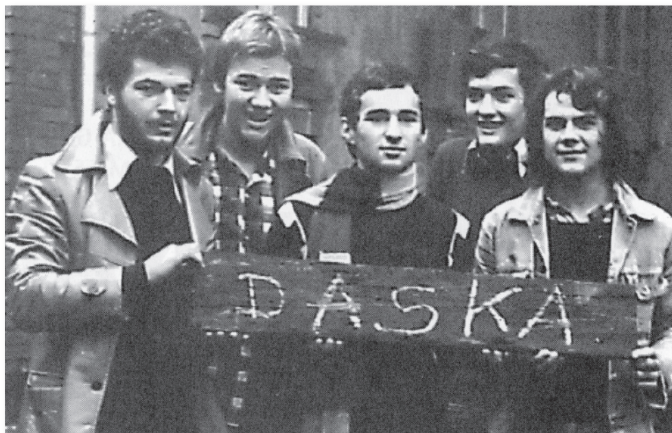
Prva službena fotografija članova DASKA-e, 1976. Autor: Damir Borojević – CUNI. Privatna zbirka: Drago Franić – JOE