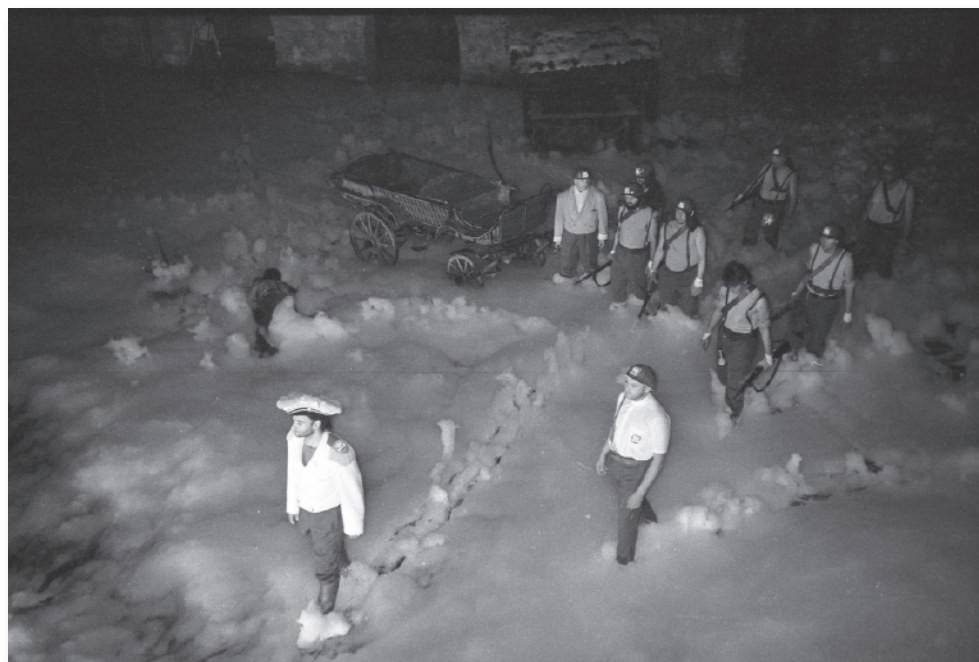
Fotografija predstave „2593.“, 1989. Autor: Karlo Rosandić Privatna zbirka: Karlo Rosandić