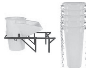
Slika 2. Cijevi za šutu