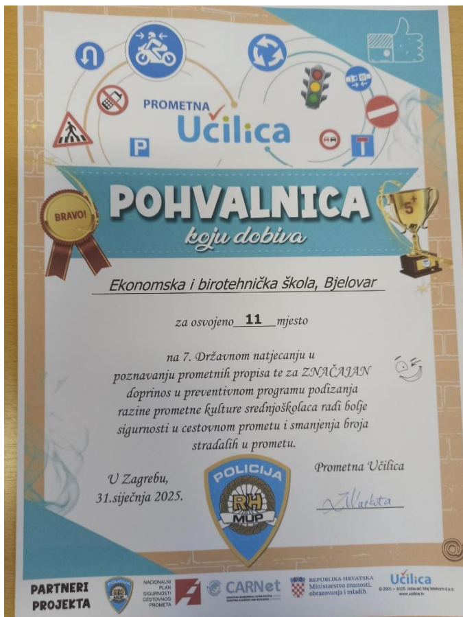
Slika 3 - Pohvalnica Ekonomskoj i birotehničkoj školi Bjelovar za osvojeno 11. mjesto

Ekonomski i birotehnička škola Bjelovar zauzela je 11. mjesto među 126 srednjih škola. Nastavnica Aleksandra Hohnjec dobila je priznanje „Prijatelj djece u prometu“, plaketu koju Prometna Učilica dodjeljuje za poseban doprinos u promicanju prometne kulture među mladima.