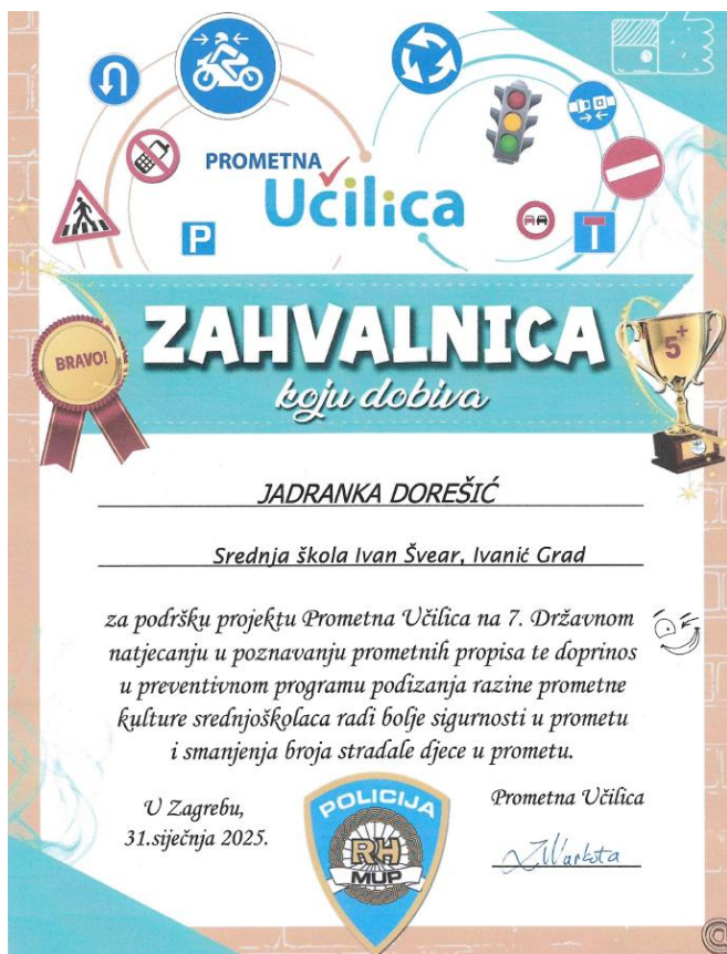
Slika 5 - Zahvalnica nastavnici Jadranki Dorešić za podršku projektu Prometna učilica

Posebna pažnja bila je posvećena individualnoj pripremi učenika korištenjem dostupnih materijala s platforme što je pridonijelo visokim prosjecima bodova te vidljivom rastu prometne kulture u razredima. Škola je po drugi put zaredom bila među najaktivnijima čime je dodatno ojačala svoj profil odgovorne odgojno obrazovne ustanove. Ovakav kontinuirani rad pridonio je većoj razini prometne pismenosti među učenicima, ali i povećao njihovu angažiranost u sličnim školskim i vanjskim projektima.