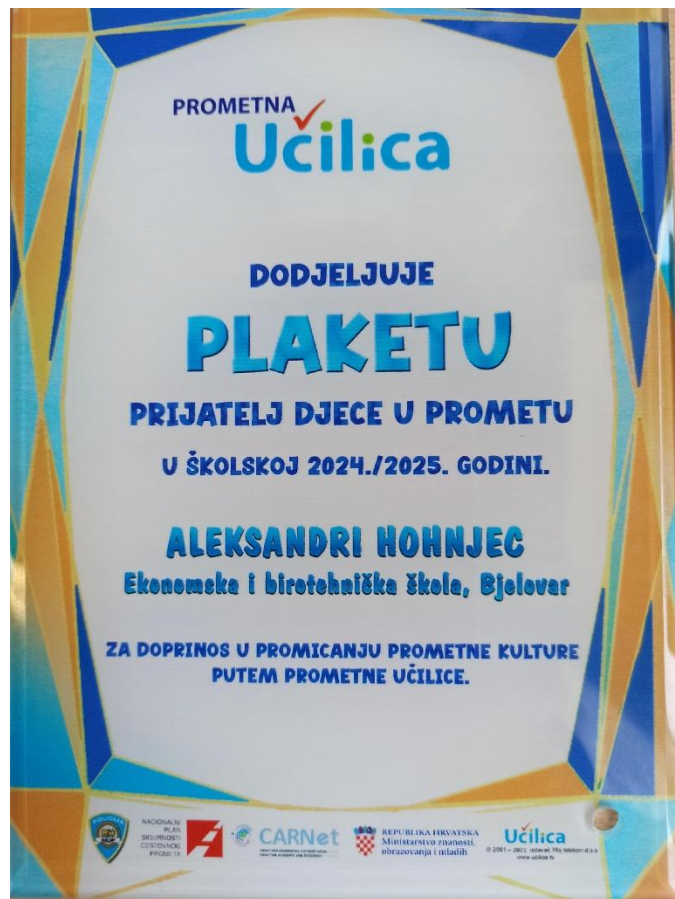
Slika 4 - Plaketa "Prijatelj djece u prometu" dodijeljena nastavnici Aleksandri Hohnjec

Ekonomski i birotehnička škola Bjelovar zauzela je 11. mjesto među 126 srednjih škola. Nastavnica Aleksandra Hohnjec dobila je priznanje „Prijatelj djece u prometu“, plaketu koju Prometna Učilica dodjeljuje za poseban doprinos u promicanju prometne kulture među mladima.