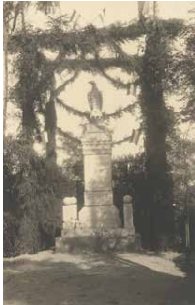
Slika III. Spomenik Hrvatskom Kraljevstvu u Požegi