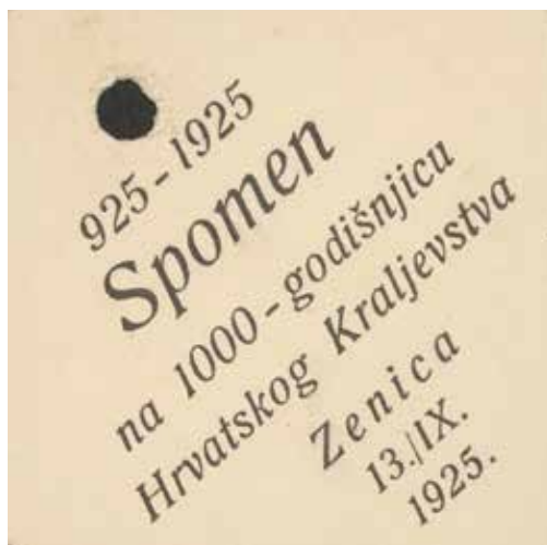
Slika VII. Značka sa zeničke proslave

Dana 3. i 4. listopada 1925. Hrvatske kulturne ustanove u Rumi u Istočnom Srijemu priređuju proslavu tisućugodišnjice Hrvatskoga Kraljevstva. Uvečer prvog dana proslava je obilježena povorkom, a sljedeći dan nakon sastanka u zgradi Hrvatskog doma svečanom misom u 9 sati. U nedjelju navečer uslijedio je kulturni program s koncertom na kojem je, među ostalim, izveden i pjesnički prikaz, za tu priliku često prikazivane drame „Na Duvanjskom polju”. 67 Osim toga, proslave su održane i u Srijemskoj Mitrovici, a spomen-ploče, od kojih neke postoje i danas, postavljene su u Zemunu, Petrovaradinu, Srijemskim Karlovcima i Golubincima. Kao specifičan primjer nameće se Subotica, grad sa značajnom hrvatskom populacijom, u kojoj su održane dvije proslave: prva, 8. rujna, u gradskoj vijećnici uz potporu Senata, Jugoslavenskog sokolskog društva i Vojvođanske pučke stranke, i druga, svečanija i masovnija, 20. rujna, u organizaciji Hrvatskog pjevačkog društva Neven i matičnog Hrvatskog prosvjetnog društva Neven, Hrvatske akademske omladine u Subotici i Bunjevačko-šokačke stranke, s bogatim programom koji je uključivao povorku, misu, postavljanje spomen-ploče i kulturne priredbe. U toj prigodi otkrivena je spomen-ploča s natpisom: „Spomen ploča prigodom 1000 godišnjice Hrvatskog Kraljevstva 925–1925. Postaviše: Bunjevački Hrvati”. 68