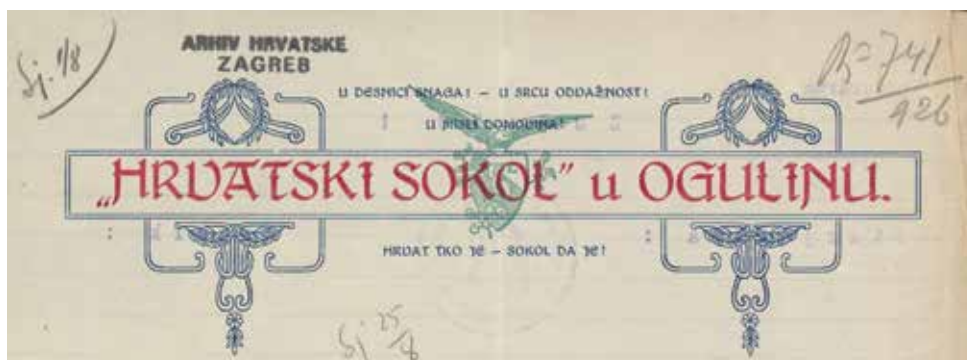
Slika VIII. Motiv s dopisa ogulinskog Hrvatskog sokola upućenog Družbi Braća hrvatskoga zmaja