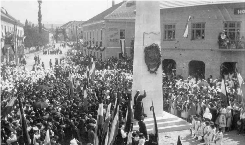
Slika IV. Proslava u Livnu