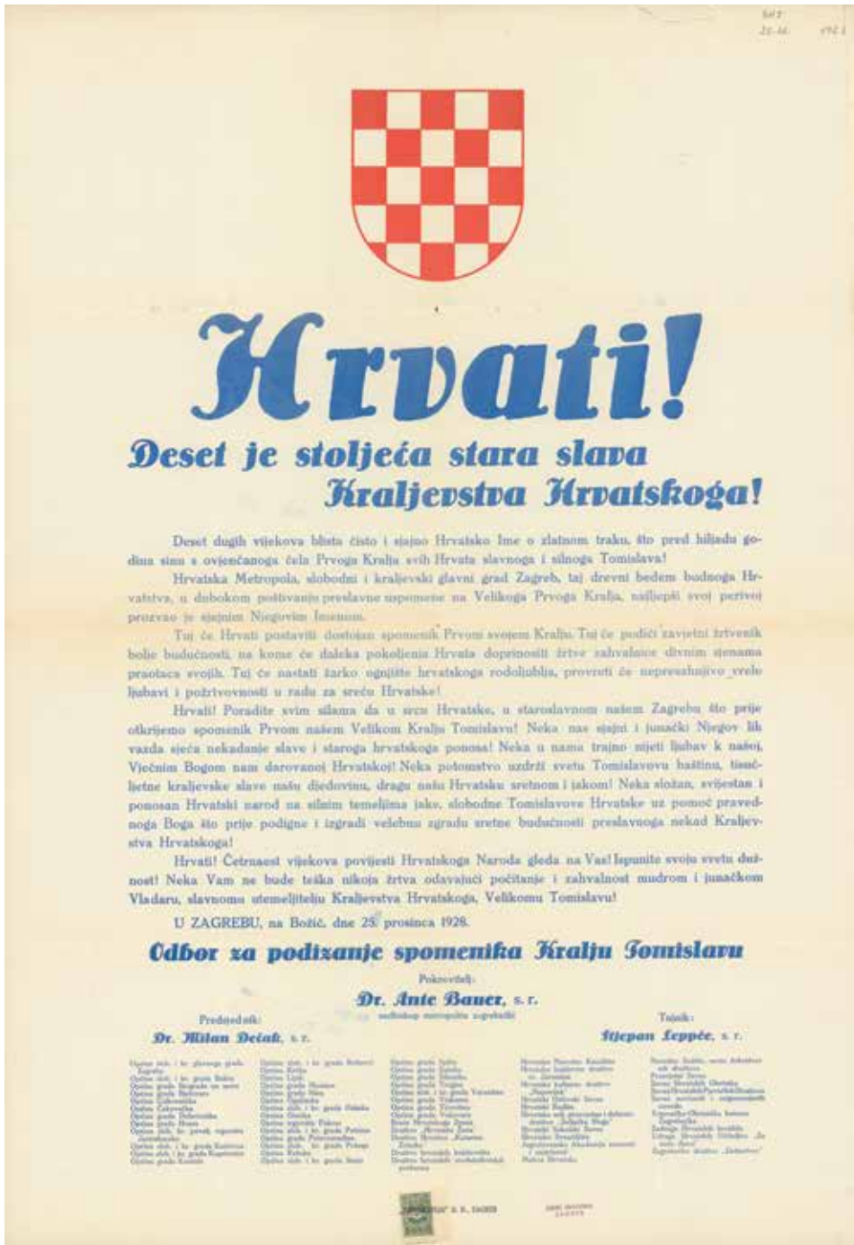
Slika IX. Plakat odbora za podizanje spomenika kralju Tomislavu iz 1928. godine