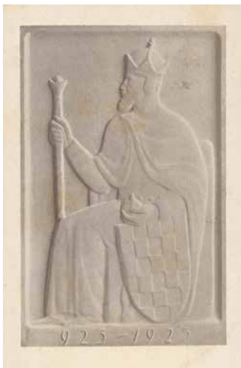
Slika XI. Razglednica s motivom plakete koju je povodom obljetnice dizajnirao kipar Frane Cota