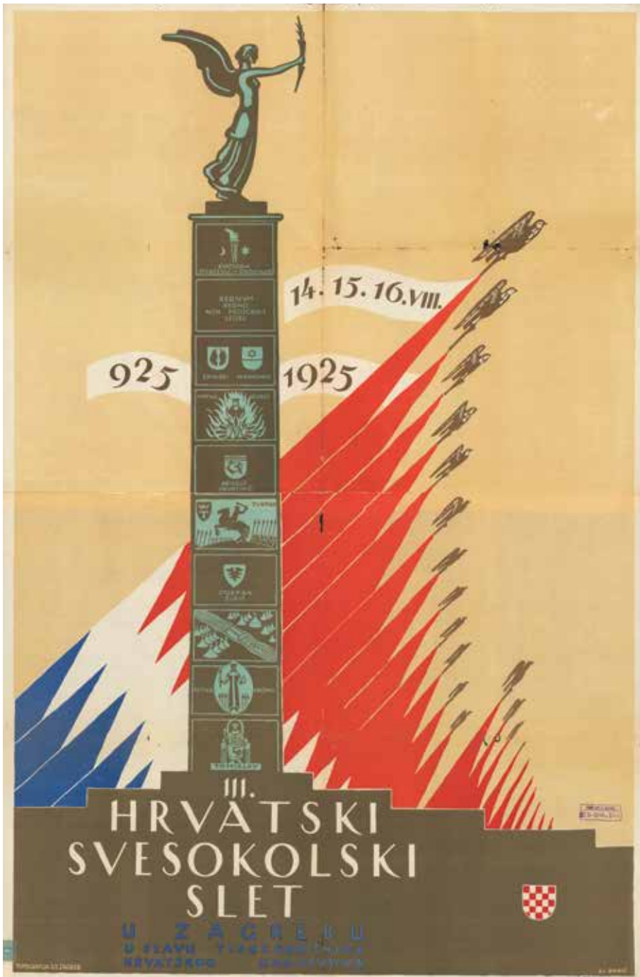
Slika X. III. Hrvatski svesokolski slet 14. – 16. kolovoza 1925.