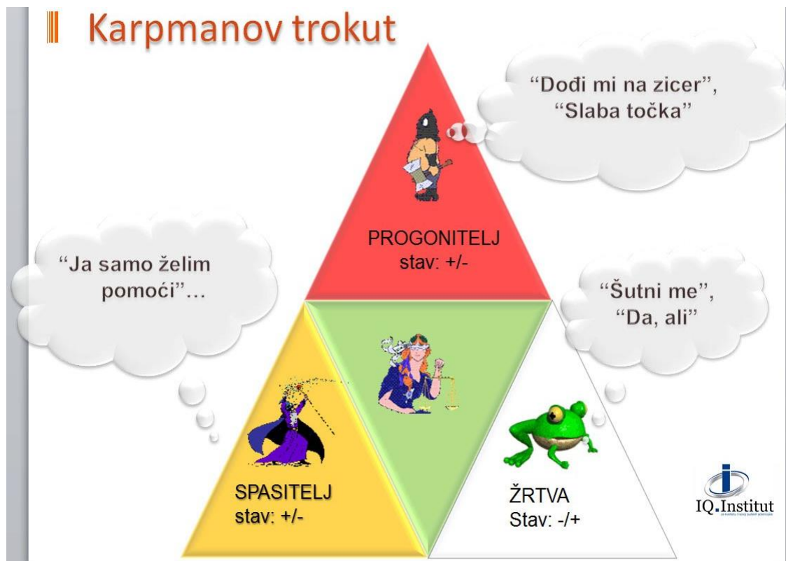
Slika 2. Karpmanov dramski trokut (preuzeto s : https://joyfullifebybranka.hr/zivotne-igre-karpmanov-trokut/ Datum 13.1.2026.)