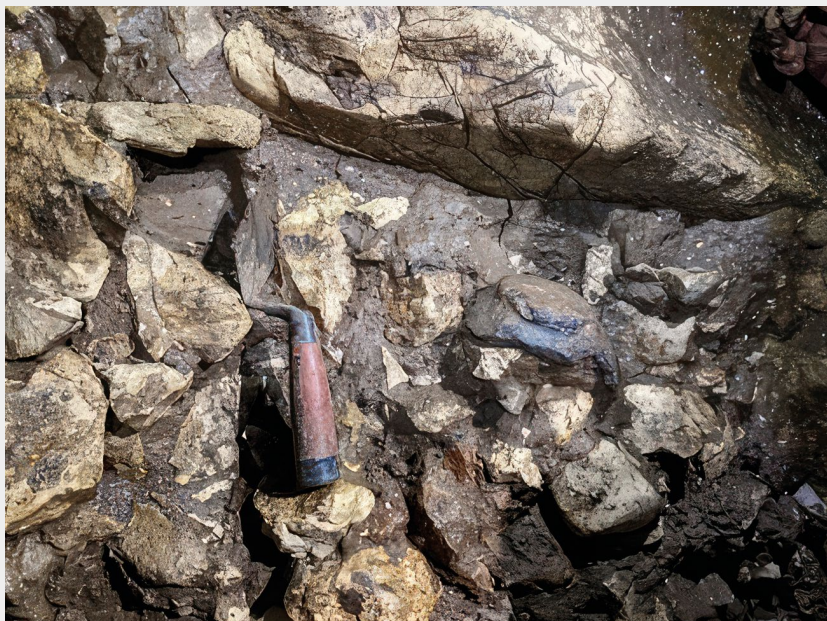
◄ Slika 7. Posuda 2 u profilu kulturnog sloja sjeverozapadnog zida prve dvorane