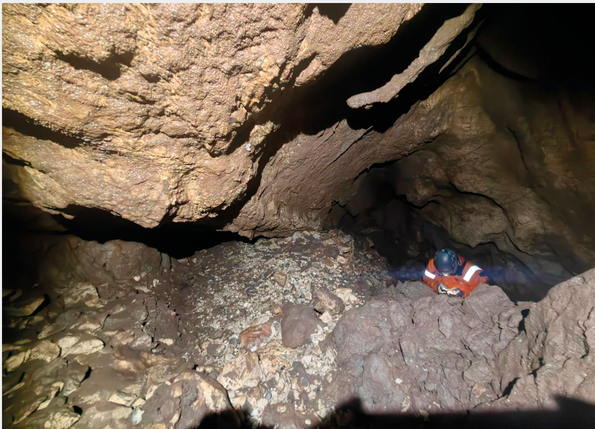
▲ Slika 8. Ninčevića (Mušićina) pećina