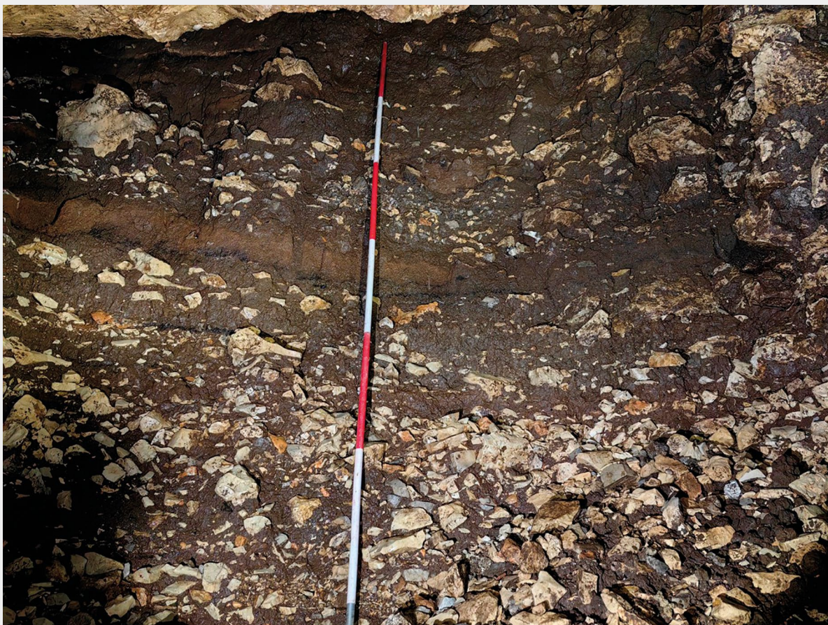
▲ Slika 5. Južni zid druge dvorane s profilom kulturnog sloja