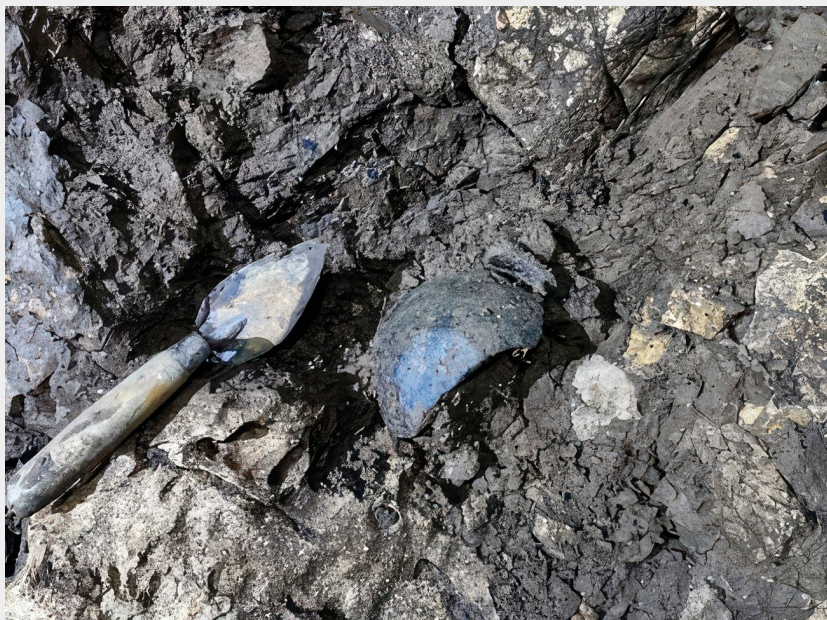
◄ Slika 6. Posuda 1 u profilu kulturnog sloja sjeverozapadnog zida prve dvorane

Prikupljena je manja količina keramičkih nalaza (T. 1) iz prve dvorane špilje. Osim keramičkih nalaza, koji su bili na površini, nisu prikupljene druge vrste nalaza, iako se u ispranom profilu nalazilo životinjskih kostiju i ulomaka keramike. Riječ je uglavnom o fragmentima posuda grublje izrade. Među njima se izdvaja, već spomenuta, skoro cjelovita posuda (T. 1: 5a, 5b) koju je voda izbacila iz kulturnog sloja na središnji dio prve dvorane. Posudi