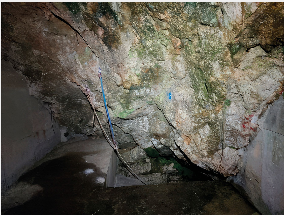
▲ Slika 4. Ulaz u Ninčevića (Mušićina) pećinu

Dvadesetih godina prošloga stoljeća ispred ulaza u špilju, s južne strane, nalazila se malena vrtača koja je bila obrađivana. Prema M. Margetiću, slojevi doline, kao i pećine, nagnuti su za 35 stupnjeva prema sjeveru, što je pogodovalo djelovanju oborinskih voda koji su utjecali na izgled špilje. Ulaz je bio u vidu jednolične duge cijevi dimenzija 70 cm x 110 cm, dužine 480 cm iz kojeg se širila dvorana duga 16,5 m, široka 9 m, a visoka 8 m. Na sjevernome dijelu, gdje se nalazi najveći nagib, zabilježili su i malu vrtaču širine 1,2 m, dok joj se dubina nije mogla odrediti zbog ispune od vanjskog šljunkovitog kamenja. Tada, južna manja dvorana, ostala je neistražena. Otvor koji je vodio u nju bio je toliko malen da se samo jedan učenik uspio provući do nje. Po njegovom opisu zaključeno je da se tu nalazio jedan od nekadašnjih otvora u špilju. Na temelju svega, doneseni su zaključci kako je nastala djelovanjem atmosferskih voda koje su se slijevale u nju za vrijeme jačih kiša. Voda je često ispunjavala cijelu špilju, a usred kemijskih djelovanja polako je nastalo proširenje prve dvorane. Unosila je u nju i njeno ispunjenje, vanjski materijal, koji ju je polako zatrpavao (Margetić 1925: 50-51).