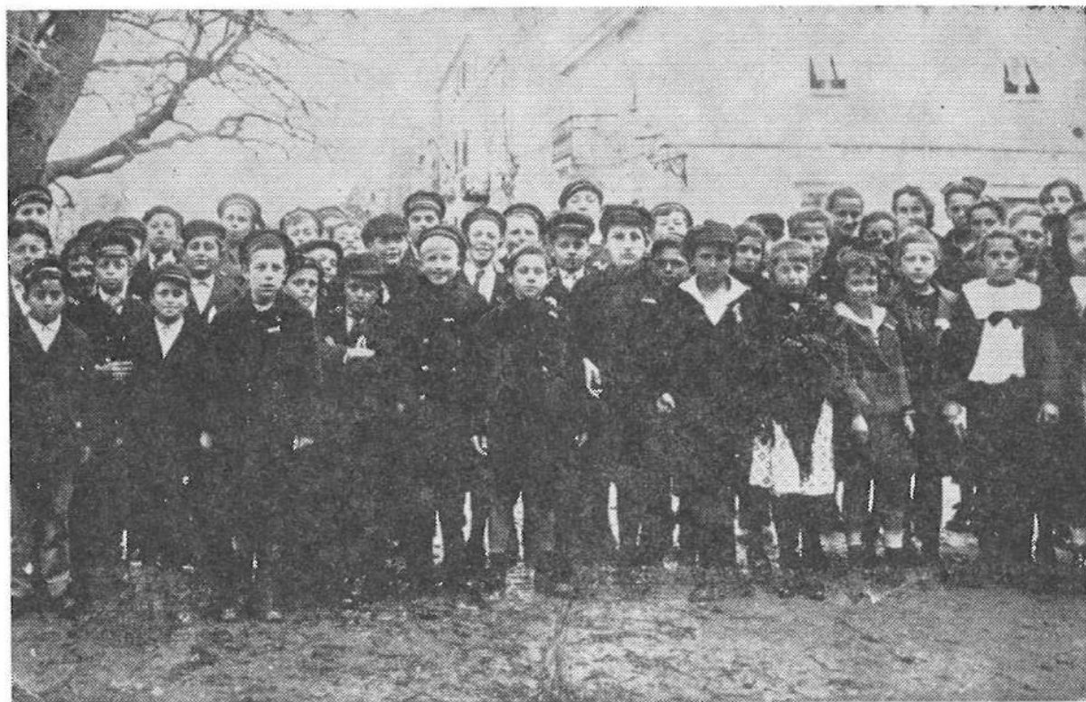
— Prve učenice i učenici gimnazije u Krku (šk. god. 1921/22)