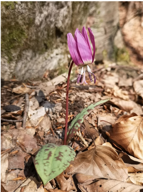
Slika 2. Tipičan izgleda habitusa vrste Erythronium dens-canis s ružičastim ocvijećem, Papuk, 24. 3. 2022.

Ova masa lapora posvuda je prožeta željeznim okerom, a najviše u dolu Jagodnjak, što možda značajno utječe na očuvanje ove bijele varijante Erythronium , koja ostaje čista čak i kad je presađena u vrtove zajedno s drugom, crvenom varijantom.