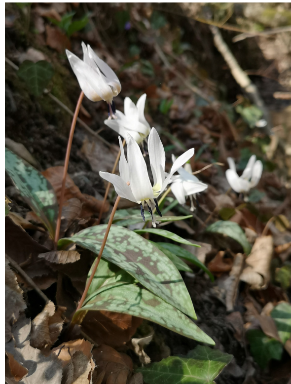
Slika 3. Bijelocvatuća populacija vrste Erythronium dens-canis, Požeška gora, 27. 3. 2022.