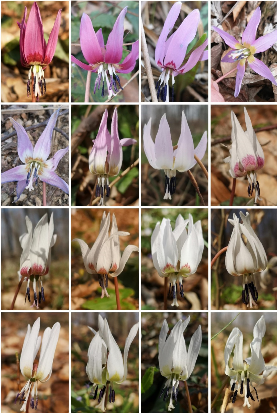
Slika 4. Varijacija boje cvjetova pasjeg zuba ( Erythronium dens-canis ) na Požeškoj gori.