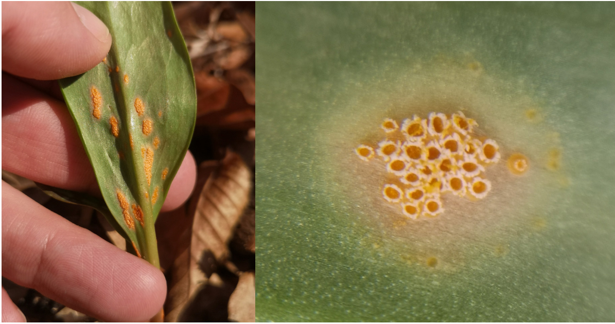
Slika 6. Parazitska gljivica hrđa pasjeg zuba ( Uromyces erythronii (DC.) Pass.).