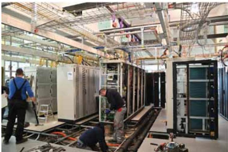
Slika 2. Radovi na uređenju podatkovnog centra HR-ZOO ZG1 u zgradi Srca u Marohničevoj ulici u Zagrebu, koji je neprekidno bio u punoj funkciji bez obzira na radove Figure 2. Works on the reconstruction of the HR-ZOO ZG1 data center in the building of SRCE in Marohničeva street in Zagreb. A key data center services were continuously in full operation regardless of the works