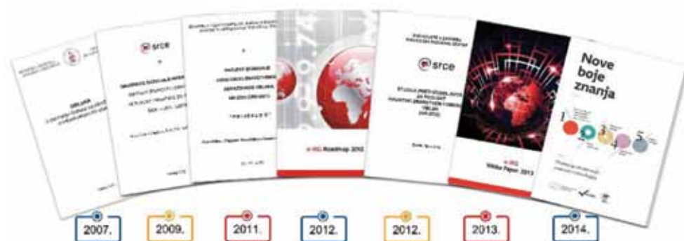
Slika 1. Neki od dokumenata koji su bili polazište za projekt HR-ZOO Figure 1. Some of the documents that were the incentive for the HR-ZOO project