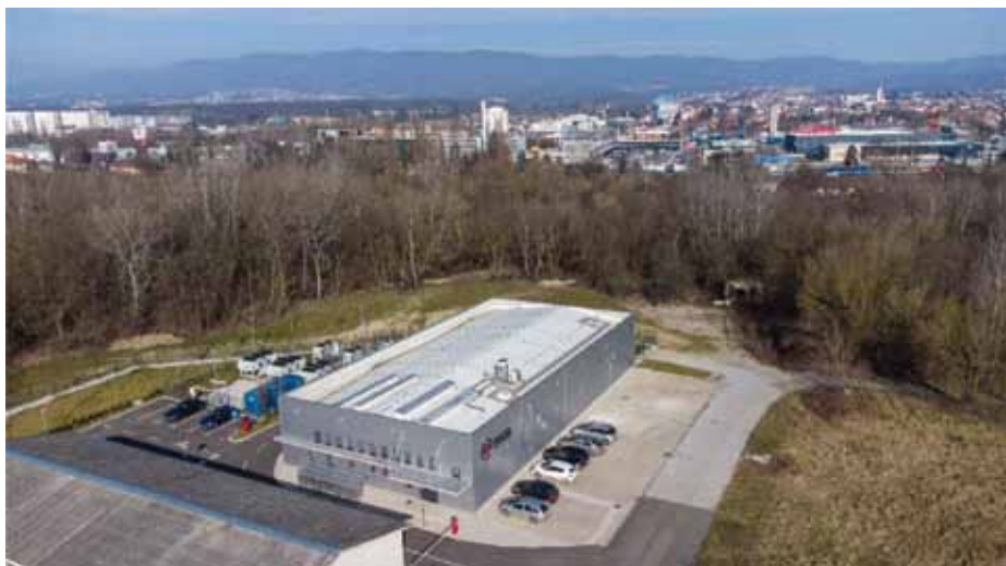
Slika 7. Zgrada novog podatkovnog centra HR-ZOO ZG2 u Znanstveno-učilišnom kampusu Borongaj u Zagrebu Figure 7. The building of the new data center HR-ZOO ZG2 within the Science and Education Campus Borongaj in Zagreb