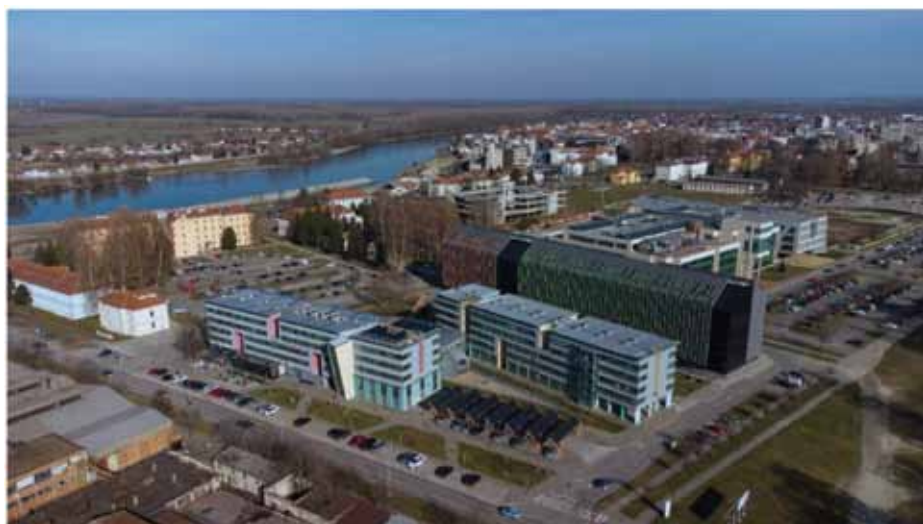
Slika 8. Zgrada u kojoj je smješten novi podatkovni centar HR-ZOO OS u Sveučilišnom kampusu Osijek Figure 8. The building where the new HR-ZOO OS data center is located within the University campus in Osijek