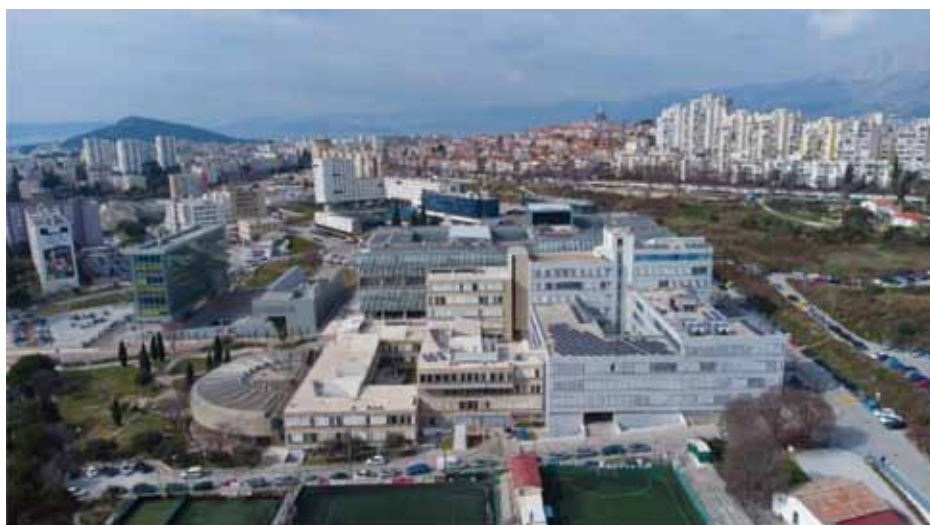
Slika 10. Zgrada FESB-a u kojoj je smješten novi podatkovni centar HR-ZOO ST u Sveučilišnom kampusu Visoka u Splitu

Figure 9. In the newly renovated data center HR-ZOO RI within the University campus Trsat in Rijeka