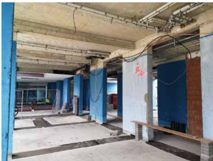
Slika 3. Početak radova na uređenju podatkovnog centra HR-ZOO OS u Osijeku Figure 3. Beginning of construction works on the reconstruction of the HR-ZOO OS data center in Osijek