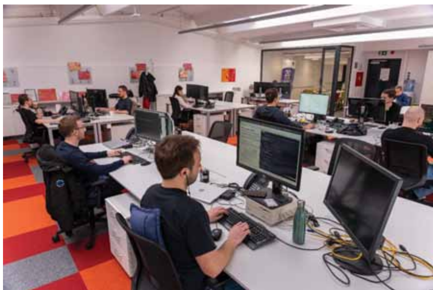
Slika 16. Radni prostor u zgradi HR-ZOO ZG2 za tim e-znanstvenika Srca koji daje podršku pri uporabi resursa za napredno računanje u HR-ZOO-u

osmisle i ostvare učinkovitu primjenu naprednih IKT komponenti i usluga HR-ZOO-a, a što uključuje i primjenu raspoloživih HR-ZOO resursa za napredno računanje za alate i metode koje dolaze iz novih, brzorastućih područja kao što su umjetna inteligencija, strojno učenje, visokoučinkovita analiza velikih podataka (engl.: big data / high performance data analytics ) i dr.