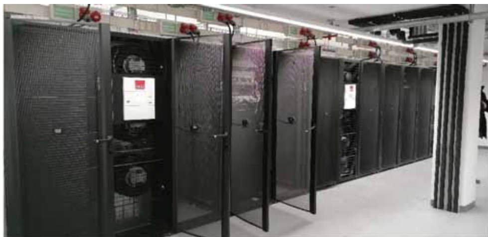
Slika 9. U novouređenom podatkovnom centru HR-ZOO RI u Sveučilišnom kampusu Trsat u Rijeci

Figure 9. In the newly renovated data center HR-ZOO RI within the University campus Trsat in Rijeka