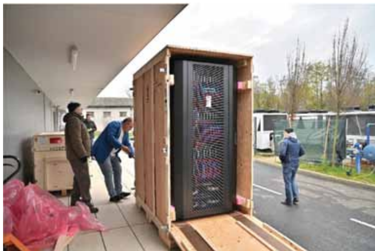
Slika 4. Isporiuka superračunala u podatkovni centar HR-ZOO ZG2 u Zagrebu Figure 4. Delivery of a supercomputer to the HR-ZOO ZG2 data center in Zagreb