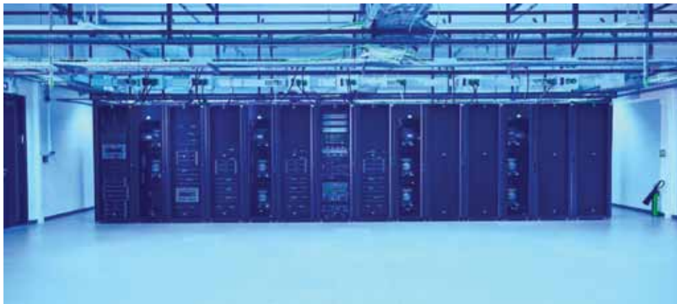
Slika 15. Računalni sustav “Vrančić” za napredno računanje u oblaku Figure 15. “Vrančić” computer system for advanced computing in the cloud

Ustanovama iz akademske i istraživačke zajednice unutar HR-ZOO-a osigurana je mogućnost izgradnje vlastitih virtualnih podatkovnih centara te uporabe virtualnih poslužitelja u skladu s njihovim aktualnim potrebama. Usluga je zasnovana na tehnologijama računarstva u oblaku, oslanja se na tehnologiju VMware Cloud Foundation [28] i realizira se na računalnom sustavu “Štampar” , koji omogućava izvođenje do 1.800 redundantnih virtualnih poslužitelja koji imaju na raspolaganju 10 PB spremiškog prostora.