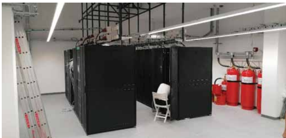
Slika 5. Radovi u novom podatkovnom centru HR-ZOO ST u Splitu bliže se kraju Figure 5. Works in the new data center HR-ZOO ST in Split are coming to an end

Novouspostavljeni podatkovni centri svečano su otvoreni 19. listopada 2022. [21], a sve komponente i usluge Hrvatskog znanstvenog i obrazovnog oblaka svečano su puštene u rad na središnjoj svečanosti 28. ožujka 2023. [22].