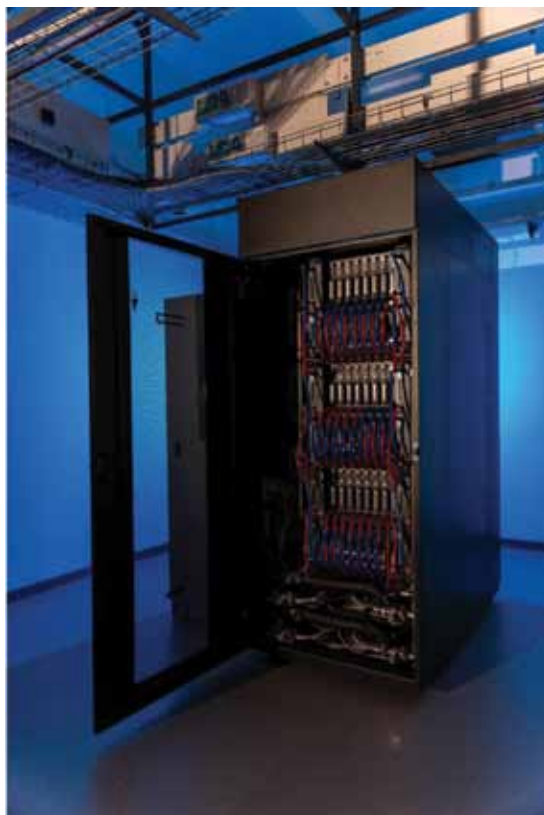
Slika 14. Superračunalo “Supek” – prvo petaskalarno računalo u Hrvatskoj Figure 14. Supercomputer “Supek” – the first petascale computer in Croatia

Važna računalna komponenta HR-ZOO-a jest i sustav za napredno računanje u oblaku “Vrančić” , koji predstavlja prilagodljivu, elastičnu i svestranu heterogenu računalnu okolinu, koja je po svojoj arhitekturi predstavnik računarstva s velikom propusnošću. “Vrančić” “isporučuje” velike količine računalne snage tijekom duljeg razdoblja dajući mogućnost istovremenog pokretanja kopija nekog softvera na većem broju računala. Namijenjen je širem skupu korisničkih aplikacija i sustava iz različitih znanstvenih područja, a koji zahtijevaju specifičnu programsku okolinu i značajnije procesorske i memorijske resurse. Sustav “Vrančić” raspolaže s ukupno više od 11.500 procesorskih jezgri, 48 TB radne memorije i 3 PB spremišnog prostora visokih performansi. Sustav se temelji na platformama otvorenog koda OpenStack [26] (sustav za upravljanje i pristup virtualnim resursima u oblaku) i Ceph [27] (sustav za upravljanje raspodijeljenim spremištem), koje se često koriste za implementaciju sustava po paradigmi računarstva u oblaku.