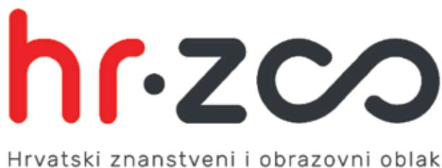
Slika 6. Vizualni identitet – logotip HR-ZOO

Hrvatski znanstveni i obrazovni oblak složeno je i integrirano okružje koje se sastoji od niza komponenti, odnosno skupa računalnih i spremišnih resursa smještenih u pet podatkovnih centara međusobno povezanih redundantnim širokopojasnim vezama velikog kapaciteta i velikih mogućnosti. Komponente HR-ZOO-a dostupne su korisnicima kroz niz usluga, odnosno kroz omogućavanje pristupa konkretnim resursima unutar HR-ZOO-a.