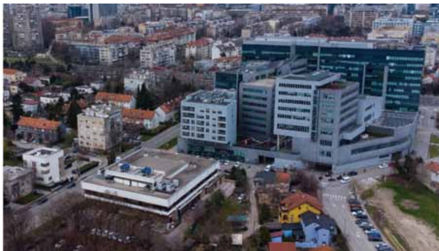
Slika 11. Zgrada Srca (lijevo dolje) u kojoj je smješten obnovljeni podatkovni centar HR-ZOO ZG1 u Zagrebu