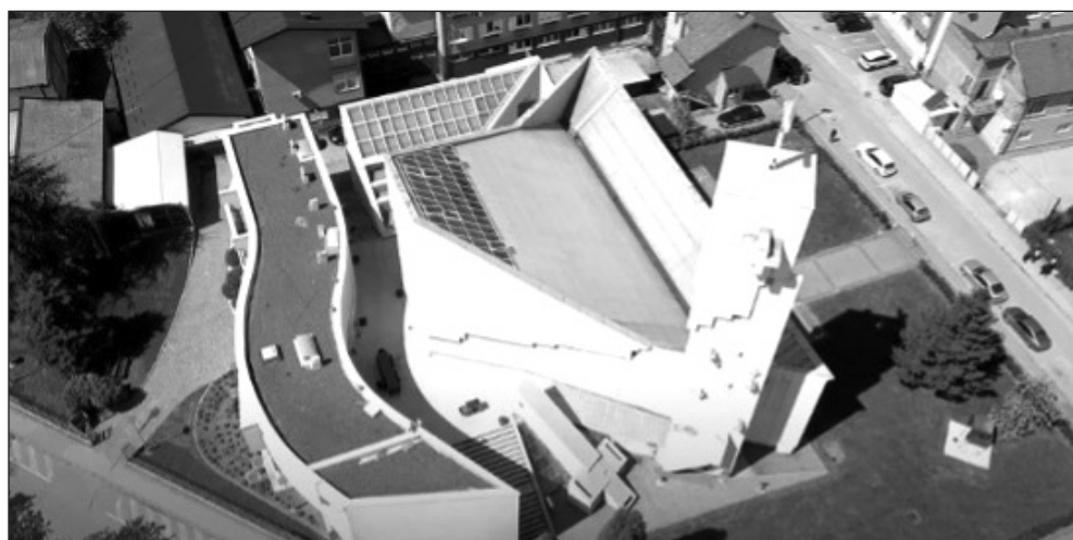
Prilog 5. Crkva sv. Petra i Pavla sa samostanom u Tuzli pogled iz zraka