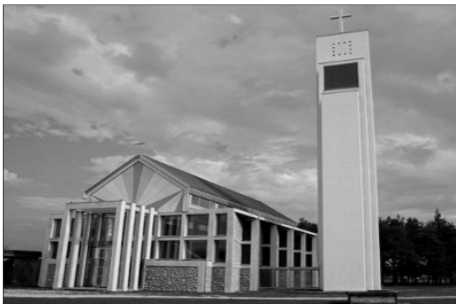
Prilog 14. Župna crkva u Ulicama