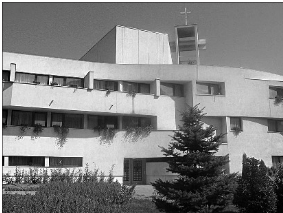
Prilog 4. Crkva sv. Petra i Pavla sa samostanom u Tuzli