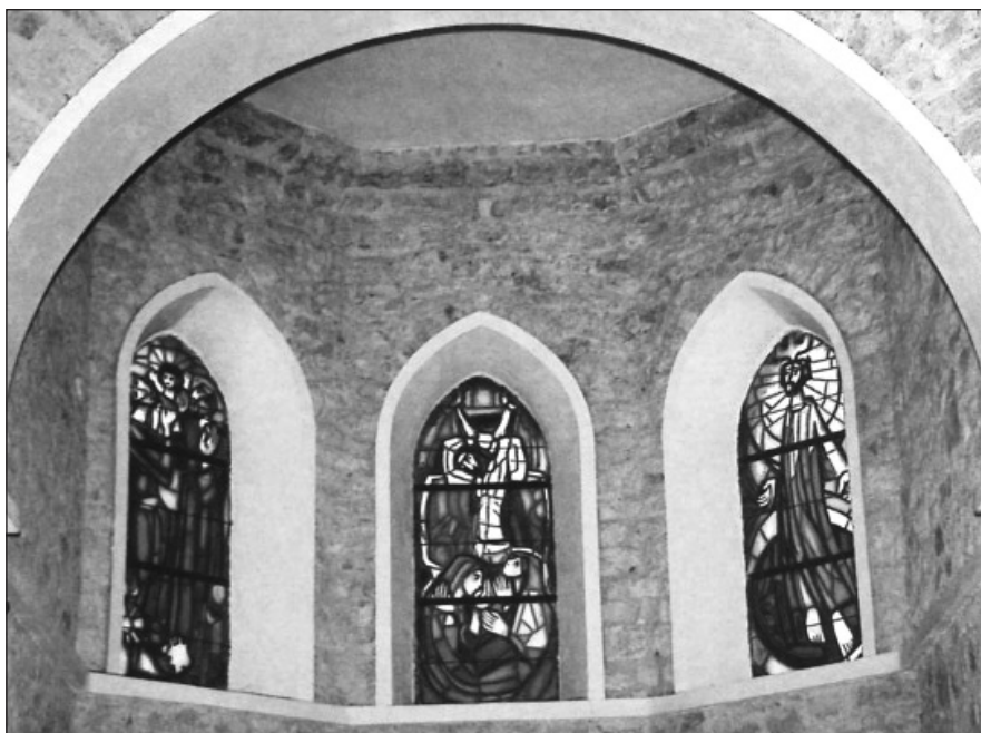
Prilog 7. Tri vitraja s tematskim sadržajima na teme: Kristovo rođenje, Raspeće i Uskrснуće u Crkvi u Breškama