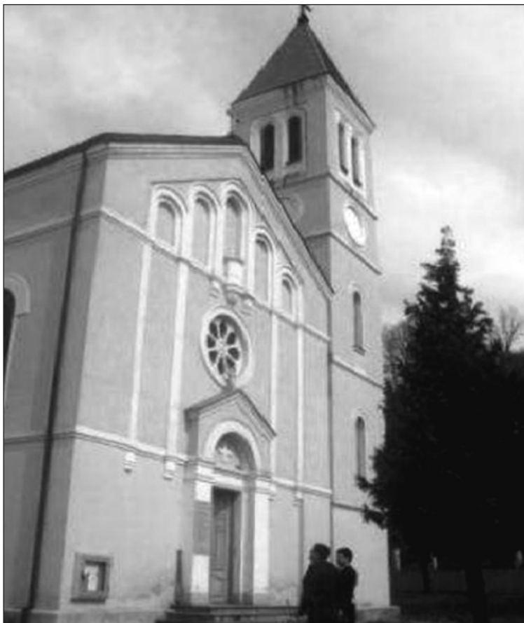
Prilog 10. Crkva sv. Ante Padovanskog u Lukavcu