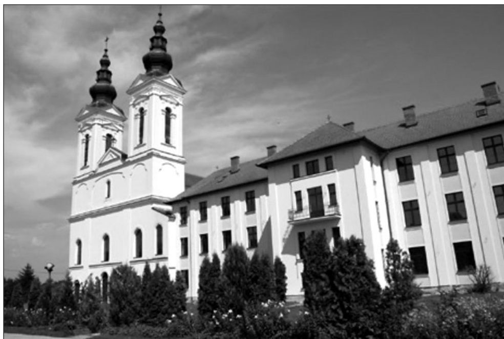
Prilog 18. Crkva Uznesenja Blažene Djevice Marije u Tolisi

U pročelja crkve, koju je Vancaš smatrao „najistaknutijom“ među franjevačkim sakralnim građevinama Bosne i Hercegovine, gotovo ne intervenira, dijelom i stoga što su zidovi ocijenjeni vrlo zdravima. Mijenja tek kupole i vrhove tornjeva koji postaju nešto reprezentativniji u odnosu na prijašnju situaciju i stilski ponovno određuju, barokniji. Na zidane dijelove tornjeva dograđuje jednostavne trokutaste zabate, a mjesto ranijih kupolastih kapa tornjeva, koje je stilski teško definirati, podiže neo-barokne visoke razvedene kape koje su cijelo pročelje učinile mnogo višim. 70