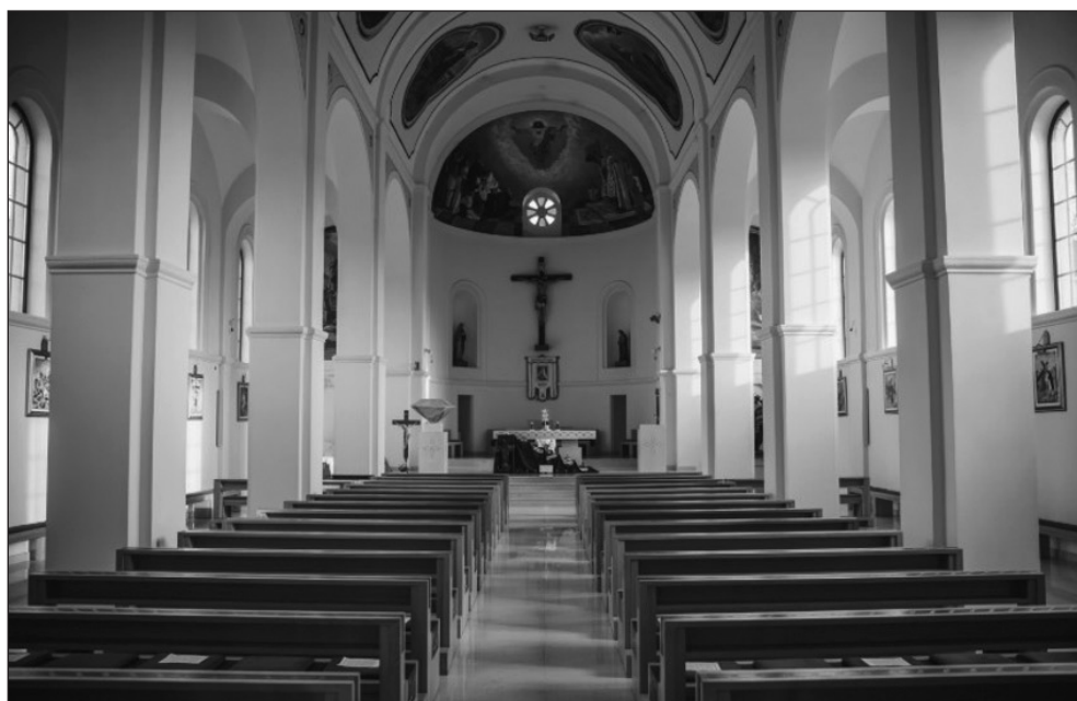
Prilog 12. Unutrašnjost crkve Presvjetlog Srca Isusova u Brčkom