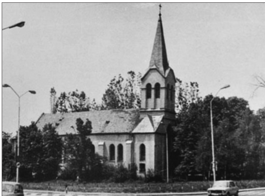
Prilog 2. Župna crkva sv. Petra i Pavla u Tuzli