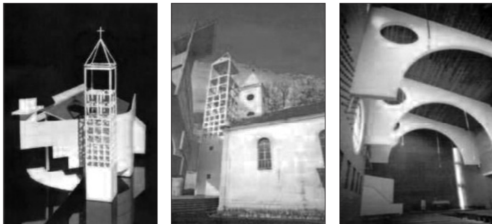
Prilog 13. Župna crkva u Zoviku