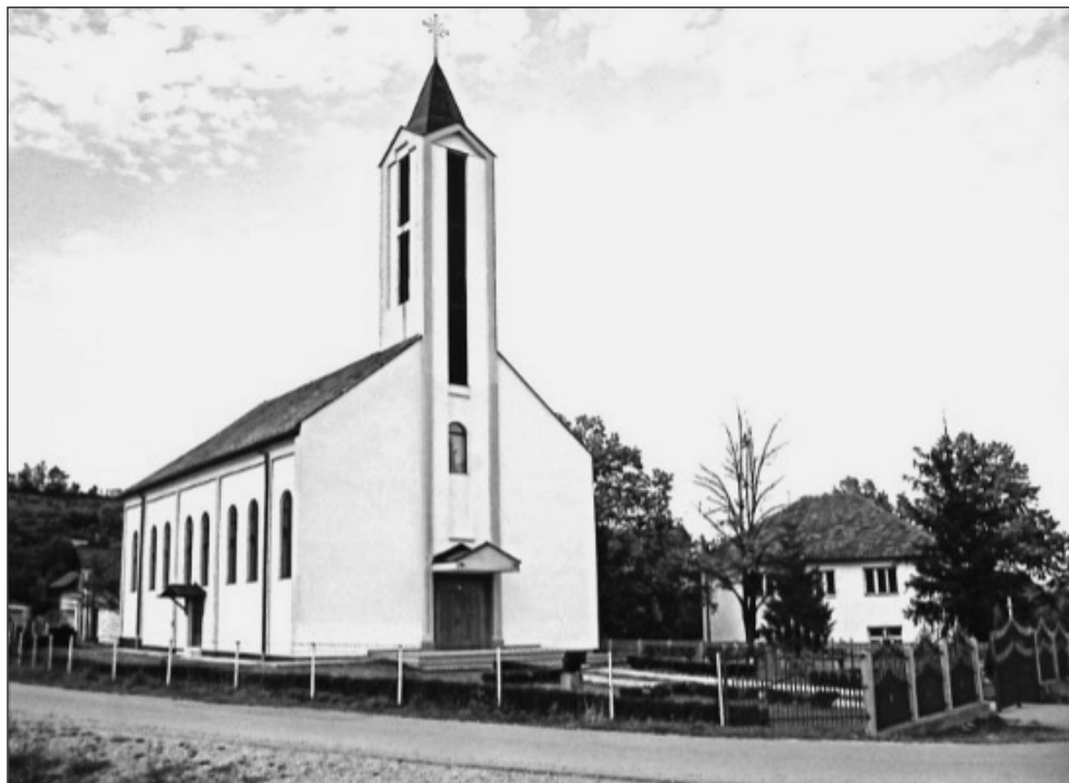
Prilog 8. Župna crkva u Drijenči

Salavarda 39 na zidnim je plohama ispred prezbiterija izradila dva mozaika u umjetnom kamenu: Uskrsnuće i Krštenje na Jordanu (300x175 cm). Premda su postaje formatom malene, jačina kolorita i dubina umjetničkog izraza čine ih posebnim, iako je tehnika mozaika po sebi vrlo zahtjevna, osobito kada se radi o malom formatu. Tako je čudesni spoj umjetničkog, religioznog i lijepog ostvaren i ovdje. 40