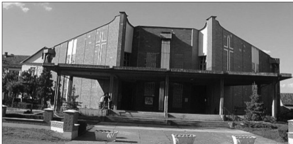
Prilog 20. Crkva sv. Ane Domaljevac

U crkvi se nalaze dva vitraja Đ. Sedera: Raspeti Krist i Sv. Ana . Put križa naslikao je M. Živković. Godine 2001. u crkvi je postavljeno raspelo autora I. Križanca. U dvorištu ispred crkve postavljen je 2000. brončani kip Sv. Ana , rad akademskog kipara iz Zagreba Slavena Miličevića. 78 Pod konac osamdesetih godina od jedne njemačke župe dobivene su rabljene orgulje na dar. 79