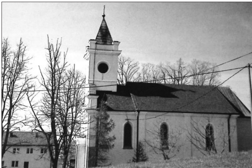
Prilog 6. Crkva u Breškama