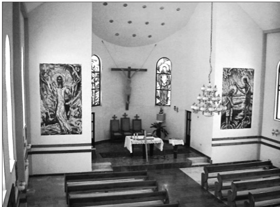
Prilog 9. Unutrašnjost župne crkve u Drijenči