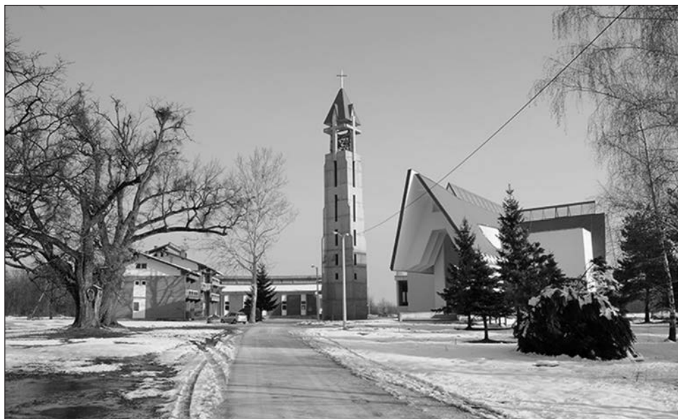
Prilog 19. Samostan i crkva Bezgrešnog Začeca BDM Dubrave

spašene te je Galerija „Šimun“ ponovno otvorena 10. listopada 2001. godine. Godine 2003. nabavljen je brončani kip Sv. Anto , rad Mile Blaževića. 75