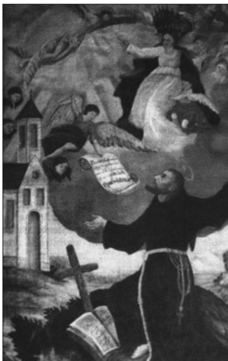
Prilog 15. Slika Gospe od Anđela

građevinske radove poduzeo je domaći sin fra Ilija Čavarović, koji je s prekidima bio župnik u Tramošnjici 21 godinu. Fra Ilija je, dobivši dozvolu od austrijskih vlasti 1888. otpočeo smiono gradnju nove velike crkve u novogotskom stilu. Zidovi crkve i temelji bili su od masivnog kamena koji su Tramošnjani dozvolom austrijskih vlasti dovozili sa zidina tvrđave u Gradačcu. 60