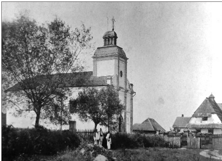
Prilog 16. Stara crkva svetišta Gospe od Anđela u Tramošnici Gornjoj 1900. god.