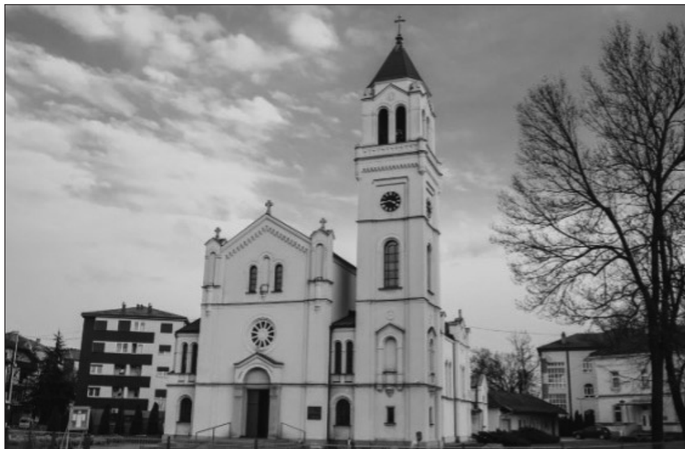
Prilog 11. Crkva Presvjetlog Srca Isusova u Brčkom