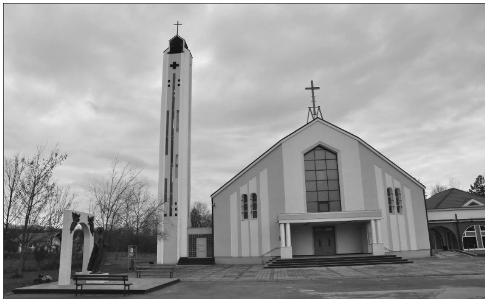
Prilog 17. Crkva svetišta Gospe od Anđela u Tramošnici Gornjoj