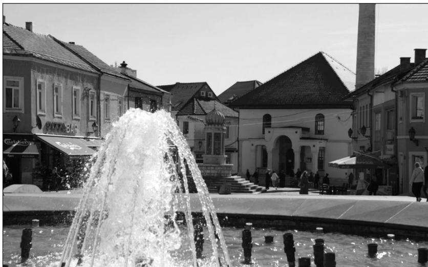
Prilog 7: Čaršijska česma između Čaršijske džamije i fontane na Trgu žrtva genocida u Srebrenici