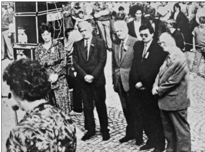
Prilog 5: Sa otvaranja Čaršijske česme u Tuzli, 2. oktobra 1988. godine