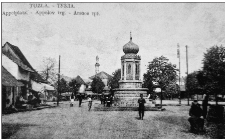
Prilog 3: Gradska česma. Razglednica je 7. IV 1911. poslata iz Tuzle u Sopran (Mandžić, 39)