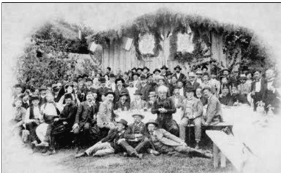
Prilog 2: Sa otvaranja Vodovoda u Tuzli 1910. godine, str. 50