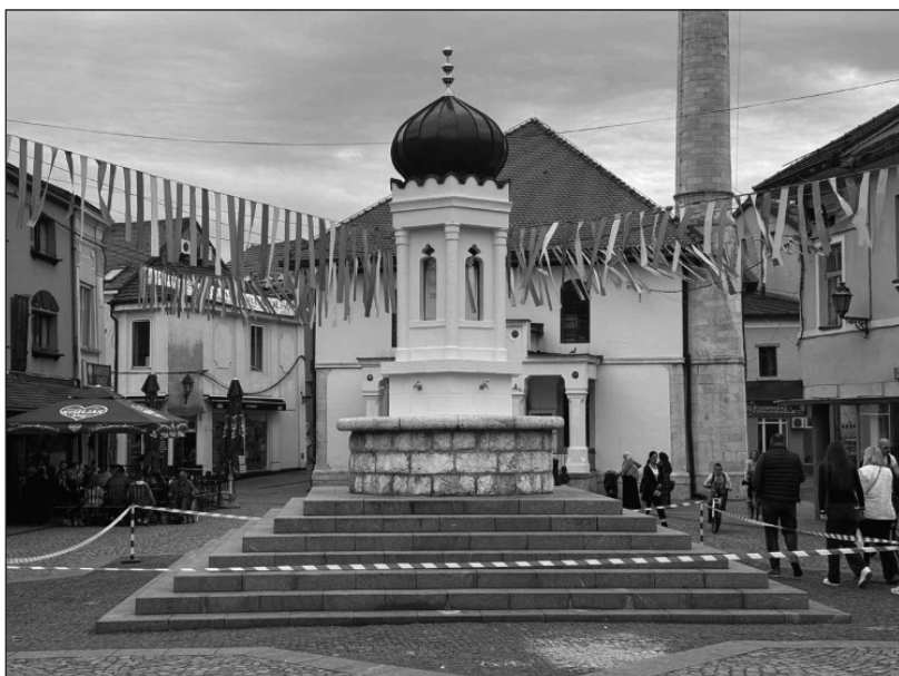
Prilog 6: Današnji izgled Čaršijske česme u Tuzli, 2025. godina