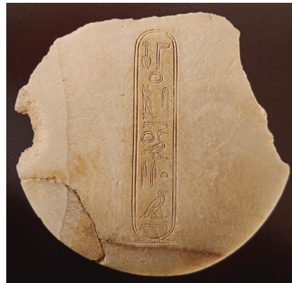
Slika 5: Poklopac s imenom faraona Khiana, HM \Lambda 263 (Knos, 15. dinastija) (Karetsou et al. 2001: 83, br. 62)

Posebno važan nalaz, kako za kretsko-egipatske odnose, tako i za usklađivanje njihove kronologije, predstavlja kameni poklopac s imenom faraona Khiana (HM \Lambda 263), vladara 15. dinastije, koji je otkriven u Knosu (Karetsou et al. 2001: 82, br. 62; Phillips 2008b: 98, br. 163) (slika 5). Khian je bio jedan od vladara Hiksa te mu je prijestolnica bila u Avarisu (Tell el-Dab'a). Ovaj je poklopac, i njegova odgovarajuća posuda koja nije ostala sačuvana, mogao biti dio kraljevskog ili diplomatskog poklona kojemu je cilj bio učvrstiti političke i ekonomske veze između zemalja (Warren 1995: 3). 16 Poveznica Avarisa i Krete u ovome razdoblju vidljiva je još na zlatnome privjesku, bodežu te kamares keramici pronađenima u Avarisu. Zlatni privjesak pronađen u grobnom kontekstu prikazuje dvije životinje, najvjerojatnije pse, koji