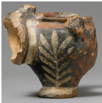
Slika 6: Kamares posuda s izljevom, MMA 22.1.1406 (Lišt, SM IB-IIA)