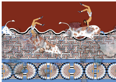
Slika 9: Prikaz preskakanja bikova u palači u Tell el-Dabi, 18. dinastija (Bietak 2007: 292, fig 27)

nastale u drugom međurazdoblju, ali danas se datiraju u ranu 18. dinastiju (Bietak 1996: 72; Matić 2015b: 148). Freske u Tell el-Dabi pronađene su u fragmentima u palači te su naknadno rekonstruirane (Bietak i Marinatos 1995; Bietak 1995). Najpoznatije su one s prikazima skakača i preskakanja bikova (slika 9) koje su pronađene u palačama F i G (Bietak 2010: 13, 15). Skakače prepoznamo po tipičnoj dugoj crnoj kosi te po minojskom kiltu i čizmama. Za razliku od prikaza u Knosu, gdje je koža skakačima obojana u crveno-smeđu boju, na slikama iz Tell el-Dabe koža im je žučkaste boje te je možda simbolizirala, uz dijelom obrijanu glavu, mladu dob skakača (Bietak i Marinatos 1995: 54; Bietak 2013: 193). Bikovi su naslikani bijelom bojom sa smeđim ili crnim flekama, a posebno je zanimljiv bik s glavom naslikanom