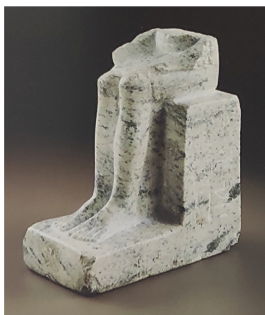
Slika 3: Userova statua, HM Λ95 (Knos, Srednje kraljevstvo) (Karetsou et al. 2001: 61, br. 39)

Drugi je zanimljiv nalaz sistrum iz Archanesa (HM II27695) koji se datira u SM IA te imitira egipatske primjerke (Karetsou et al. 2001: 267, br. 265; Phillips 2008b: 35–36, br. 53). 9 Ovaj instrument eliptičnog oblika napravljen je od gline (za razliku od egipatskih sistruma koji su izrađivani od fajanse ili metala), a sama mu je ručka šuplja. Pet u potpunosti rekonstruiranih sistruma i fragmenti još jednog pronađeni su u špilji kod mjesta Hagios Charalambos te su vjerojatno bili dio originalnih ukopa (Betancourt i Muhly 2006; Betancourt et al. 2008: 577). Kao i primjerak iz Archanesa, ovi sistrumi bili su izrađeni od gline, ali su za razliku od njega imali čvrstu i punu ručku. Vjerojatno je najpoznatiji prikaz sistruma onaj na Vazi žeteoca (HM Λ184) koja je pronađena u Aja Trijadi. Na vazi je prikazana procesija u kojoj predvodnik nosi sistrum, dok tri pjevača hodaju za njim (Betancourt i Muhly 2006: 432). Nije u potpunosti sigurno jesu li sistrumi imali na Kreti istu simboliku kao i u Egiptu. S obzirom na to da su pronađeni u