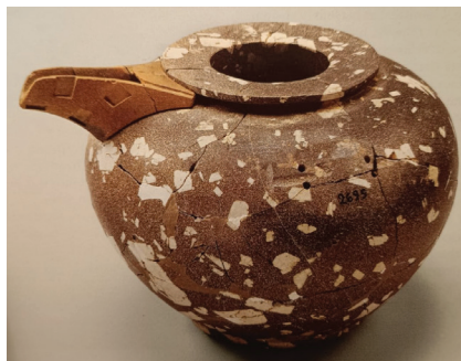
Slika 8: Posuda s izljevom, HM Λ2695 (Zakro, 1. dinastija) (Karetsou et al. 2001: 209–210)

69). Neke posude imaju naznake korištenja i popravljanja, pokazujući da su se duže vrijeme koristile prije nego što su stavljene u grobnice (Colburn 2008: 203). Neke od tih posuda možda su se čuvale kao dio naslijeđa. Međutim, ne može se odbaciti mogućnost da su neke posude došle na Kretu točno u vrijeme kada se datira njihov kontekst pronalaska, bez obzira na to što se one same datiraju u ranije doba. Egipatske su se grobnice tijekom drugog međurazdoblja i Novog kraljevstva često pljačkale i njihov se sadržaj prodavao dalje na tržištu (Bevan 2007: 124). Možda su te ranije egipatske posude došle na Kretu upravo ovim putem. Zapravo, i jedno i drugo objašnjenje može biti točno.