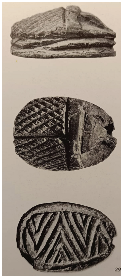
Slika 2: Minojski skarabej, „bijeli komad”, HM Σ-K1227 (Platanos, SM IA-B) (Karetsou et al. 2001: 305, br. 299)