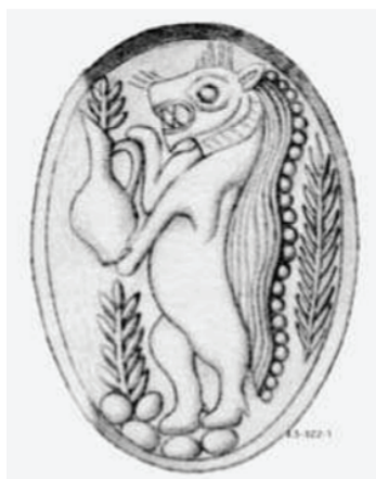
Slika 4: Prikaz minojskog genija na pečatu (Fest, SM II) (Blakolmer 2015a: 201, fig. 3)