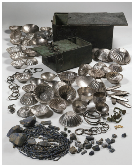
Slika 7: Blago iz Toda, Louvre E 15128-E 15318

Kasno je brončano doba obuhvaćalo kasno minojsko doba na Kreti i Novo kraljevstvo u Egiptu. Ovo će razdoblje biti vrijeme najintenzivnijih kontakata između