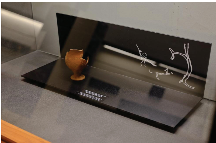
Slika 3: Isejska čaša s motivima lovca, psa i jelena, 2. st. pr. Kr.