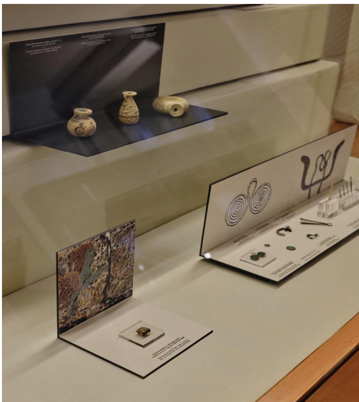
Slika 4: Aribali korintskog tipa i staklena pločica s prikazom sirene, 6. st. pr. Kr.