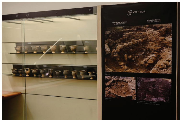
Slika 2: Skifi gnathia tipa prilagani u pogrebnom ritualu, 3. st. pr. Kr.

Arheološka istraživanja na Kopili provode se već više od 12 godina, pa je cilj izložbe bio predstaviti rezultate dugogodišnjeg rada na ovom jedinstvenom lokalitetu smještenom na padini poviše Blata na otoku Korčuli. Riječ je o prapovijesnom gradinskom naselju čiji razvoj možemo pratiti barem od srednjeg brončanog doba, s popratnom nekropolom karakterističnom po strukturi gomila jedinstvenoj na cijelom prostoru Mediterana zahvaljujući kojoj je u arheološku terminologiju uveden termin grobnice tipa Kopile . Sam lokalitet pronađen je slučajno, u 19. stoljeću, zahvaljujući težaku koji je obnavljao suhozid u Blatskom polju.