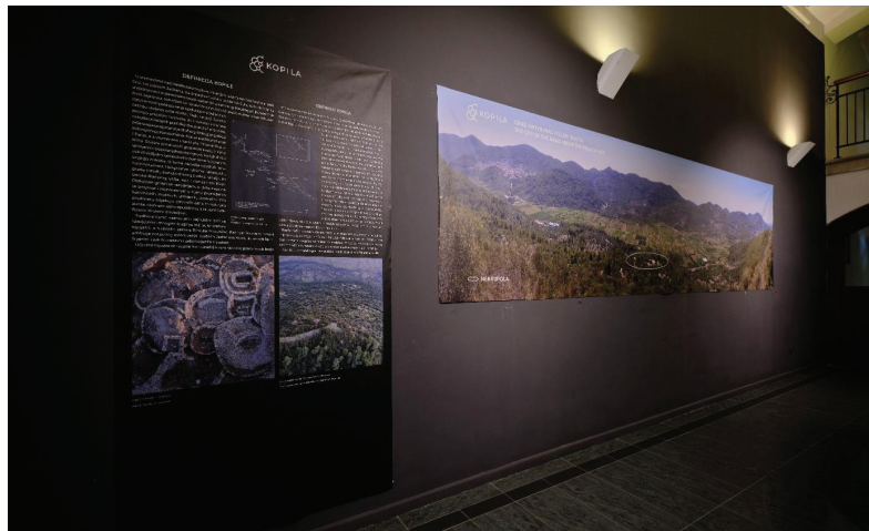
Slika 1: Prikaz položaja nekropole i gradine Kopila u prostoru