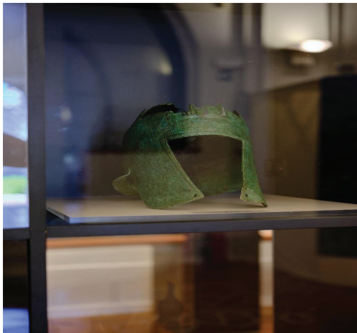
Slika 6: Brončana kaciga ilirskog tipa, 5–4. st. pr. Kr.

i smrti, podsjećajući na njihovo međusobno ispreplitanje. Cijela izložba suptilno je odisala mračnom atmosferom u kojoj su se stopili život i smrt zajednice davno prošlog vremena: ispreplitanje prošlosti i budućnosti ostat će karakteristika Kopile i u nadolazećim vremenima, ne samo zbog arheoloških istraživanja koja su nastavljena i ove jeseni, već i zato što je Općinsko vijeće Općine Blato u studenom ove godine prepoznalo važnost Kopile i dodijelilo ovom lokalitetu status arheološkog parka. Otkrivanje prošlosti Kopile nastavlja svoj put, pa utoliko nije dvojbeno da je ovo tek jedna u nizu uspješnih izložbi koje će biti posvećene ovom jedinstvenom arheološkom biseru čija priča dopunjuje (pra)povijest Jadrana, ali i Mediterana.